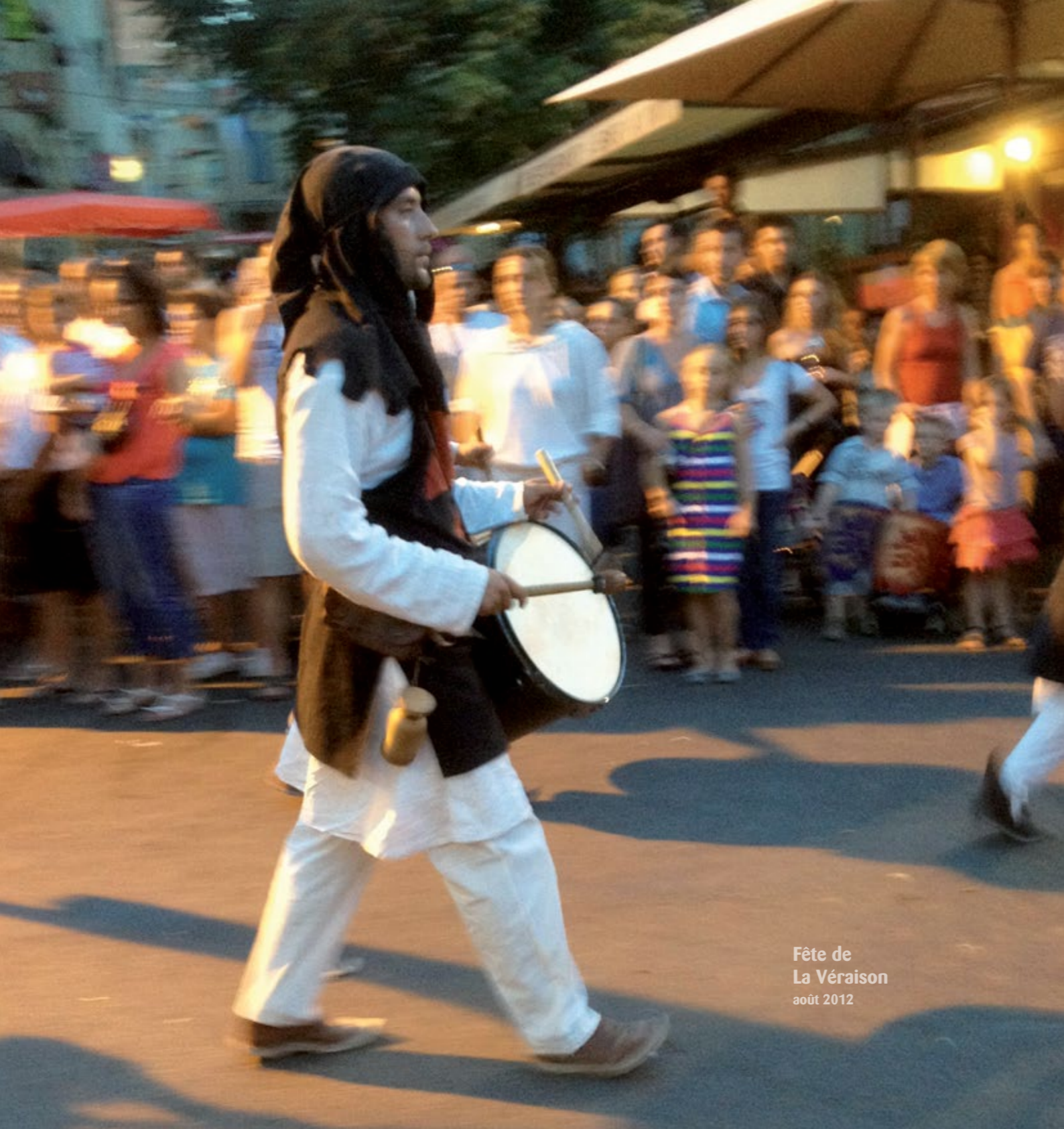
Fête de La Véraison août 2012