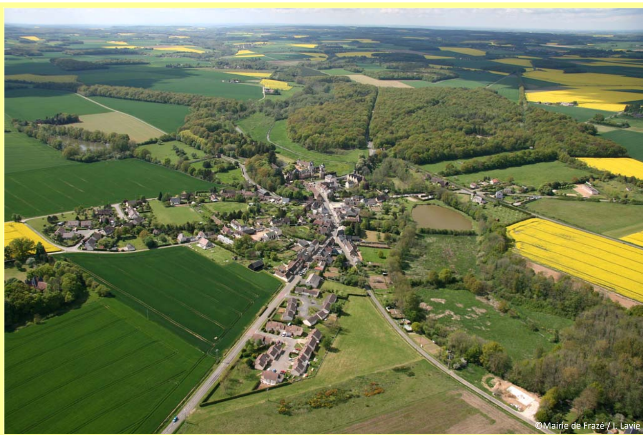
Frazé vu du ciel – 01.05.09

En cas de besoin d'intervention sur le réseau d'eau, appelez le 06.71.53.83.31