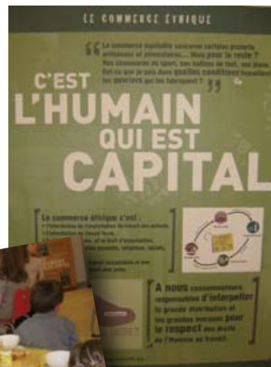
Petit déjeuner équitable à l'école maternelle

Laissons à nos enfants suffisamment de ressources naturelles, favorisons la diversité sociale et les liens intergénérationnels, préservons notre économie de proximité, humaine et riche en savoir-faire. Ce sont nos priorités pour les années à venir.