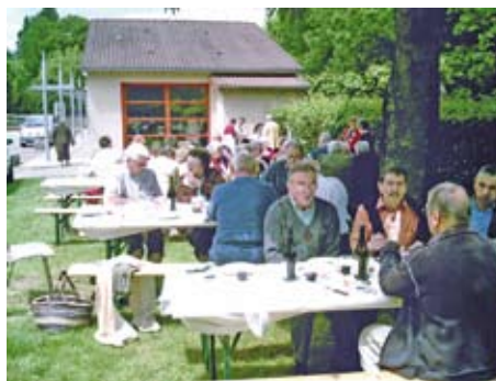
Retrouvailles conviviales autour d'un bon repas pour le comité local de la FNACA.