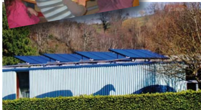
Panneaux solaire piscine municipale