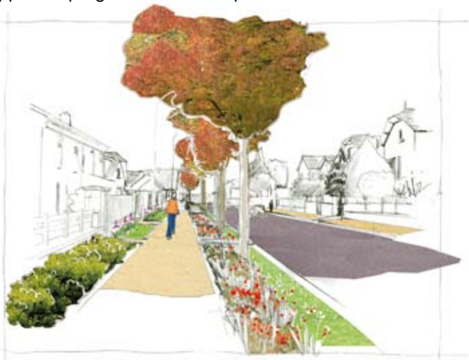
Esquisse du projet d'aménagement urbain de l'avenue Jean-Rebier

Phase 1 : L'avenue J. Rebier pour le mois de juillet et une fin des travaux en octobre avant le début des travaux de la réfection du pont sur la RN21.