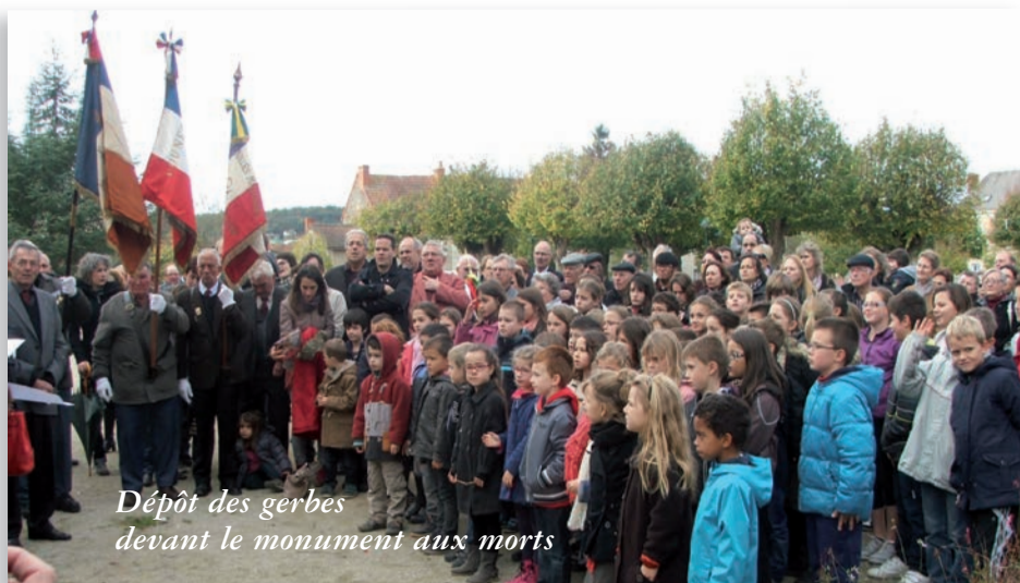
Dépôt des gerbes devant le monument aux morts

Depuis 2013, l'école mène un projet pédagogique de multi-partenariat européen COMENIUS avec des écoles anglaise, espagnole et italienne. Ce projet offre aux élèves de réelles situations de communication, une grande ouverture culturelle et un enrichissement linguistique. Dans le cadre de ce projet, les élèves de CM1 et CM2 sont partis en mai 2014 à Londres, durant 5 jours, et ont pu rencontrer leurs partenaires anglais. Cette classe de découvertes avait également pour objectif une liaison entre le CM2 et la 6e puisque