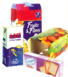
les boîtes et les sur-emballages en carton