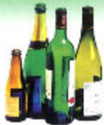
les bouteilles et flacons