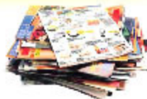
les prospectus et papiers d'écritures