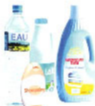
les bouteilles et flacons en plastique

Possibilité de poser les gros cartons, pliés et ficelés, au pied des bacs jaunes.