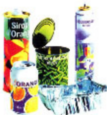
boîtes métalliques : aciers, aluminium