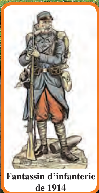
Fantassin d'infanterie de 1914