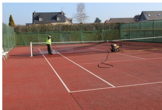
Rénovation du terrain de tennis

Et le remplacement ou renouvellement d'une quinzaine de panneaux de signalisation sur le territoire de notre commune.