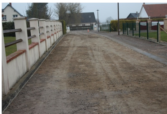
Travaux de voirie Terre du Château