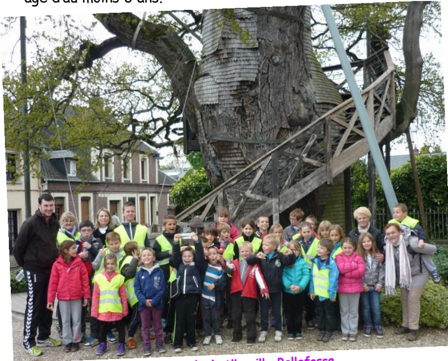
La randonnée à Allouville Bellefosse durant la chasse aux œufs de Pâques.

Les programmes avec les inscriptions sont distribués à l'école Jehan Le Pôvremoyne deux semaines avant chaque période de vacances. Pour les collégiens ou les enfants scolarisés à l'extérieur de la commune, les feuilles d'inscriptions sont disponibles sur le présentoir dans le hall de la mairie ou téléchargeable sur le site de la commune www.valliquerville.fr