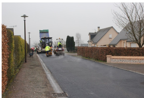
Mise en place de l'enrobé