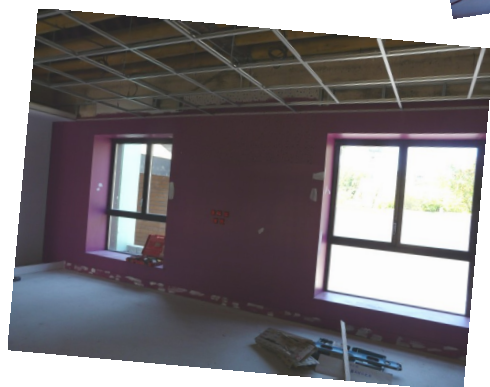
Locaux école maternelle : salle de classe + dortoir (anciennes classes)