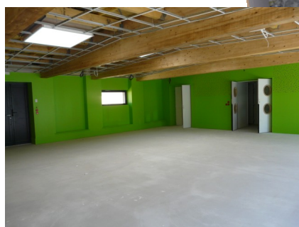
Salle de motricité (ancien préau)