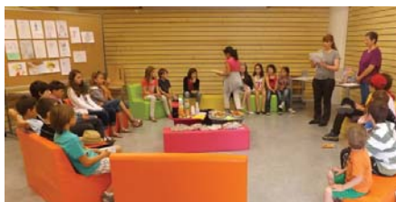
Club manga - spécial résultats de concours de dessin

La médiathèque travaille également avec les écoles dans l'objectif de faire découvrir aux enfants le plaisir de la lecture et organise de nombreuses animations à destination des jeunes mais aussi des adultes. Le programme de ces animations est disponible sur le site de la médiathèque mediatheque.viry74.fr : consultez-le et venez partager de véritables moments de bonheur !