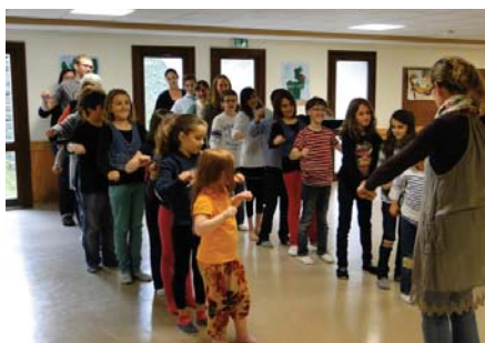
Spectacle participatif