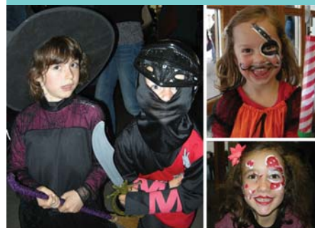
Déguisements de circonstance et séance maquillage lors du Zinzin d'Halloween !

Venez voir quelques photos sur notre site Internet ( www.apeviry74.fr ) que nous venons de relouer! Grande nouveauté, vous pouvez désormais nous laisser des commentaires, alors n'hésitez pas!