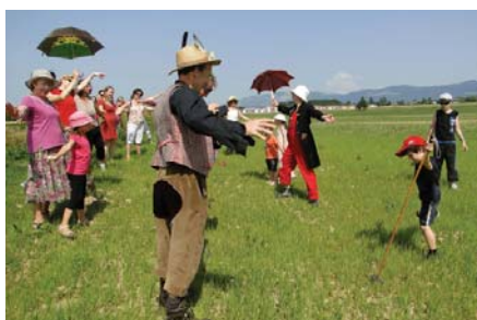
Balades au'tour des hameaux

Retrouvez toutes les infos sur : www.ladici.com/actualites