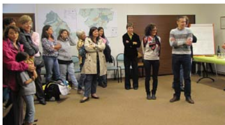
Pot de rentrée organisé le 17 septembre dernier

Bien sûr, elle est déjà loin... mais il est toujours bon de refaire le point. Au 15 octobre, la commune comptait 410 élèves. La croissance des effectifs constatée à la rentrée avait inquiété les parents, les enseignants et la municipalité qui s'étaient mobilisés. A la mi-octobre, la commune recevait une bonne nouvelle avec l'ouverture d'une classe supplémentaire, permettant d'accueillir des enfants de 3 ème année de maternelle et de CE2. Une salle était en attente de les recevoir dans l'école élémentaire.