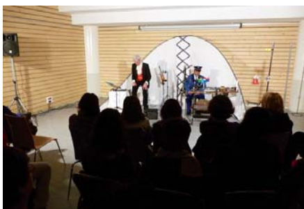
Soirée de conte pour adultes