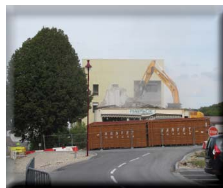
Destruction de l'ancienne pharmacie

Déménagement et installation du Tabac Presse, de la Pharmacie et de Shopi (aujourd'hui « Carrefour Contact ») dans des locaux plus spacieux, plus agréables, à l'accès sécurisé.