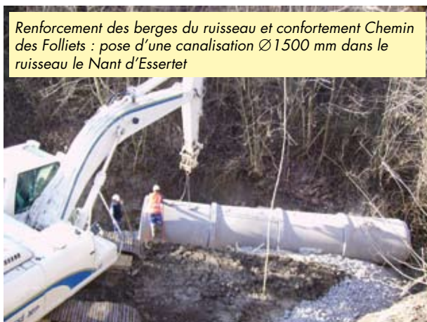
Renforcement des berges du ruisseau et confortement Chemin des Folliets : pose d'une canalisation Ø1500 mm dans le ruisseau le Nant d'Essertet