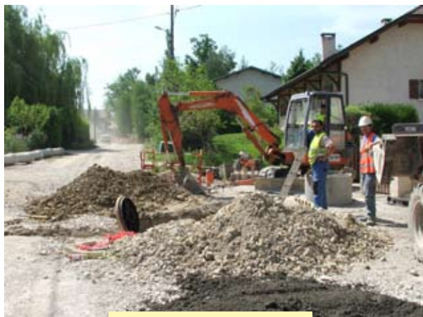
Travaux Chemin des Folliets