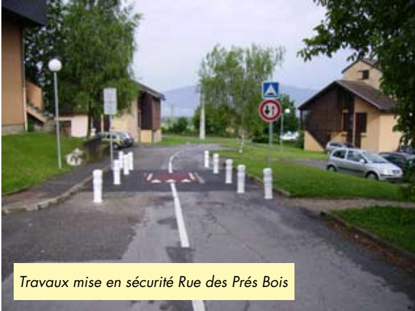
Travaux mise en sécurité Rue des Prés Bois