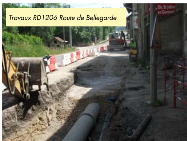
Travaux RD1206 Route de Bellegarde