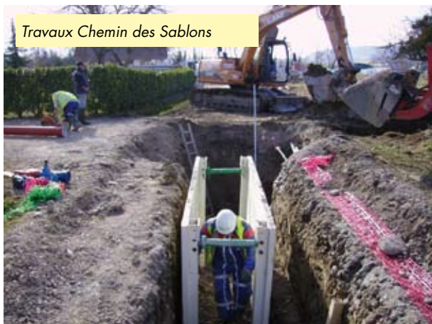
Travaux Chemin des Sablons

Les travaux sur la Route de Bellegarde (RD 1206) concernant l'eau potable, eau pluviale et eaux usées sont partiellement terminés.