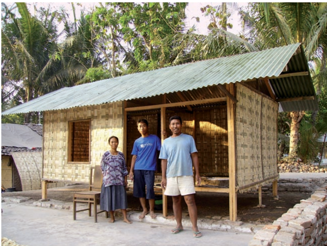
Villageois de Gadungan Kepuh, devant l'un des trente abris créés par l'association suite à la première opération qui s'est déroulée de juin à décembre 2006.

Nos plus chaleureux remerciements à tous ceux qui, de près ou de loin, ont apporté leur concours à cette fête solidaire.