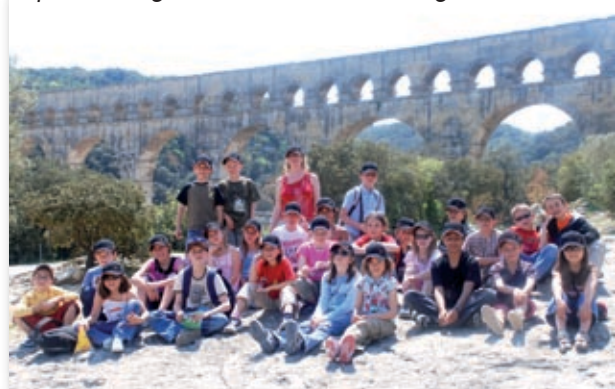
Voyage des élèves de CE2, CM1 et CM2 Ecole de Malagny

Nous avons appris que la Camargue est une « île triangulaire » artificielle située entre deux bras du Rhône : le petit et le grand Rhône. C'est la région du riz et du sel.