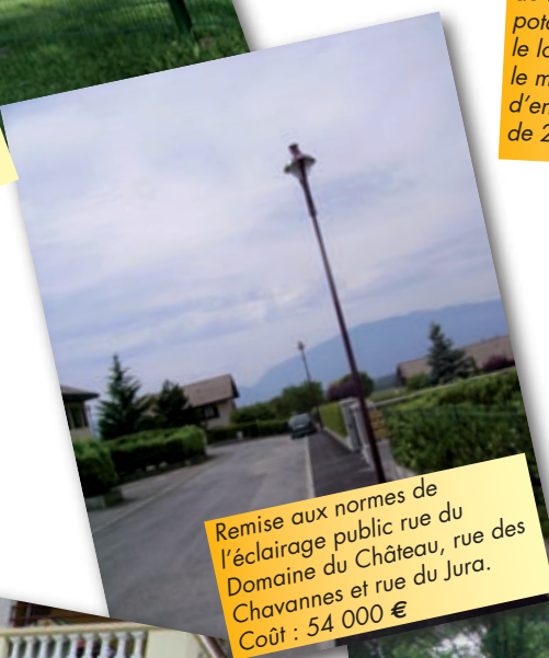
Remise aux normes de l'éclairage public rue du Domaine du Château, rue des Chavannes et rue du Jura. Coût : 54 000 €