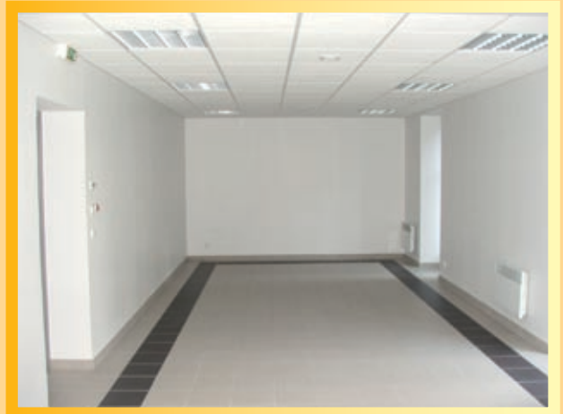
Salle de réunion rez de chaussée