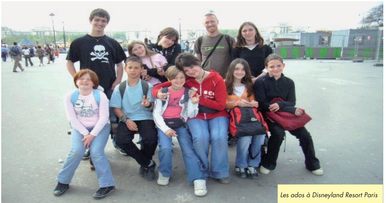
Les ados à Disneyland Resort Paris

Les activités démarreront la semaine du 10 septembre