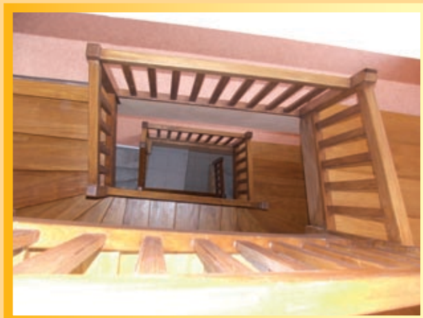
Escalier reconstruit dans sa quasi totalité