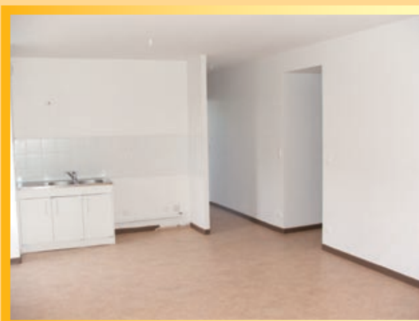
Appartement T5 au rez de jardin