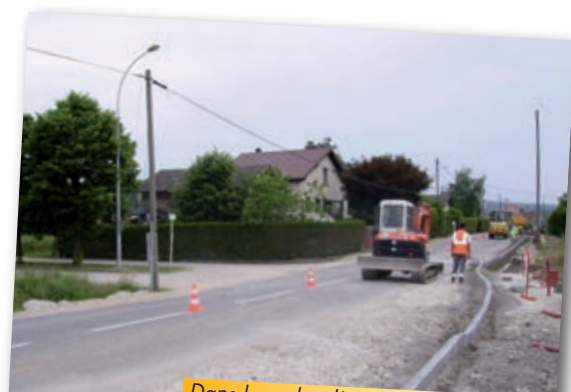
Dans le cadre d'un aménagement sécuritaire (dévoisement chaussée, plateau surélevé et arrêt de bus) et du renforcement de la colonne de distribution d'eau potable, dans le hameau de La Côte, le long de la route départementale 34, le marché a été confié au groupement d'entreprise Besson-Gerland pour un coût de 228 000 €.