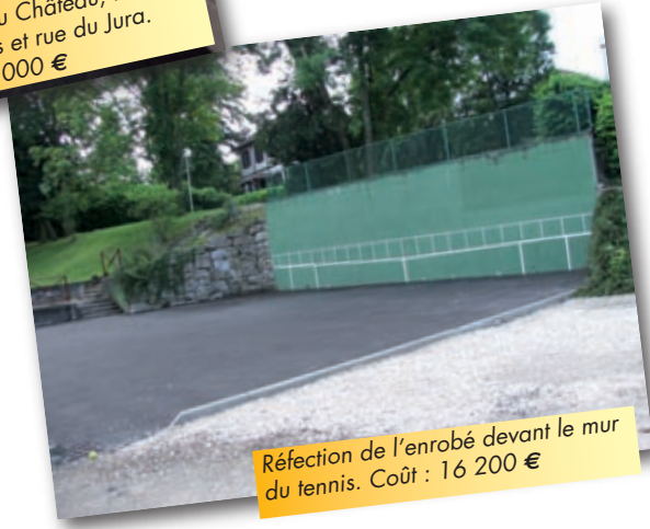
Réfection de l'enrobé devant le mur du tennis. Coût : 16 200 €