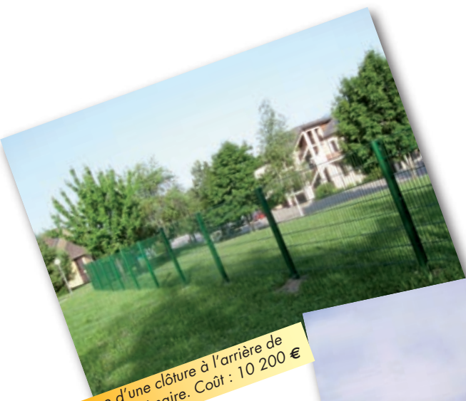
Pose d'une clôture à l'arrière de l'école primaire. Coût : 10 200 €