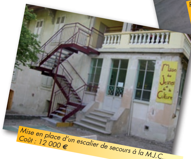
Mise en place d'un escalier de secours à la M.J.C.. Coût : 12 000 €