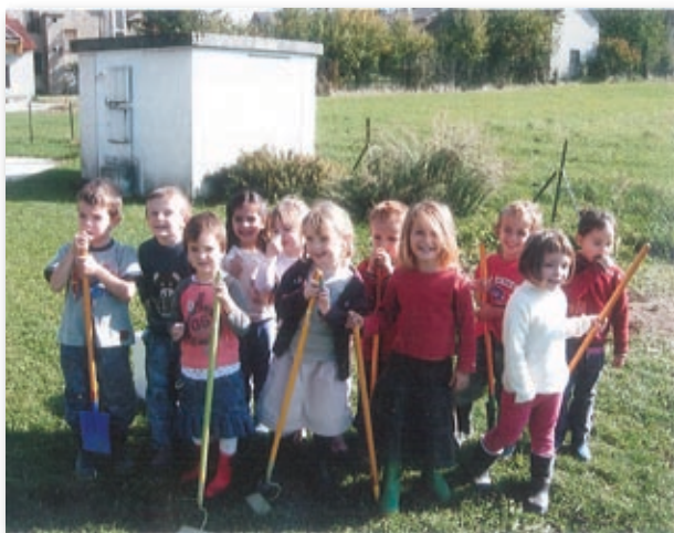
Les enfants de l'école maternelle

Maintenant rendez-vous dans quelques temps pour la cueillette et la dégustation !