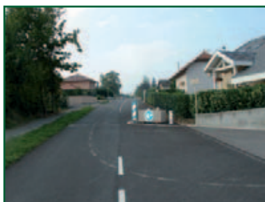
Aménagement du chemin des écoliers Le chemin des écoliers a été sécurisé par la création de chicanes nécessaires pour couper la vitesse dans cette ligne droite.