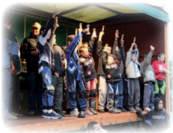
Podium des jeunes

Le dimanche, quatre-vingt pilotes se sont affrontés dans la course UFOLEP destinée aux licenciés. Avec une nouveauté cette année : une course de motos anciennes et une épreuve pour les jeunes