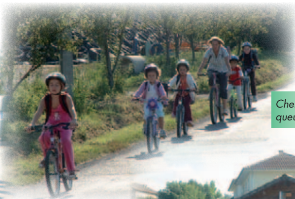
Cheminement à la queue leu leu ...