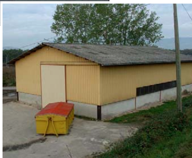
Vente de l'ancien dépôt communal à l'entreprise Savoy-Grains

La collaboration de ces deux professionnels permet à Savoy-Grains de faire bénéficier l'agriculture régionale d'un savoir faire (contrat de production, traçabilité, présence sur les marchés étrangers) et de maintenir une concurrence dynamique sur le secteur.