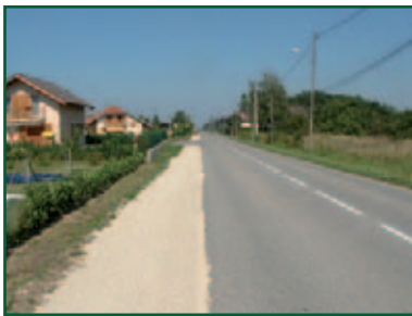
Aménagement d'un chemin piétonnier à la Côte, destiné à sécuriser les piétons, et en particulier les écoliers qui se rendent à l'abribus, dans l'attente de travaux plus importants dont la maîtrise d'œuvre est lancée.