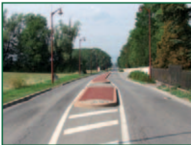
Chef-Lieu : les convois exceptionnels dégradent régulièrement les îlots

En effet, d'une part, les végétaux souffraient de la pollution et du sel de déneigement, et d'autre part l'entretien de ces espaces devenait techniquement dangereux à assumer.