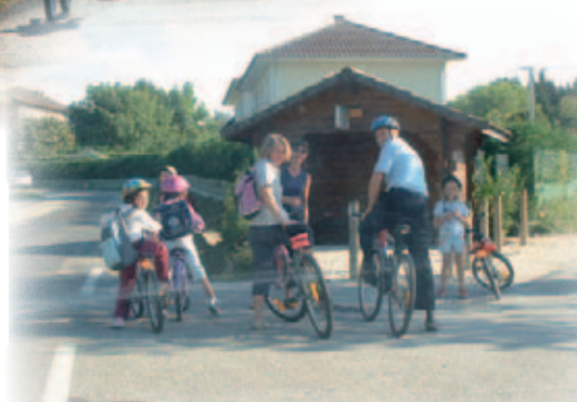
Arrivée à Veigy ..... Bon la prochaine fois «les mamans», il faudra mettre un casque !