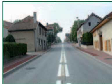
l'Eluiset : les commissions réfléchissent pour redonner l'effet de rétrécissement que donnaient les parterres