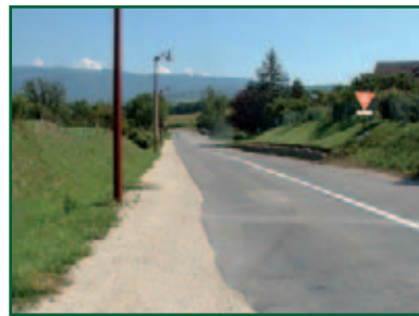
Un chemin piétonnier a également été aménagé chemin des primevères.