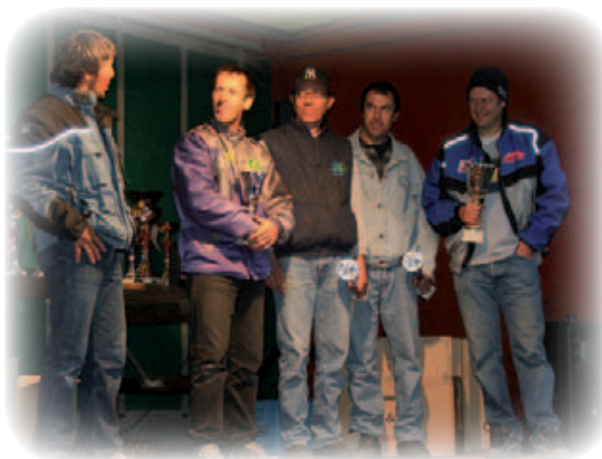
Podium motos anciennes

Cette année encore, l'ASMV, qui a atteint sa majorité (l'association a été créée en 1987), nous a proposé une manifestation de qualité, avec une organisation à la fois professionnelle et conviviale. La course sur prairie de Viry est devenue un évènement incontournable !