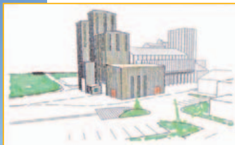
L'unité de production