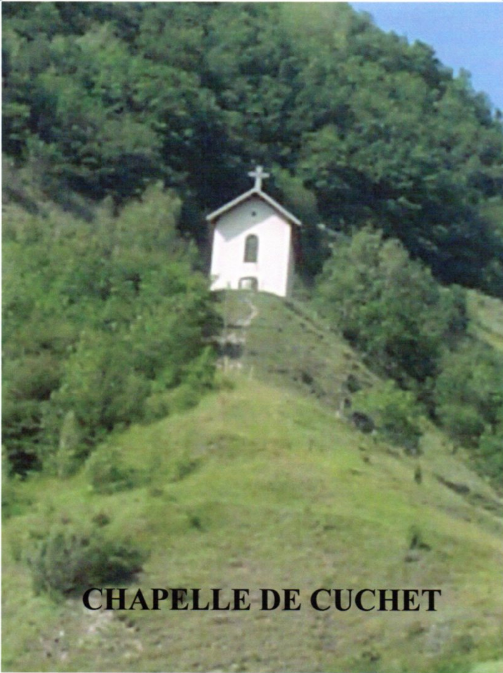
CHAPELLE DE CUCHET