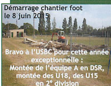
Démarrage chantier foot le 8 juin 2015

Bravo à l'USBC pour cette année exceptionnelle : Montée de l'équipe A en DSR, montée des U18, des U15 en 2 e division