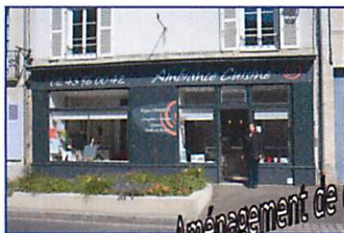
Aménagement de cuisine