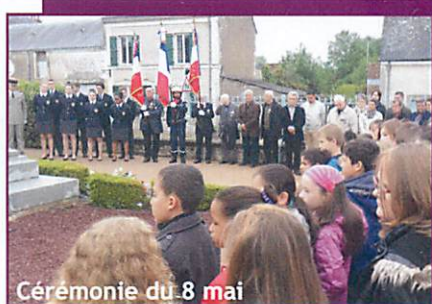
Cérémonie du 8 mai

Bravo à l'USBC pour cette année exceptionnelle : Montée de l'équipe A en DSR, montée des U18, des U15 en 2 e division