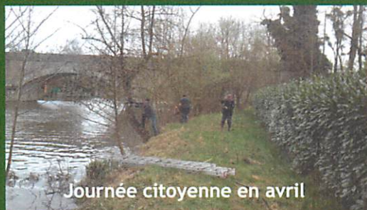
Journée citoyenne en avril