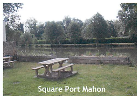
Square Port Mahon

Une aire de pique nique est agréablement aménagée au square du Port Mahon avec vue imprenable sur le Loir. Ce square sera agrémenté de végétaux dès l'automne.