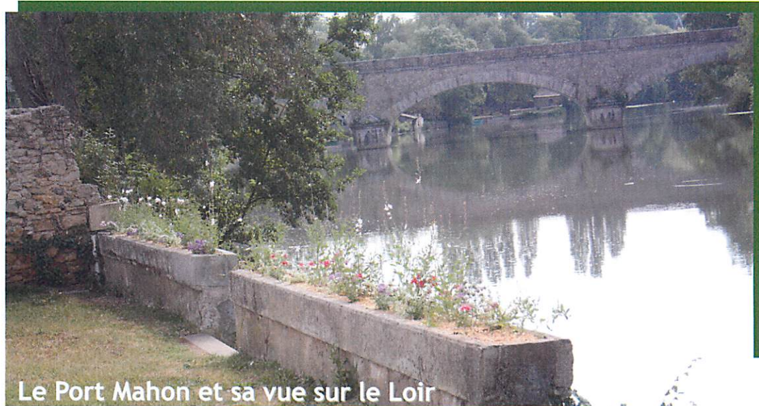
Le Port Mahon et sa vue sur le Loir