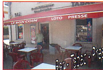
Bar - Tabac - Presse