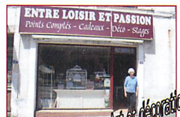
Art et décoration