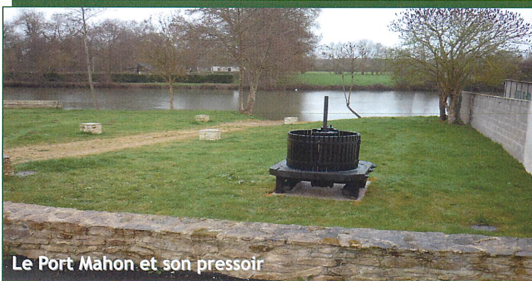
Le Port Mahon et son pressoir