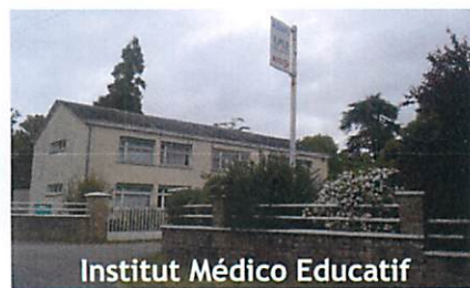
Institut Médico Educatif

L'ADAPEI de la Sarthe gère un IME situé à Bazouges sur Le Loir. Il regroupe une centaine d'élèves avec une large proportion répartie dans les classes transplantées. Les projets