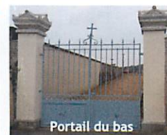
Portail du bas