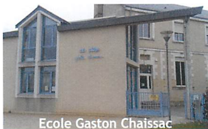
Ecole Gaston Chaissac

L'école publique, qui regroupe une centaine d'élèves, a été une des écoles pionnière dans la mise en place des rythmes scolaires. Forte de ces 2 années d'expériences, et en s'appuyant sur les recommandations issues de la semaine de l'éducation, elle sera « école test » pour l'année scolaire 2015-2016. Les modifications des horaires (8h30-12h00/14h00-16h20) et l'organisation des temps d'activités périscolaire regroupés le jeudi après midi permettent une meilleure prise en compte du rythme de l'enfant, objectif premier de la réforme. Nous