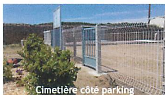
Cimetière côté parking

Les peintures des entrées du cimetière se terminent et un grillage rigide est en cours d'installation.