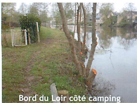
Bord du Loir côté camping

Afin de ne pas se laisser envahir par les ronces et donner un accès aux pêcheurs, les berges du bord de Loir ont été nettoyées.