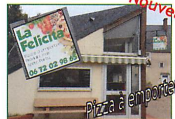
Pizza à emporter