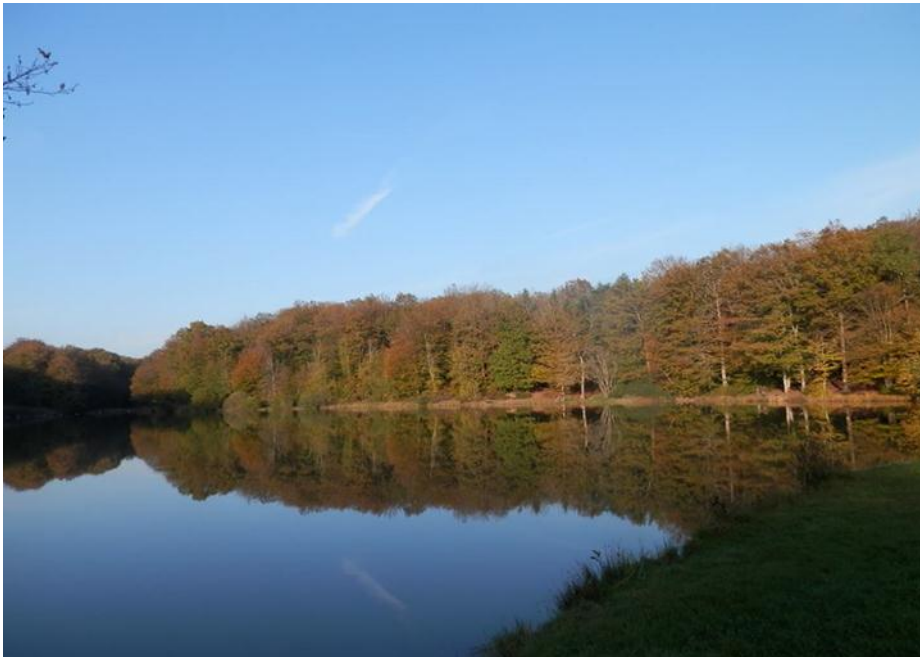
ETANG DE FROIDECONCHE