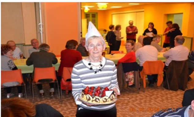
Les Lauréats de la Saint Honoré 2014 - A qui le tour en 2015?

Tous les 2 ème et 4 ème jeudis du mois à 14h à la salle des Fêtes de Vauxrenard