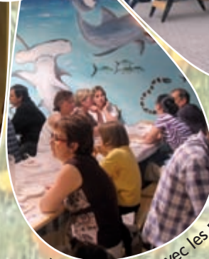
Veillée et repas avec les parents