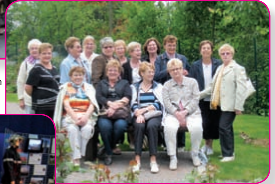
Visite Roseraie à Rosheim