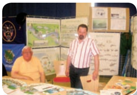
« L'A.P.P.M.M. au Forum Ville-Vie & Famille »

Une fois encore, l'année aura été marquée par de nombreuses manifestations, notamment une soirée « Harengs » qui, pour une première, a eu beaucoup de succès. Petite nouveauté également lors de notre concours inter-sociétés, où un challenge offert par la commune de Duttlenheim a été remis au vainqueur, le restaurant « Belle Vue de Duttlenheim ». On notera cependant la belle cinquième place de l'équipe de jeunes. Mais la dernière trêve hivernale a également permis de réaliser certains travaux et investissements