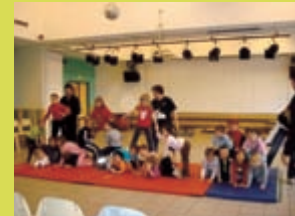
En classe de découverte