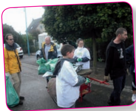
Nettoyons la nature... Le retour !