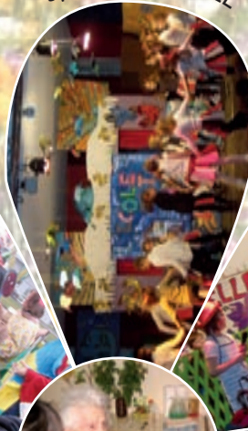
Spectacle de NOEL