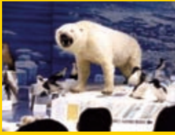
Au musée zoologique