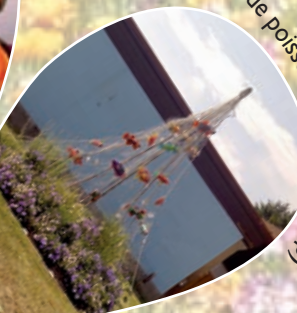
Filet de poisson (bouteilles recyclées)