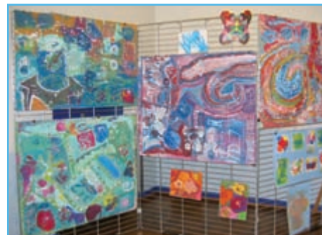
Cœuvres en expo

Les p'tits et grands « artistes » se joignent à moi pour vous souhaiter une année 2011 remplie de rires et de joies. Un grand merci à la commune pour son soutien.