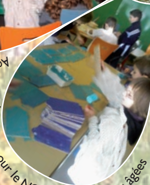
Bricolage pour le NOEL des personnes âgées