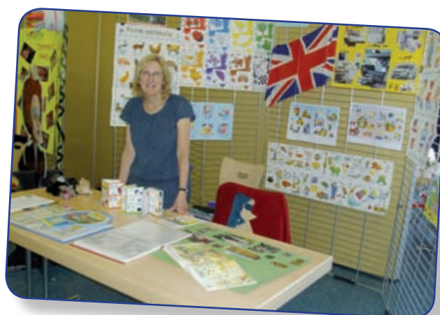
... et la Professeur au Forum Ville-Vie & Famille