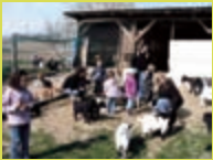
À la ferme du Bruehl