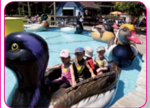
Sortie à Cigoland

Sur la même période et pour la 3ème édition, l'offre d'accueil des ados a recueilli un vif succès et sera reconduite lors des prochaines grandes vacances, sur trois ou quatre semaines, selon les résultats d'une enquête qui sera menée en mars.