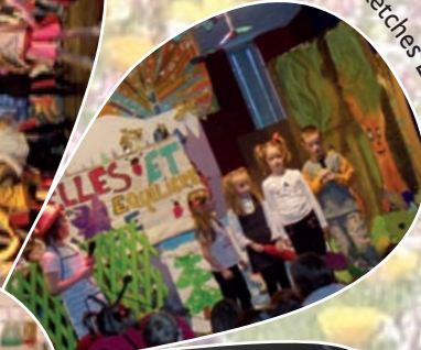
Sketches Ecolo de NOEL