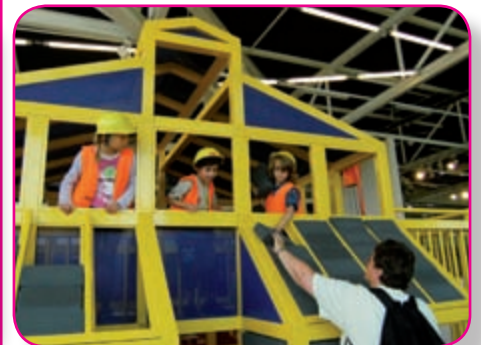
Sortie au Vaisseau

à renouveler cette nouvelle offre pour les trois premières semaines du mois de juillet 2011. De plus amples renseignements seront transmis dès mars 2011.