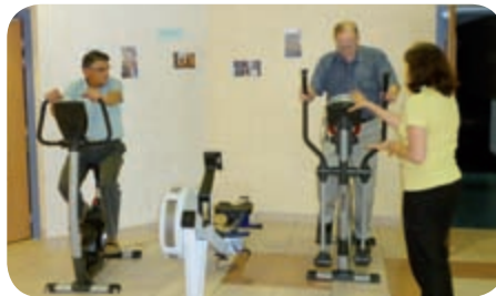
Quelques conseils avant l'effort !

En cette nouvelle année, recevez de la part de toute l'équipe ses vœux les plus toniques.