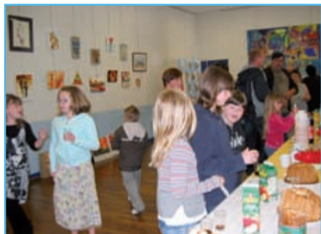
L'Expo et son vernissage