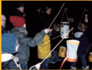
Le défilé de la Saint Martin