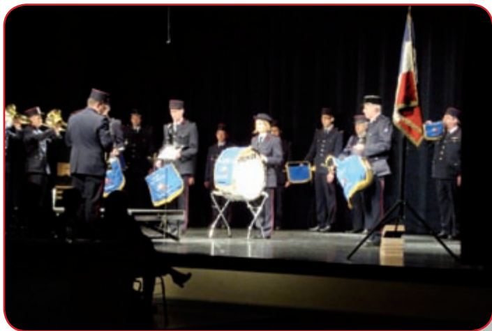
Animation de l'assemblée générale de l'arrondissement de Molsheim