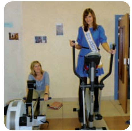
« Miss Alsace 2007 6 ème dauphine de Miss France 2008 teste nos agrès »

Que cette nouvelle année 2011 vous procure, bonheur et joie, et du succès dans vos projets.