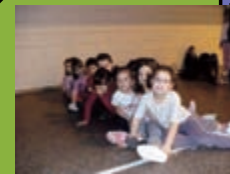
Rencontre sportive à Duppigheim