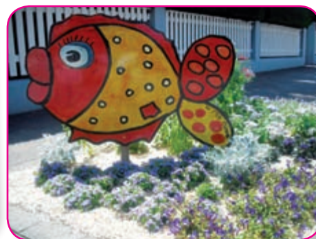
Création des P'tits Veinards

En cette fin d'année 2010 qui a vu se réaliser de grands projets, j'adresse mes remerciements à l'ensemble du personnel communal pour sa conscience professionnelle et ses attentions qui permettent de travailler pour le bien-être de tous.