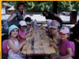
La sortie au Mundenhof