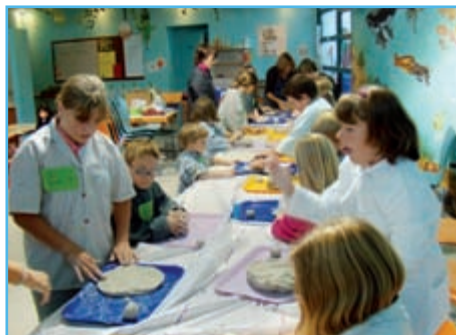
20 enfants fréquentent actuellement l'atelier