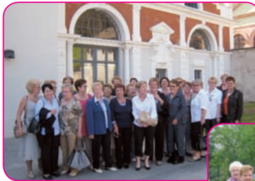
Sortie Paradis des Sources à Soultzmatt