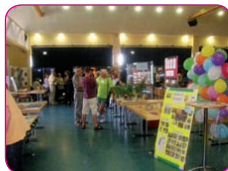
1 er Forum Ville-Vie & Famille

A vous tous, petits et grands, j'adresse mes meilleurs vœux de santé et de bonheur pour l'année 2011.