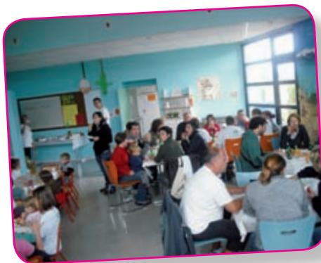
Après le travail le réconfort

qui ont plutôt leur place à la déchetterie ! Le poids de la « collecte » à