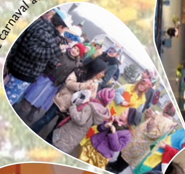
Défilé de carnaval avec l'ADAPEI