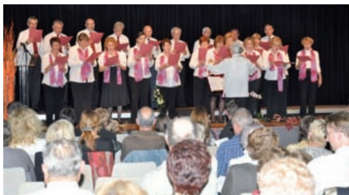
La chorale de Duttlenheim au grand complet avec celle de Dachstein lors du « Gsangféchst » en octobre dernier à Ernolsheim /Bruche.