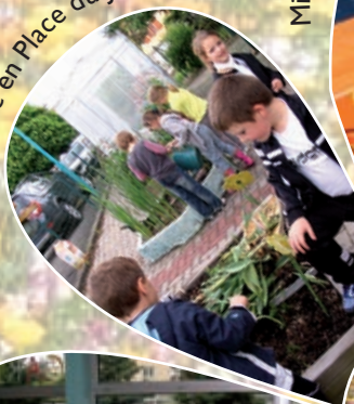
Mise en Place du Jardin