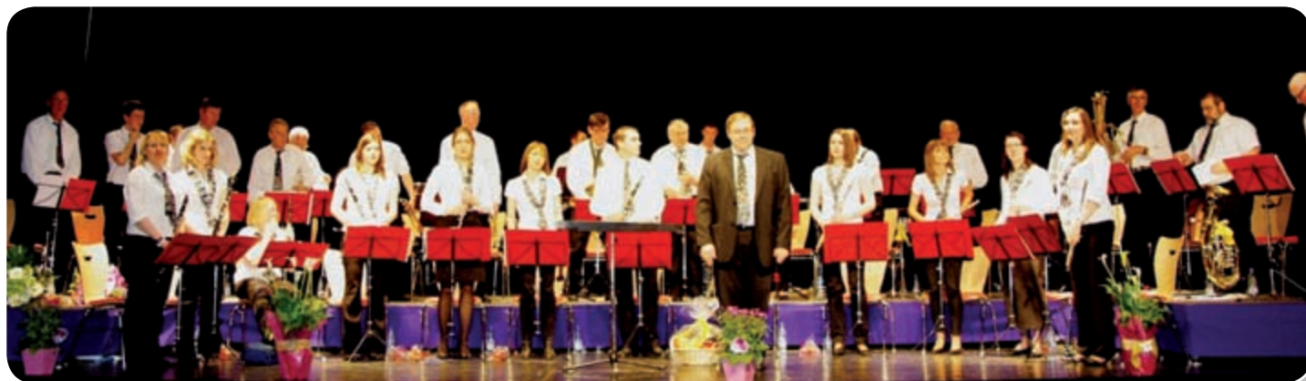
«L'Alsatia à l'unison» ...à donné son traditionnel concert annuel de printemps, toujours en couleur.