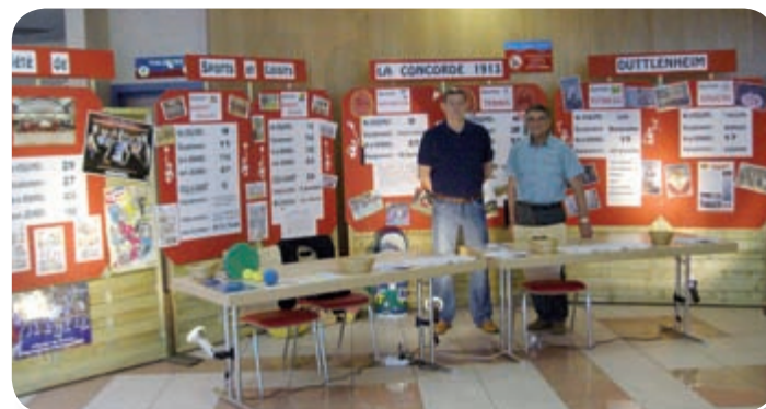
Stand de LA CONCORDE au forum 'Ville-Vie & Famille' organisé par la commune

A tous ces personnes et organismes, à l'ensemble des habitants de Duttlenheim et des villages voisins, la Société Sports et Loisirs de La Concorde 1913 et moi-même, nous vous présentons nos meilleurs vœux de santé et de prospérité pour l'année 2011.