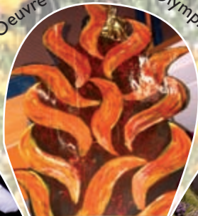
Mise en Oeuvre de la flamme Olympique