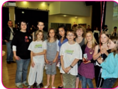
Remise du Trophée de l'engagement aux «escargots contre attaquent»

nes. Un troisième trophée fut remis au groupe « Les escargots contre-attaquent » pour leur remarquable initiative de nettoyage de rues et leur attachement au respect de la nature.