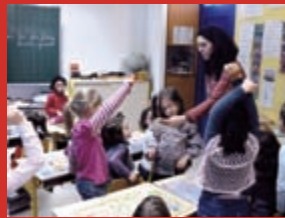
Rencontre avec les CP