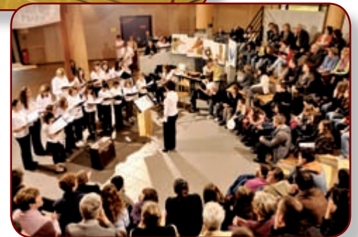
Bouge ta planète - Concert au Collège Nicolas Copernic