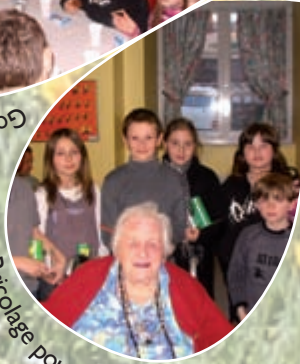
Bricolage pour les 54 résidents