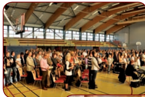
Messe de rentrée à l'espace Sportif et Socioculturel