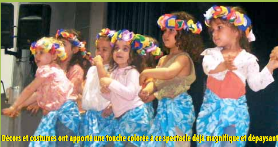
Décor et costumes ont apporté une touche colorée à ce spectacle déjà magnifique et dépaysant.