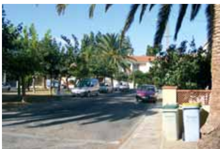
Cité du Canigou

Enfin, la commune prévoit, courant novembre, de faire l'acquisition d'une balayeuse aspiratrice électrique qui permettra à Pollestres, tout en continuant sa collaboration avec la balayeuse du SIVOM, d'éviter le recours systématique au balayage manuel.