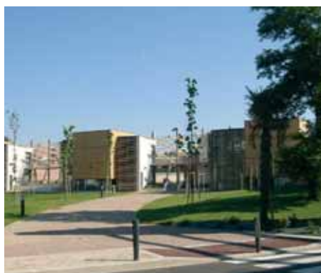
Rambla des associations