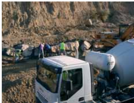
Mise en sécurité de la falaise de la Cantarana