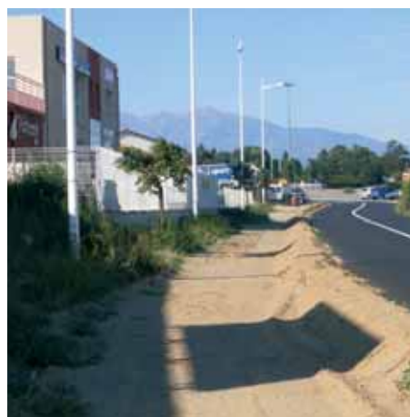
Aménagement aux abords de la zone La Devesa.

Un dossier particulièrement complexe est actuellement à l'étude en collaboration avec les services de la Communauté d'Agglomération Perpignan Méditerranée. Il concerne la création d'un passage piétonnier qui ouvrirait un chemin matérialisé sur le Départementale 900 et permettrait ainsi d'atteindre dans de meilleures conditions la Zone d'Activités La Devesa.