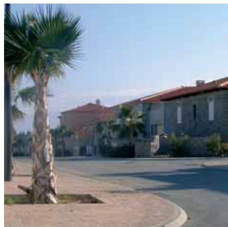
ZAC du Pou del Gel.

Pour mener à bien ces différentes missions et permettre un service chaque jour plus qualitatif, quelques achats ont été décidés.