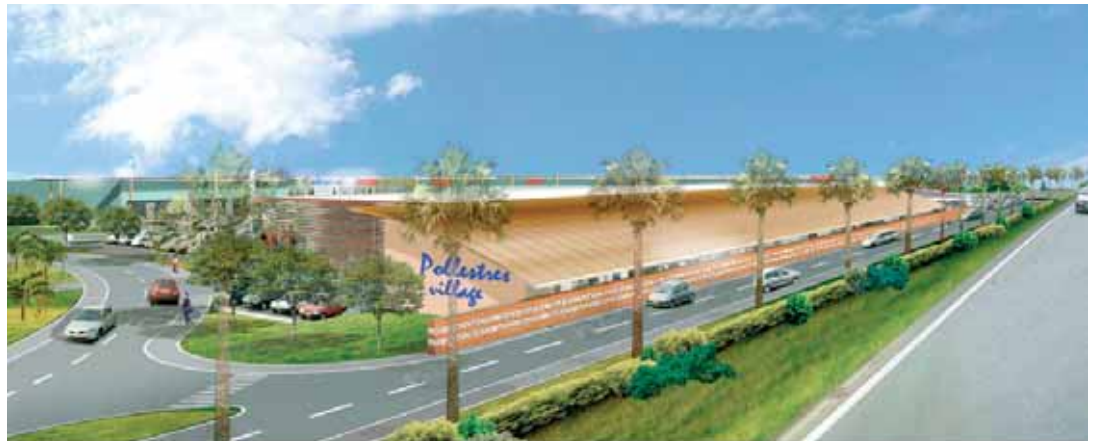
Vue depuis la RD 900 en venant de Perpignan