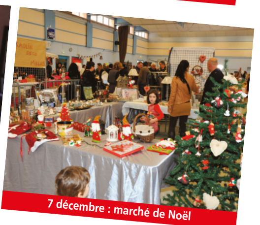
7 décembre : marché de Noël