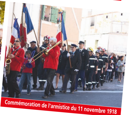
Commémoration de l'armistice du 11 novembre 1918