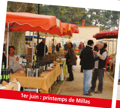
1er juin : printemps de Millas