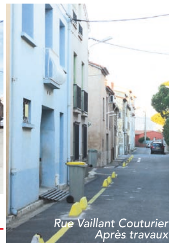
Rue Vaillant Couturier Après travaux