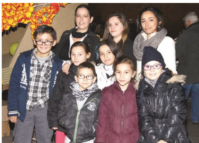
Mill'as en herbe au pied du Castillet