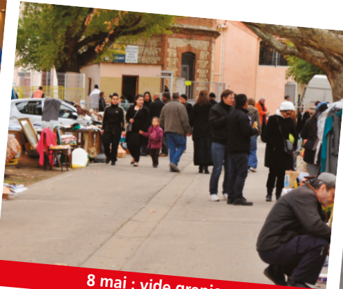
8 mai : vide greniers