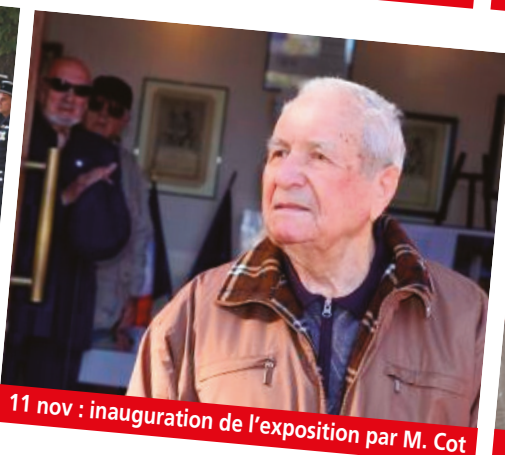
11 nov : inauguration de l'exposition par M. Cot