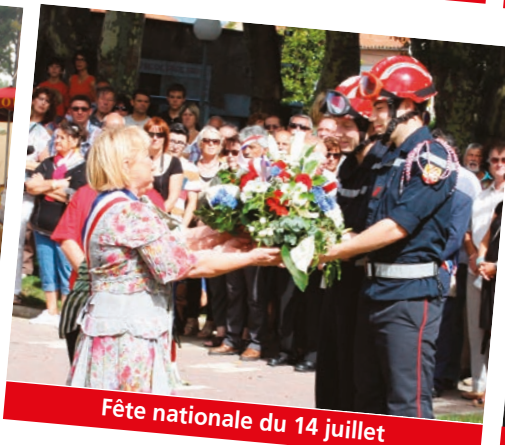
Fête nationale du 14 juillet