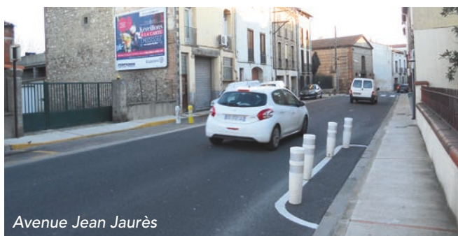
Avenue Jean Jaurès

Nous vous remercions de veiller à respecter ce nouveau mode de fonctionnement pour le bien-être de tous.