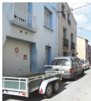
Rue Vaillant Couturier Avant travaux