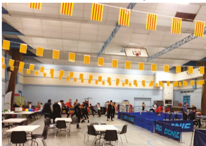
Halle aux Sports le jour du Téléthon