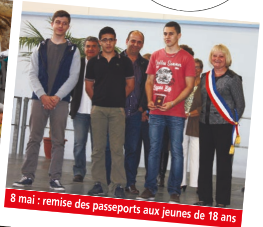
8 mai : remise des passeports aux jeunes de 18 ans