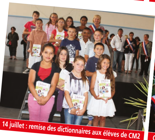
14 juillet : remise des dictionnaires aux élèves de CM2