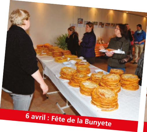
6 avril : Fête de la Bunyete