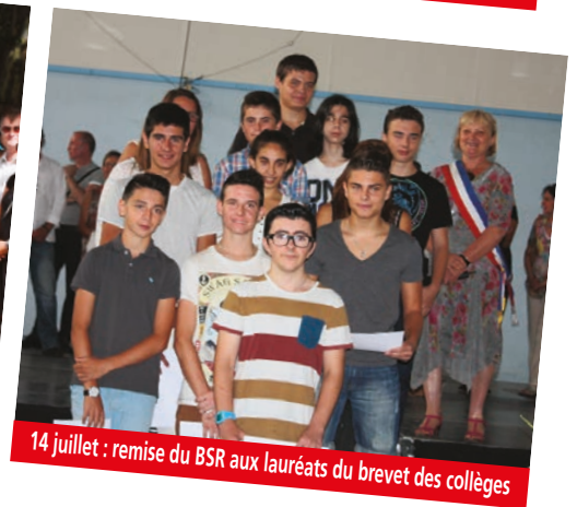
14 juillet : remise du BSR aux lauréats du brevet des collèges