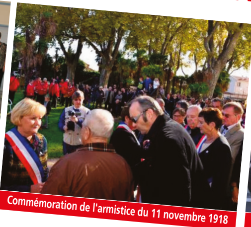
Commémoration de l'armistice du 11 novembre 1918