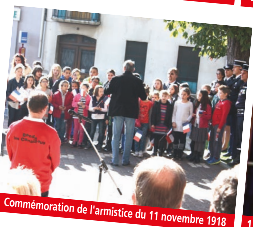
Commémoration de l'armistice du 11 novembre 1918