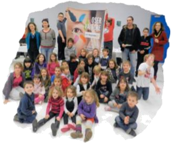
Les enfants de l'école d'uzos au goûter du téléthon organisé par les parents d'élèves