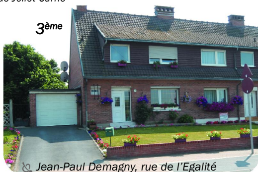
Jean-Paul Demagny, rue de l'Egalité