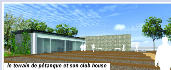
le terrain de pétanque et son club house

Création d'un boulo-drome avec club house et d'une "plaine de jeux" intégrée à un espace paysager,