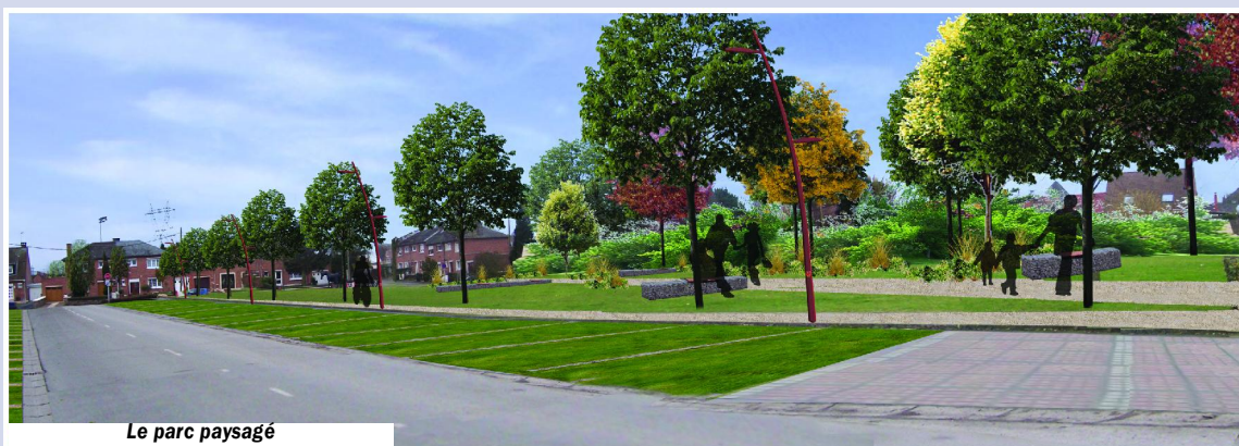
Le parc paysagé

Elle avait été menée dès 2001 par un cabinet spécialisé avec comme axes forts la définition et la structuration de l'armature urbaine, commerciale, écologique et du développement durable pour les quinze années à venir avec en toile de fond, la finalisation du PLU.