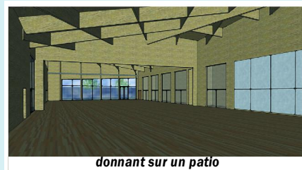
donnant sur un patio

Les majorettes hordinoises pourront y effectuer leurs répétitions avec leurs propres locaux et vestiaires.