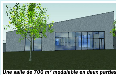
Une salle de 700 m 2 modulable en deux parties

Les majorettes hordinoises pourront y effectuer leurs répétitions avec leurs propres locaux et vestiaires.