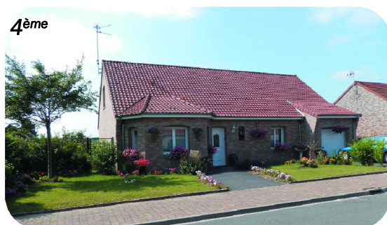
Yannick Tison, Sentier de Bouchain