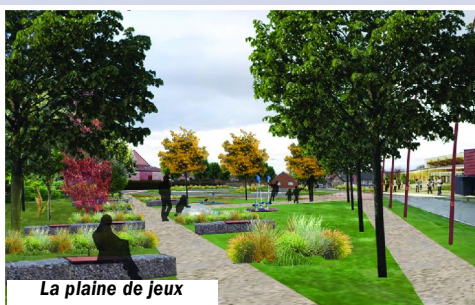
La plaine de jeux

Toujours innover et aller de l'avant sans rien sacrifier de ce qui fait la douceur et la qualité du cadre de vie"