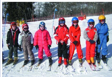
Vacances à la neige en février 2013

Les associations , elles aussi sont à remercier et féliciter pour leur implication dans la vie culturelle, caritative, sportive de la commune.