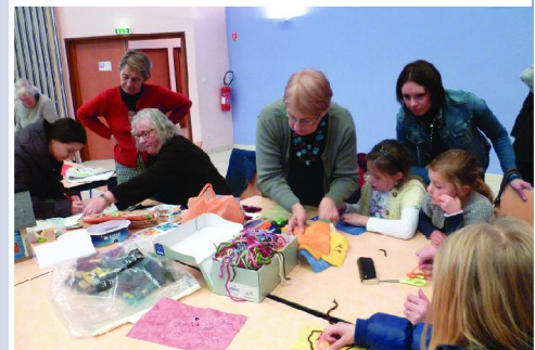
Elles cousent pour le Téléthon

Nos anciens ne sont pas oubliés et nombreux sont ceux qui participent au voyage et au repas qui leur sont offerts