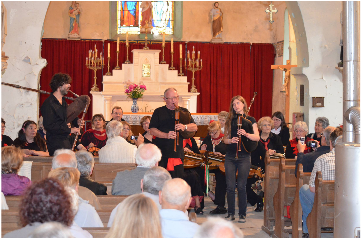
Concert de Vieille en l'église St Léger, le 30 mai 2015