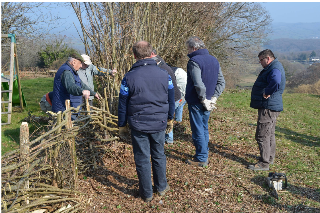
Refaire les haies .... à l'ancienne, les plécheurs sont à l'ouvrage