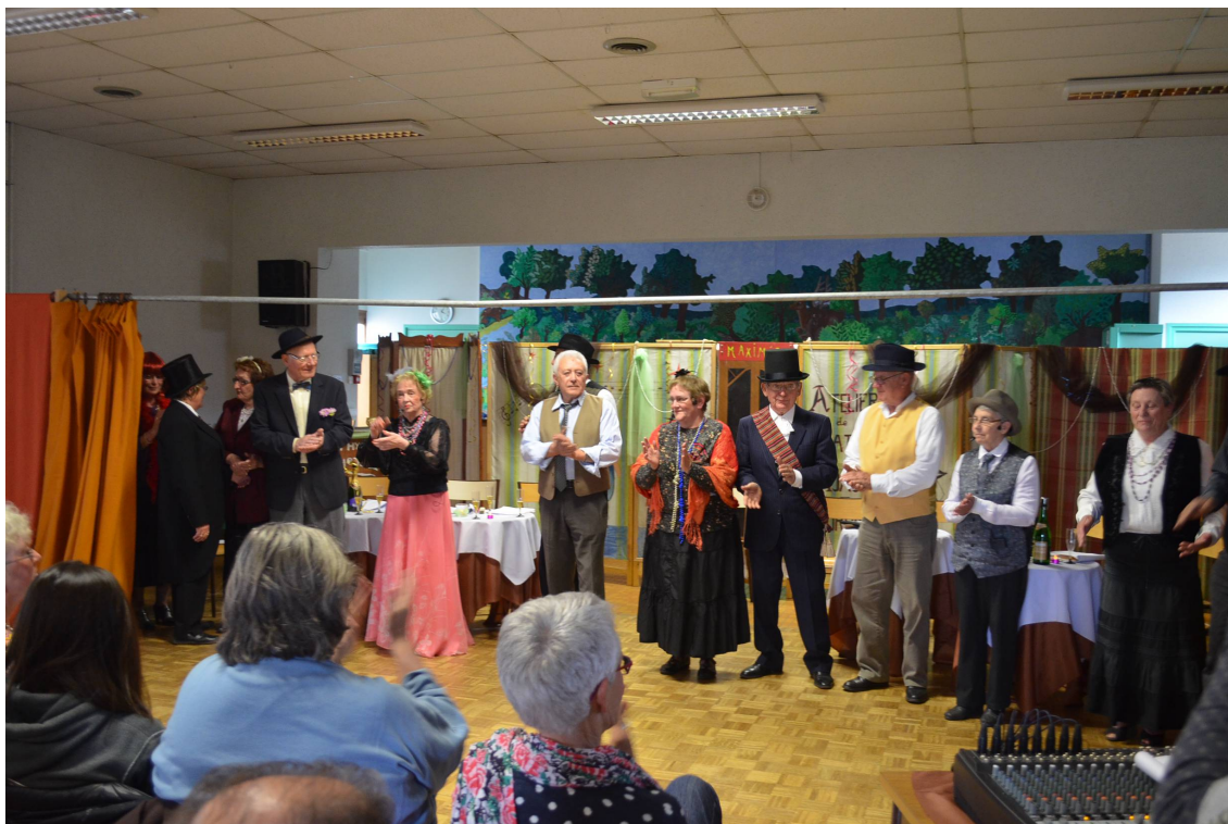
Pièce de théâtre : La Veuve Joyeuse, le 25 avril 2015