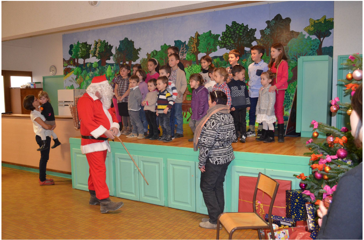
Noël des enfants du R.P.I. le 12 décembre 2015