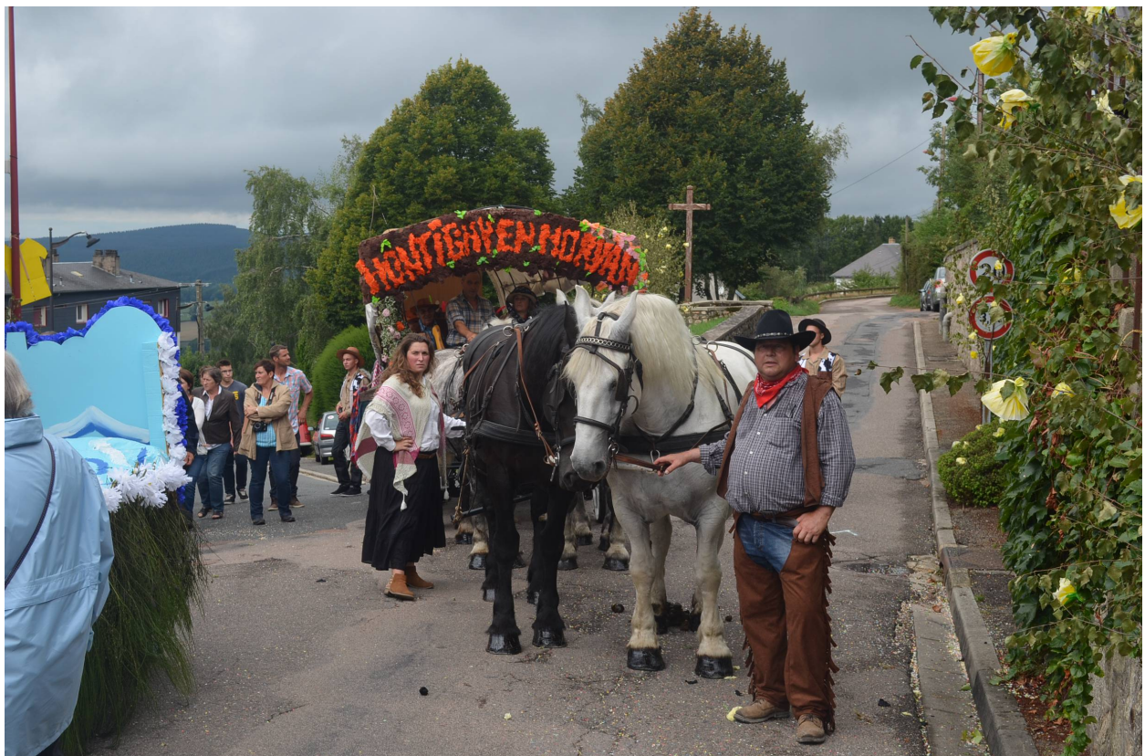
Comice Agricole du 23 août 2015 à Château-Chinon