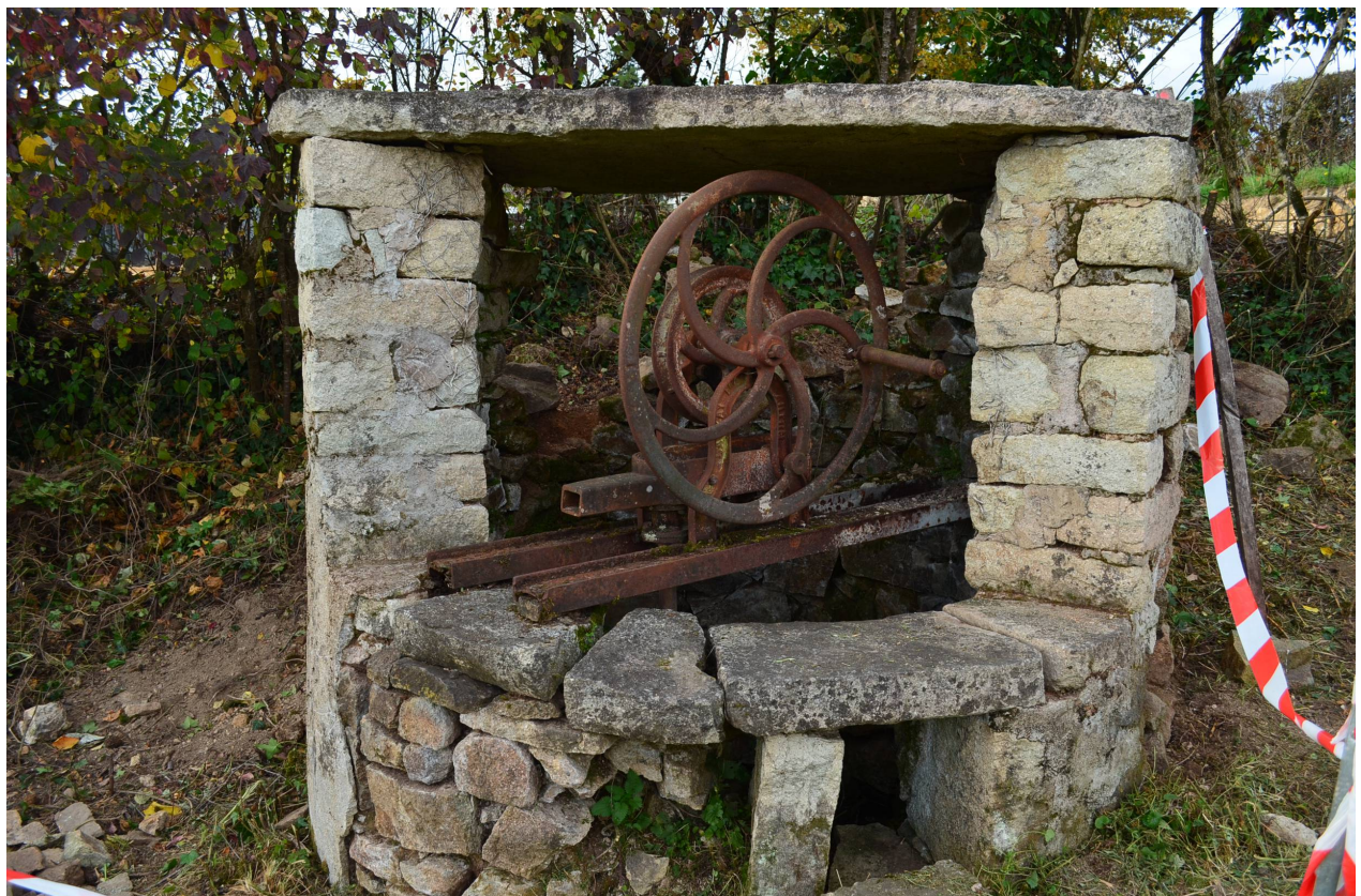
La restauration du puits de la place de Chassy en décembre 2015