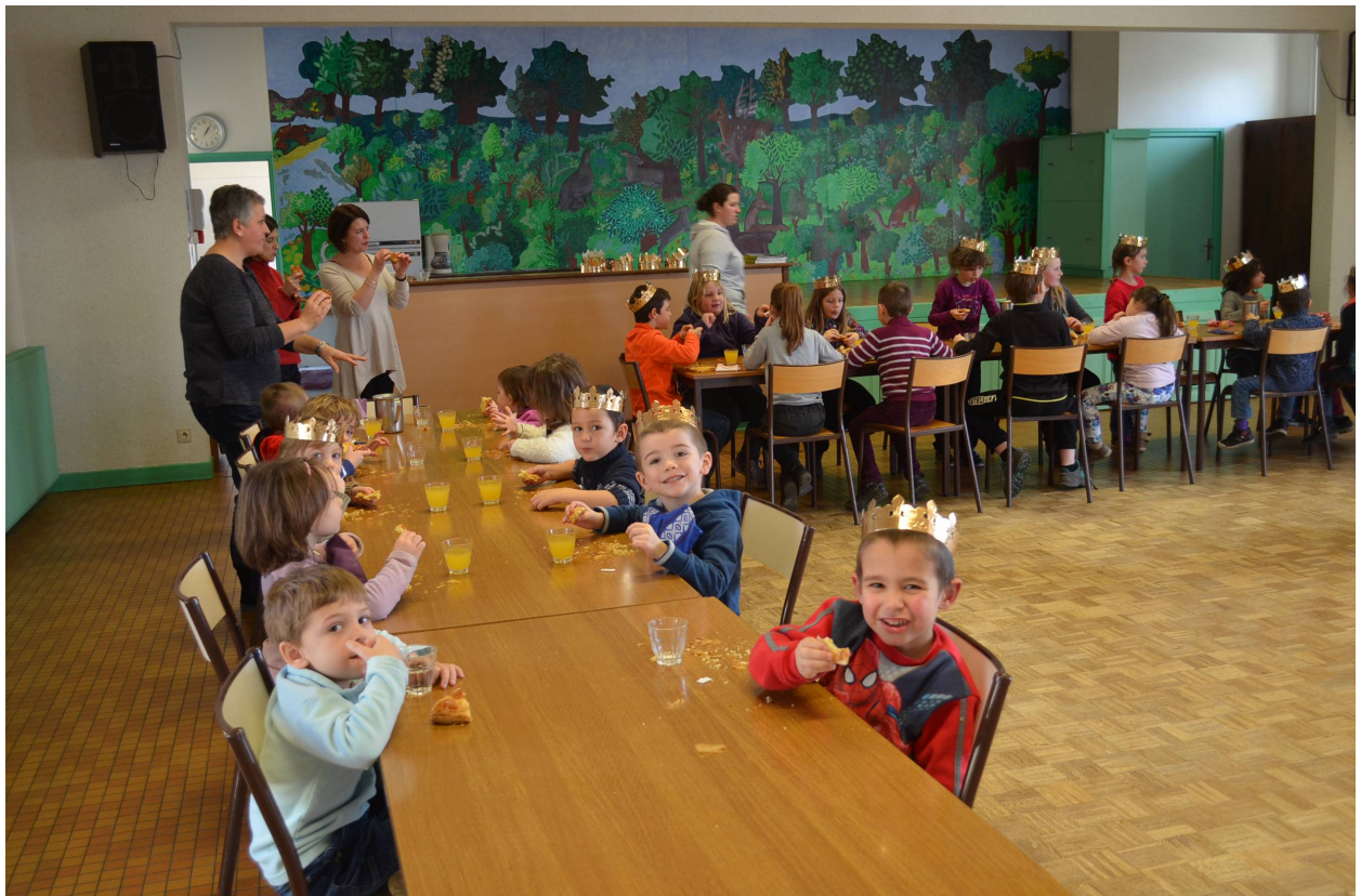
La galette des reines et rois offerte par le Maire et les Adjoints