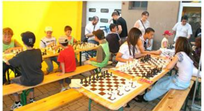
Les échecs, sport cérébral par excellence, ont attiré nombre de jeunes moyeuviens.

Les sites de Froidcul, Tréhémont, parc de la vieille mine ont été fréquentés en moyenne par 50 jeunes sportifs bien encadrés par les éducateurs et les bénévoles des associations : CMSEA (atelier djembé et coordination), Club canin, Cercle d'échecs, Centre social et culturel R. Banas, ULM Football, Tennis Club, Judo, US Froidcul, Handball, Club de Gymnastique, Karaté, Les archers du Conroy et le Boxing club de Joeuf.