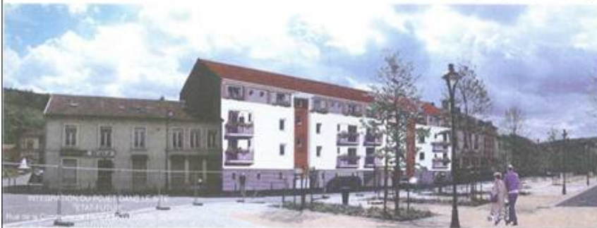
INTEGRATION DU PROJET DANS LE SITE "ETAT-FUTUR" 06 rue de la Commune de Paris à MOYEUVE-GRANDE

C'est Moselis qui a répondu favorablement et a ainsi procédé à la démolition du vaste bâtiment désaffecté qui jouxte la pla-