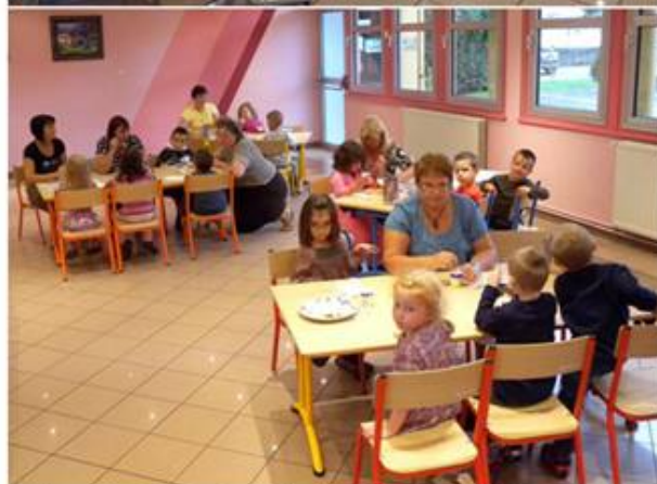
3 septembre - Jour de la rentrée scolaire pour les primaires et maternelles et 1er jour de restauration scolaire à la salle Ambroise Croizat.