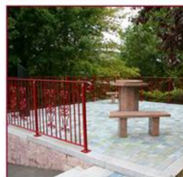
Les rampes ont été réalisées par les services municipaux.

L'ensemble des travaux, réalisés par la société Grani- mond, a coûté 9.485,13 €.