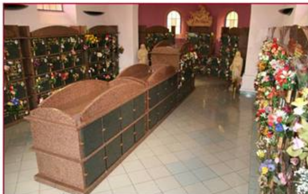
L'aménagement du columbarium et la réalisation des 220 cases aura coûté au total 111.698,16€.

Le montant total des travaux depuis 1992 s'élève à 111.698,16€.