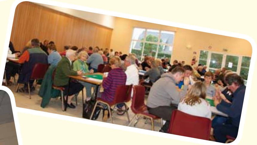
Concours de belote