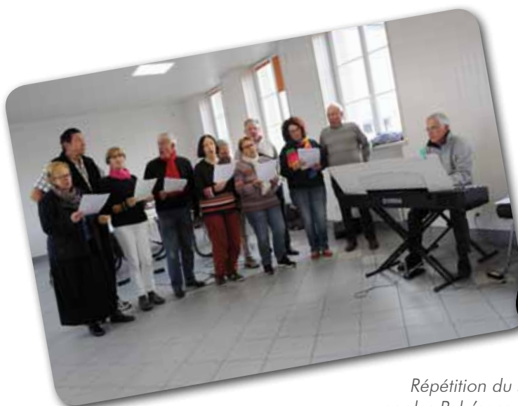
Répétition du spectacle cabaret par les Poly'sons de Rhuy et spectacle