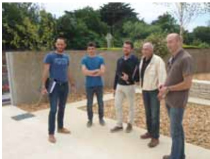
Réception des travaux d'extension du cimetière de la rue Pierre Mesmer.