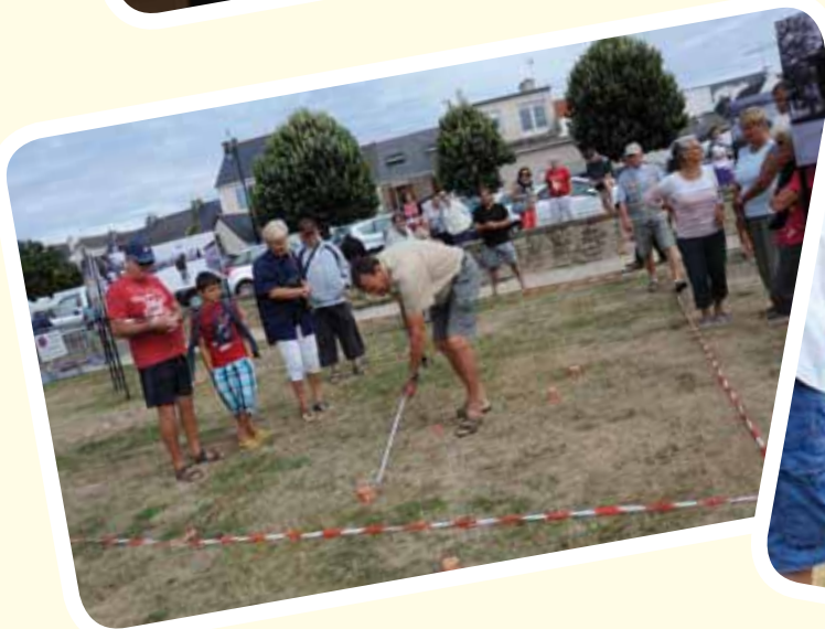
Concours de boules carrées