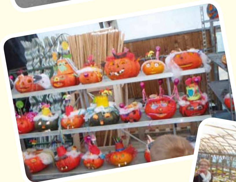
Quelques unes des nombreuses citrouilles décorées par les enfants lors de l'animation proposée et organisée par les Serres du Golfe. Cette année, ce sont près de 140 enfants qui ont participé.