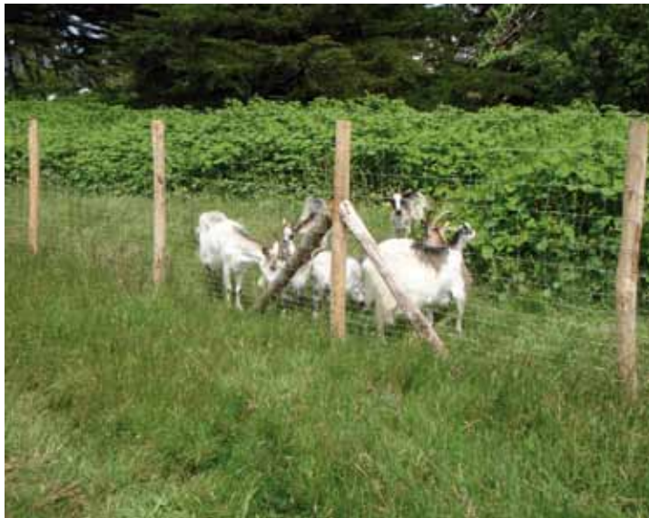
Le début de l'écopâturage au mois de mai. Les chèvres n'ont plus qu'à se régaler...