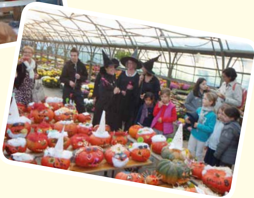
Le jury a eu bien du mal à classer les 25 premiers candidats du concours de citrouilles.