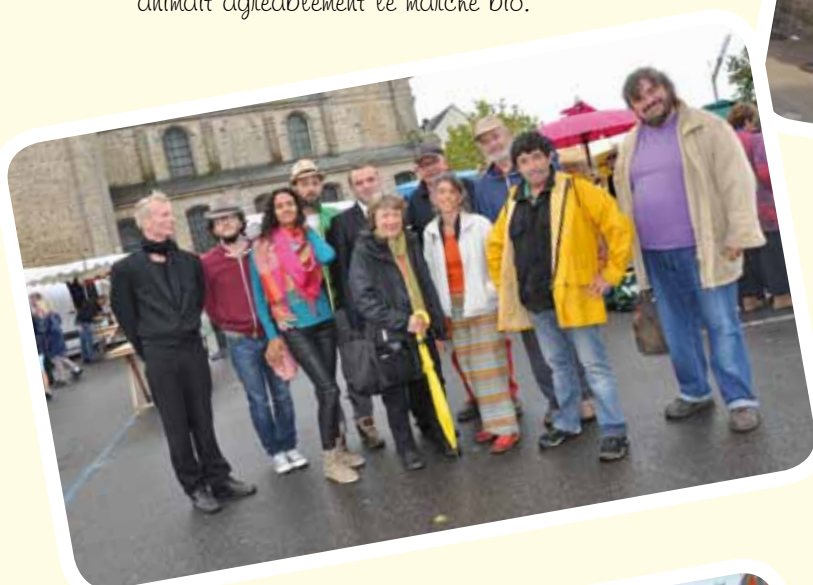
Toute l'équipe du marché bio

Dès le 1 er juillet et comme tous les mercredis, le marché bio, organisé par l'association « grain de sable », a rencontré un franc succès auprès des gildasiens et des estivants. Entre 17 et 21 h, les visiteurs ont pu choisir de nombreux produits réalisés par nos entreprises locales. De la musique avec apéro concert animait agréablement le marché bio.