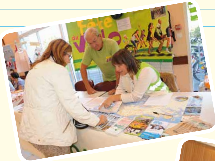
Forum des Associations Bicyrhuys, association de cyclotourisme