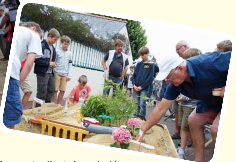
Concours de billes du Comité des Fêtes