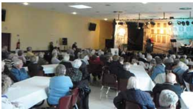
Le thème des chansons de variété, choisi pour la semaine bleue à St Gildas avait attiré de nombreux spectateurs