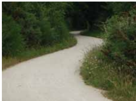
Piste cyclable entre le bourg et le Net, dit aussi chemin des étangs.