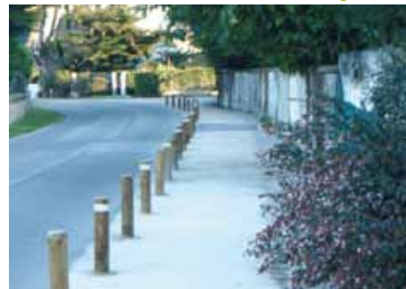
Requalification du cheminement piéton entre le parking de la salle Kercaradec et le centre bourg : largeur du chemin, qualité du sol, aspect sécurité ont été particulièrement soignés