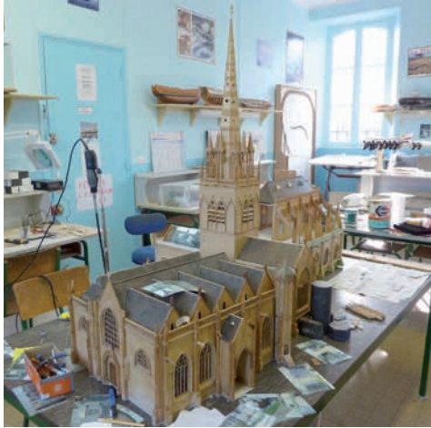
Reprise de la maquette de l'église de Carentan

Après avoir réalisé la maquette du hangar à dirigeables d'Ecausseville, le sous-marin Fulton et l'église de Carentan qui est visible dans le hall d'entrée de la mairie, nous sommes en train de