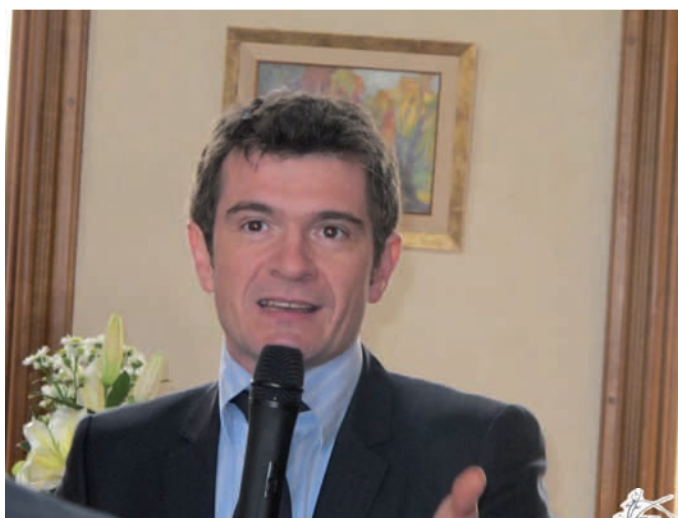
Le Ministre délégué au logement à Carentan 9