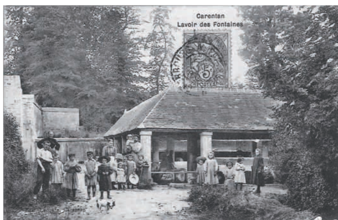
L'histoire du Vieux Lavoir des Fontaines 9