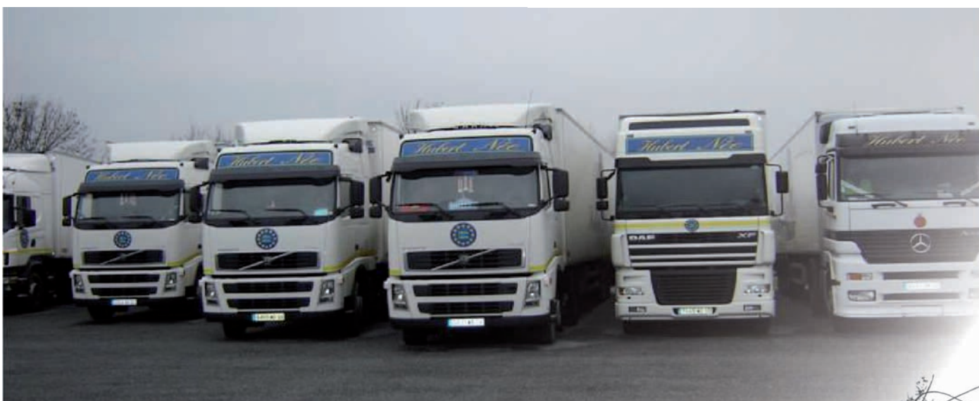
10 camions frigorifiques aux couleurs de l'entreprise sillonnent les routes de la Basse-Normandie et de la Bretagne