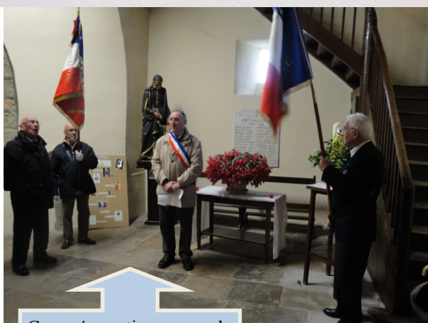
Commémoration du 5/12/2012 en l'église St Pierre d'Orthevielle