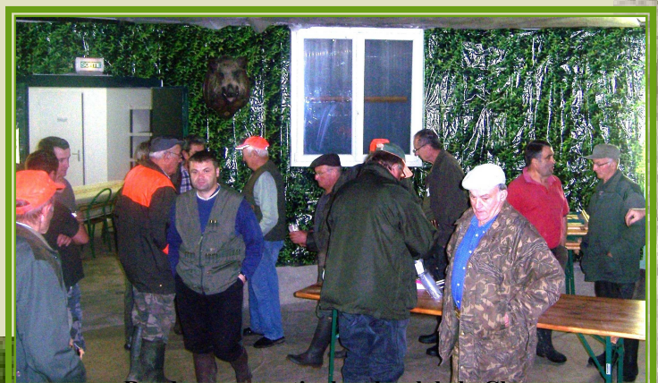
Rendez-vous matinal au local de la Chasse