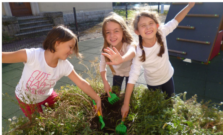
Les enfants en action sur l'atelier jardinage

« Après un lancement difficile aussi bien pour les parents qui ont dû revoir leur organisation au quotidien que pour l'équipe d'animation qui s'est adaptée à de nouvelles contraintes de fonctionnement, on peut dire que ça y est, tout le monde a pris ses marques »