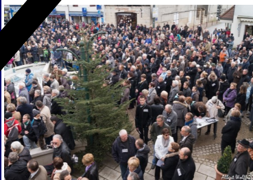
Mobilisation sur la place de la mairie le dimanche 11 au matin