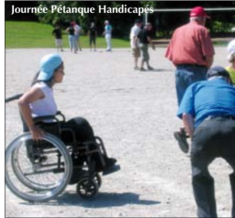
Journée Pétanque Handicapés