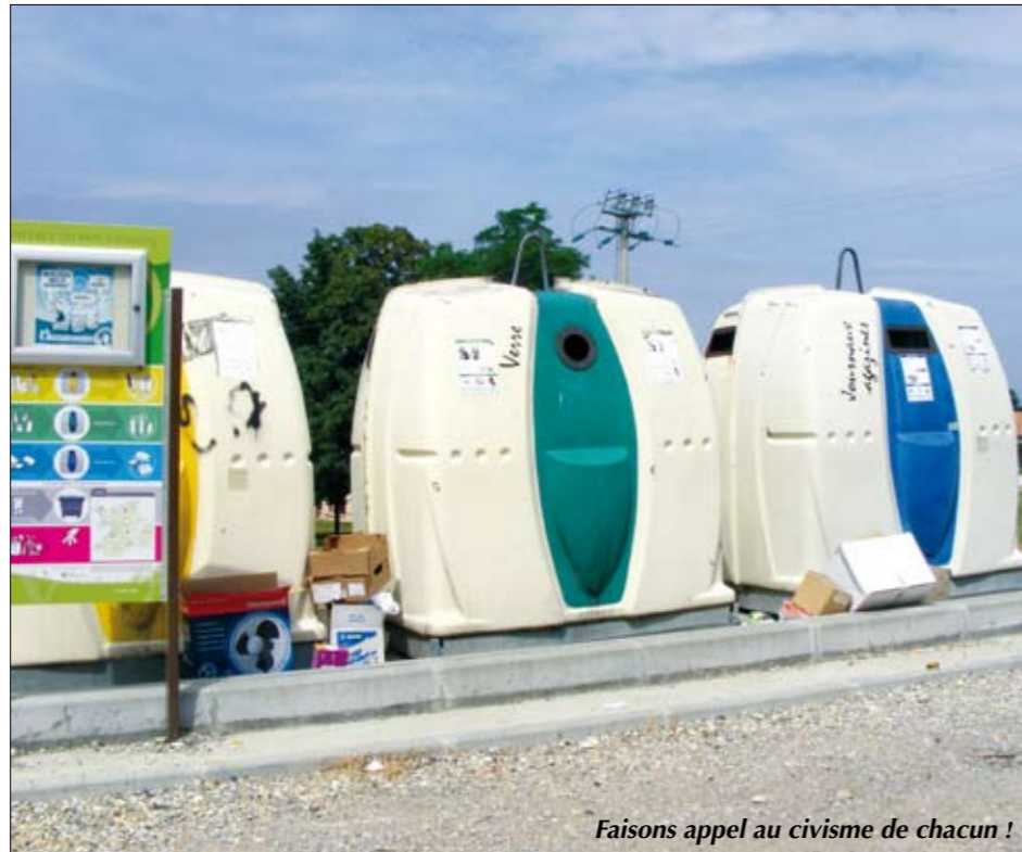
Faisons appel au civisme de chacun !

pour éviter les dépôts sauvages sur la commune et sur les emplacements de tri !