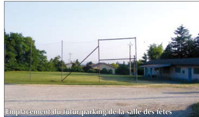
Emplacement du futur parking de la salle des fêtes

Dès septembre, les travaux des aménagements extérieurs avec un parking d'environ 85 places et un accès piétonnier vers le parking des écoles vont débuter. Ceux des voiries environnantes et la poursuite des travaux d'enfouissement des réseaux suivront.