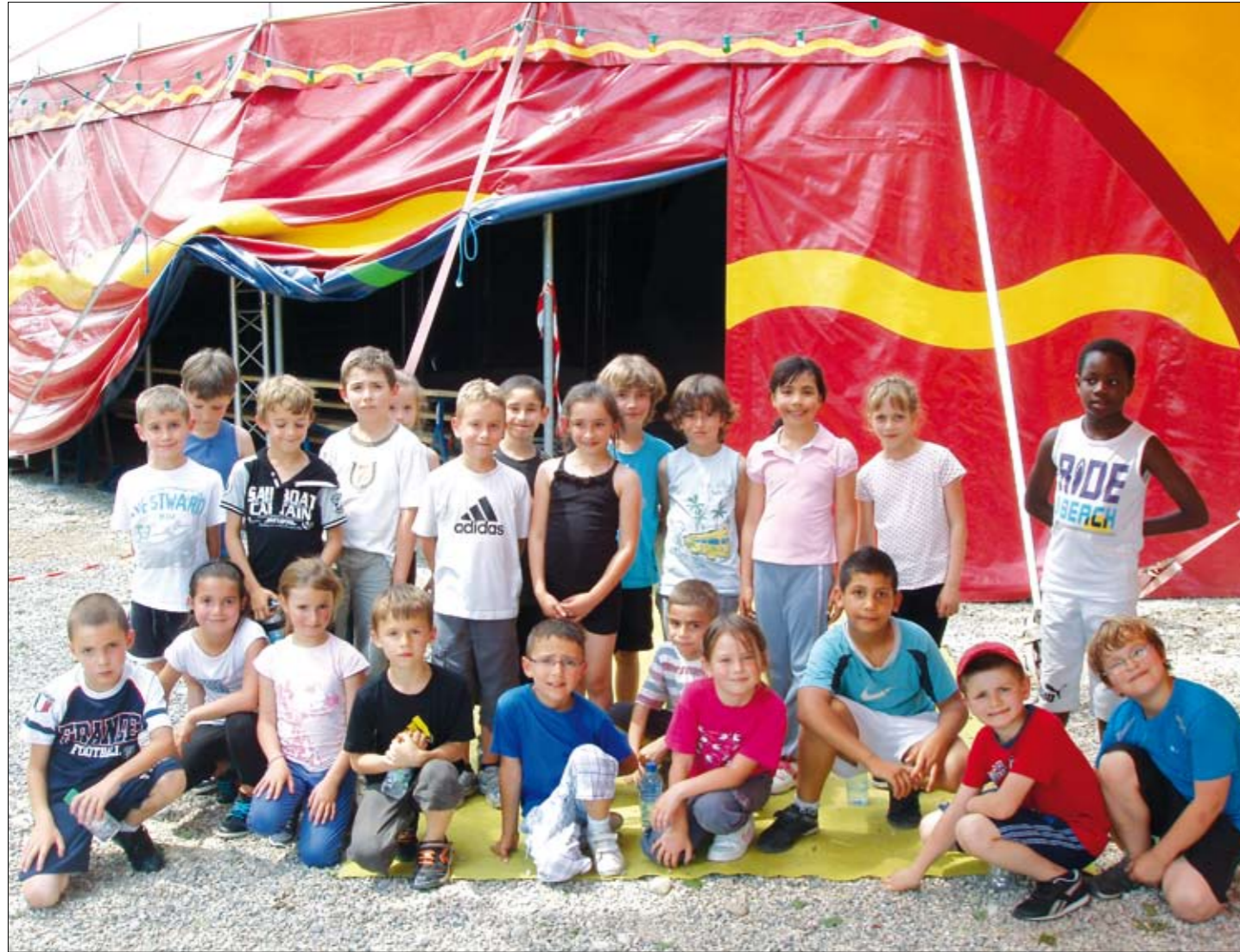
La classe CE1 - CE2 au cirque

L'année scolaire 2012/2013 s'est achevée et l'école élémentaire comptait 144 élèves répartis sur 6 classes, dans un cadre de travail très favorable. Les salles de classes sont spacieuses, bien équipées : trois viennent d'être entièrement rénovées du sol au plafond, une autre a reçu un mobilier tout neuf. Nous disposons également d'une grande salle bibliothèque/informatique, équipée de 12 postes reliés en réseau.