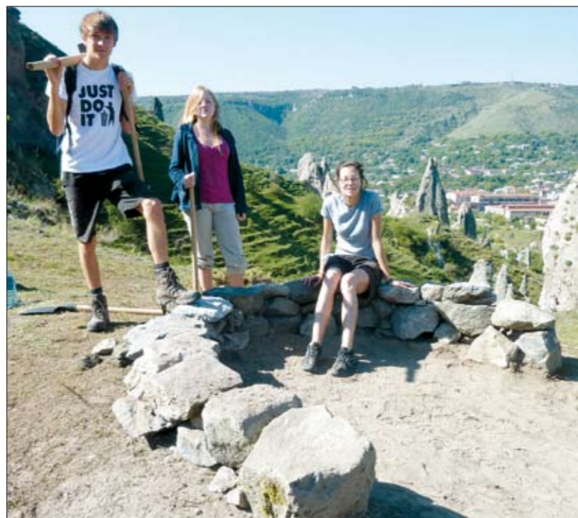
Chantier de coopération internationale avec la ville de Goris - Arménie