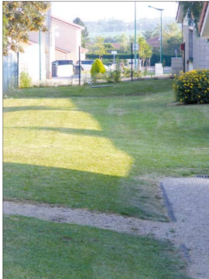
Futur accès piétonnier entre la salle des fêtes et le parking des écoles

Dès septembre, les travaux des aménagements extérieurs avec un parking d'environ 85 places et un accès piétonnier vers le parking des écoles vont débuter. Ceux des voiries environnantes et la poursuite des travaux d'enfouissement des réseaux suivront.