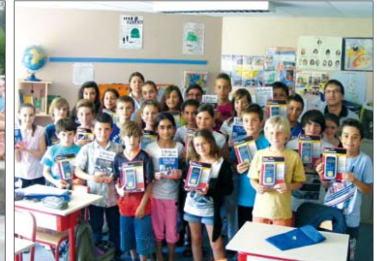
Remise d'un cadeau aux CM2 avant leur départ en 6ème

Ecole élémentaire 105, rue des écoles 38 200 Seyssuel Tél : 04 74 85 77 87 E Mail : ce.0382459S@ac-grenoble.fr