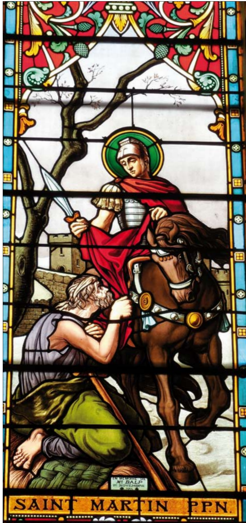
Vitrail de l'église Saint Martin de Chasse

Solidarité : Myriam Colcombet Chasse sur Rhône - 04 78 73 58 93