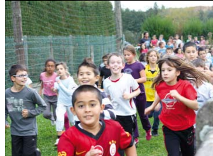
Tous les élèves de l'école au Courseton en octobre 2012

une plasticienne). Tous les CM2 nous ont quittés pour poursuivre leur scolarité au collège. Monsieur le Maire est venu les féliciter et offrir à chacun un cadeau (une calculatrice scientifique ou un dictionnaire).