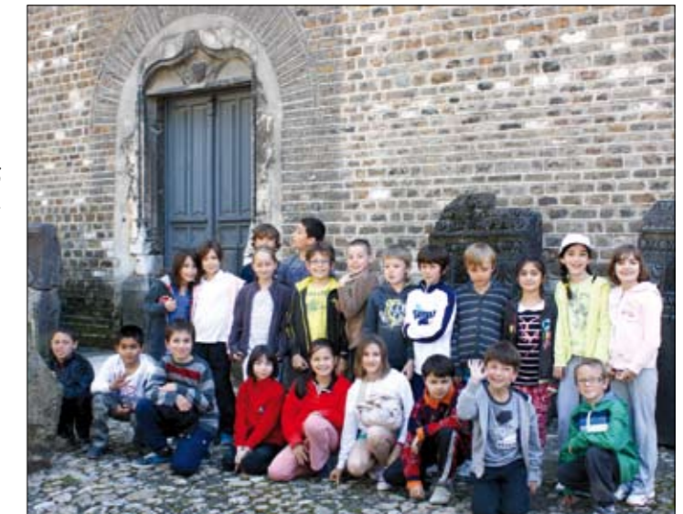
Les CE2 au musée Saint Pierre de Vienne