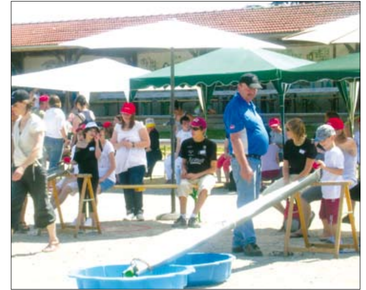
Journée Pétanque Handicapés

• Assemblée Générale le vendredi 10 Janvier 2014 à 18h30 à la Salle de la Paroisse.