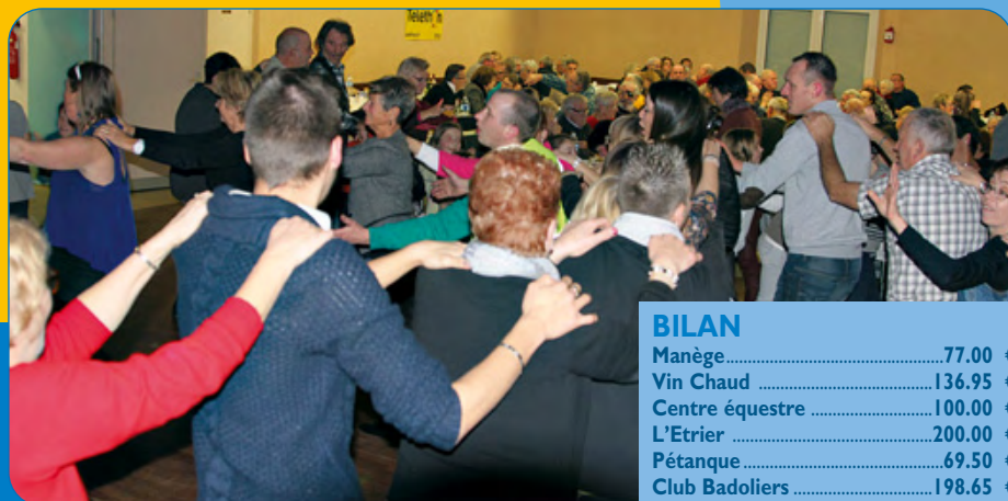
Le repas du Téléthon