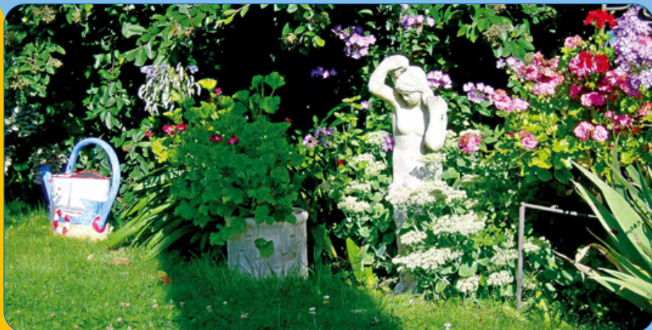
Pour le concours des maisons fleuries, la remise des prix avait lieu le samedi 11 octobre 2014