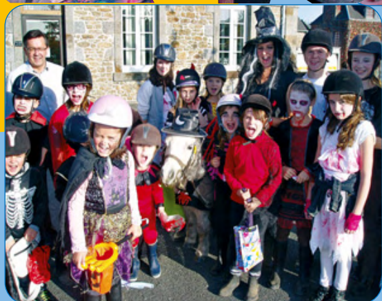
À l'occasion d'Halloween les enfants de la commune, déguisés et grimés, se préparaient pour un défilé haut en couleurs.