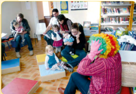
Animation « la magie du cirque »

L'équipe de la bibliothèque est aussi à votre disposition au téléphone au : 02 99 48 66 23 ou par courriel à : bibliotheque.plerguer@orange.fr