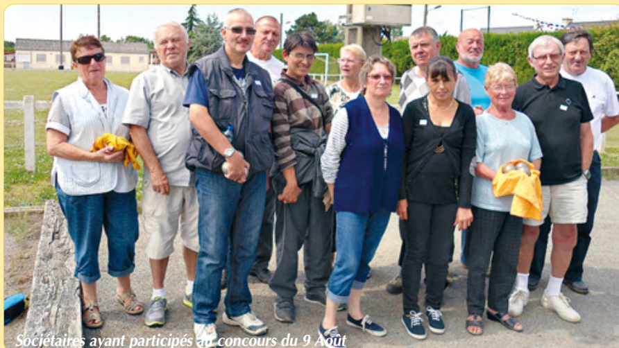
Sociétaires ayant participé au concours du 9 Août