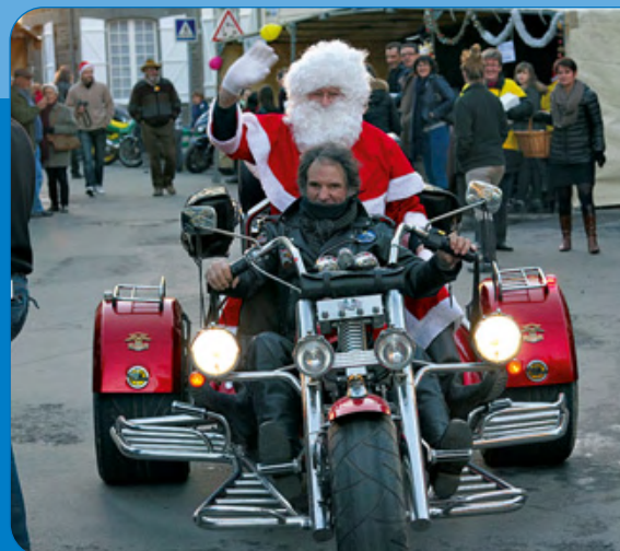
L'arrivée du père Noël en moto