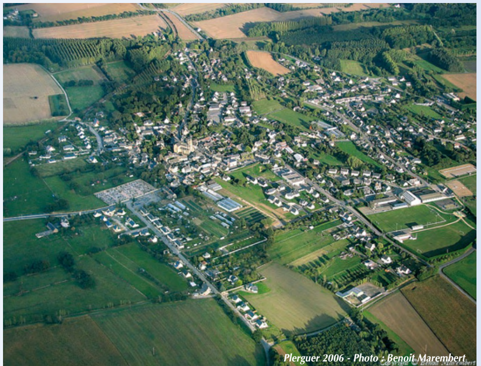
Plerguer 2006

Ainsi ce Contrat d'Objectif Développement Durable sera l'outil stratégique pour la mise en œuvre de projets dans plusieurs domaines : la gestion du foncier et la production de logements dans le cadre d'une approche durable de l'espace, la création de schémas de déplacements et de circulations, l'aménagement du centre bourg, le rééquilibrage des équipements face à nos besoins, la définition de nos espaces publics et de notre cadre de vie, le renforcement du dynamisme et de l'identité de notre commune... A différentes étapes de l'étude, les habitants et tous les acteurs de notre territoire y seront associés dans le cadre d'une démarche que nous souhaitons fortement participative.