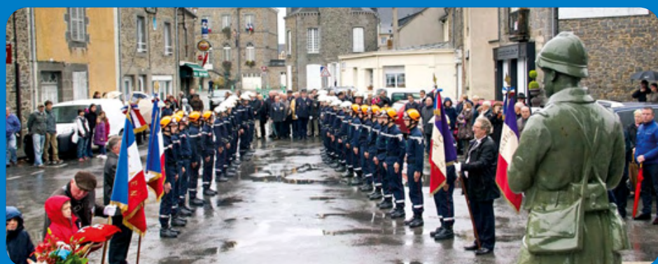
Commémoration de l'armistice de 1914/1918 le 11 novembre 2014 en présence du Général de division Loïc Morel.