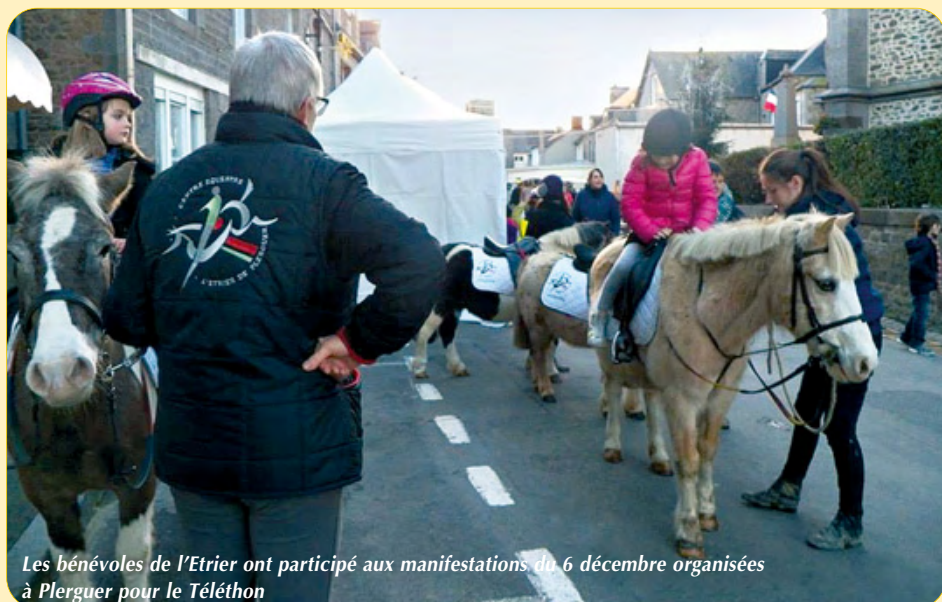
Les bénévoles de l'Etrier ont participé aux manifestations du 6 décembre organisées à Plerguer pour le Téléthon