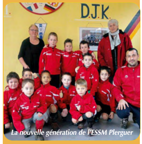
La nouvelle génération de l'ESSM Plerguer

Tous les entraînements et les stages sont encadrés par Sandy (brevet d'état football).