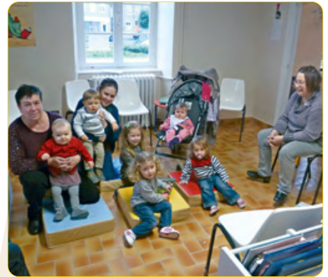
Animation « la forêt »

A la demande des enfants nous devons d'ailleurs rappeler avec insistance aux parents que la bibliothèque est gratuite pour les enfants jusqu'à 14 ans. Pour un adulte le coût est de 3euros à l'année et pour une famille entière de 6 euros à l'année.