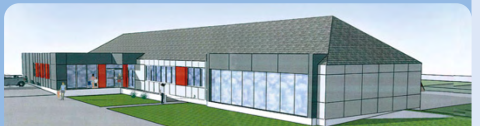
Le Centre multigénérationnel. Restructuration de la salle de la Cerisaie - dessin d'étude.