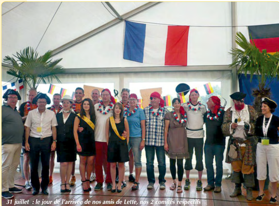
31 juillet : le jour de l'arrivée de nos amis de Lette, nos 2 comités respectifs