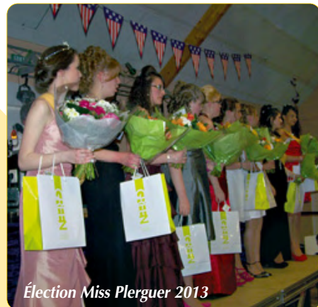
Election Miss Plerguer 2013

Le Comité des Fêtes vient d'avoir le 22 décembre dernier, 50 ans de déclaration officielle au journal officiel , il est