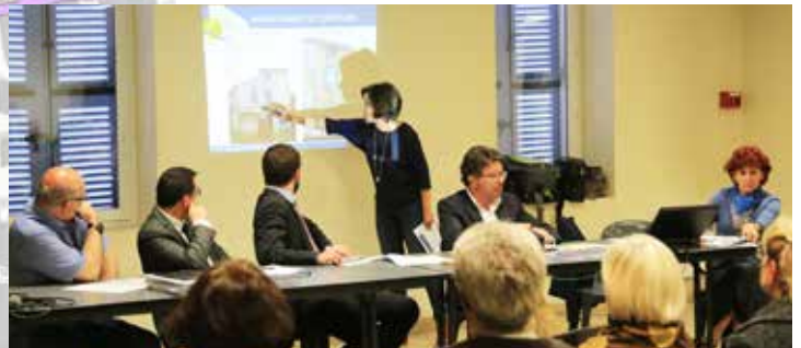
La réunion sur «l'action façade» du jeudi 16 avril dernier a permis aux administrés d'en savoir plus sur les démarches à effectuer.

P lus que deux ans ! Deux ans pour bénéficier des aides financières concernant les travaux de réhabilitation de vos logements de + de 15 ans. Votre façade se situe dans le périmètre d'intervention (cf. schéma ci-contre) ?