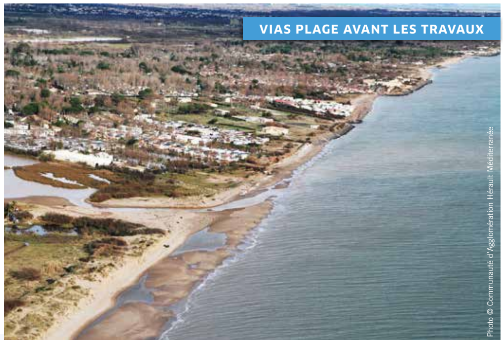
VIAS PLAGE AVANT LES TRAVAUX

Malgré un recours déposé par l'ADEIHV (Association de Défense Environnementale et Intérêts des Habitants de Vias) devant le Tribunal administratif de Montpellier, visant à suspendre les travaux en cours, la plage a retrouvé sa place sur notre littoral. En effet, le recours de l'ADEIHV a été rejeté par la juridiction administrative par Ordonnance du 13 mars 2015.