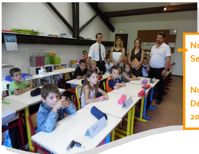
Nouvelle classe Septembre 2014