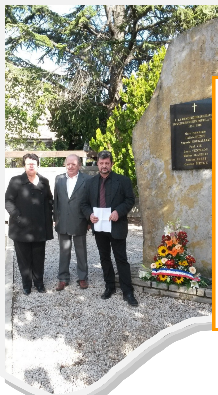
Le 11 novembre