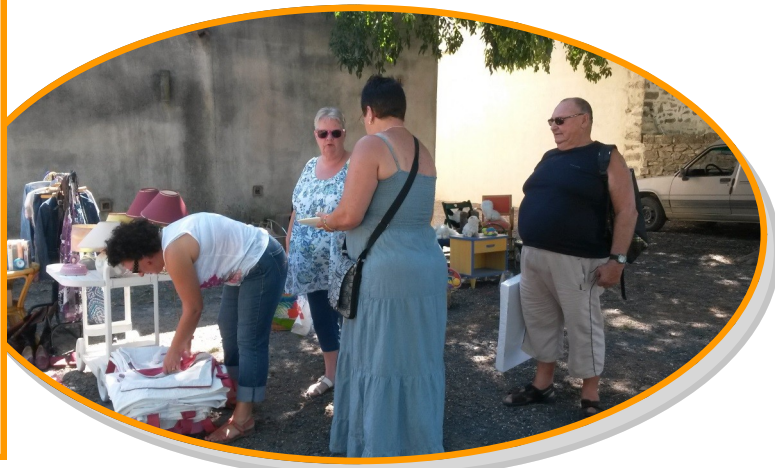
← Les puces Septembre 2014