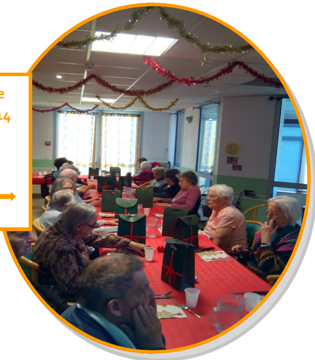
Noël des Aînés Décembre 2014