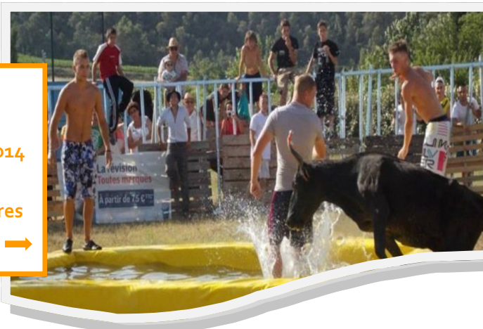
Fêtes de Vacquières Juillet 2014