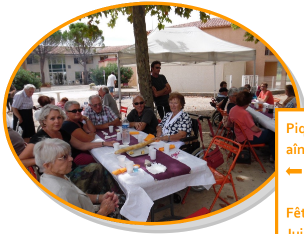
Pique-nique des aînés