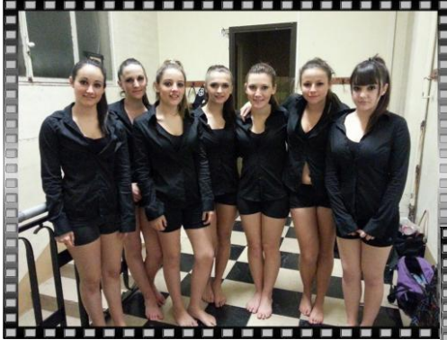
groupe 13 à 15 ans

Ces jeunes filles ont beaucoup travaillé ces derniers mois et n'ont rien lâché face aux autres groupes qui ont souvent 3 à 4 heures de danse par semaine (1 heure + 1 heure de répétition pour elles).