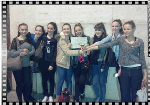
gagné le 2ème prix