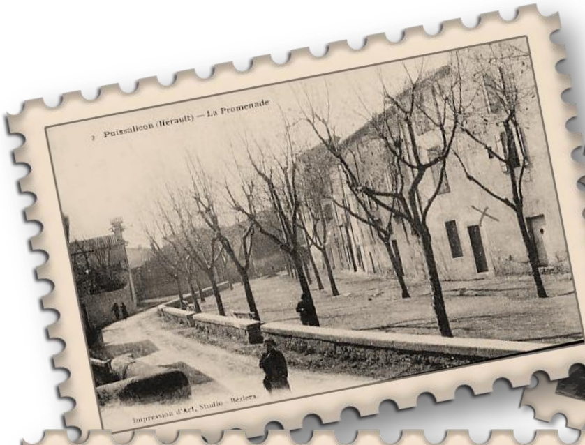
2 Puissalicon (Hérault) — La Promenade