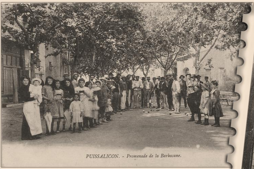
PUISSALICON. - Promenade de la Barbacane.