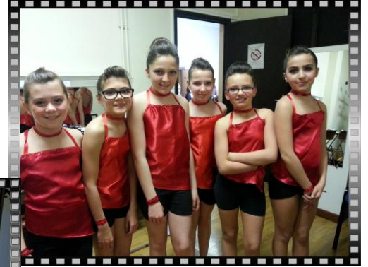
groupe 10 à 11 ans