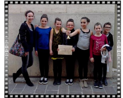
gagné le 3ème prix

En fin de journée, après les résultats, on ressentait une grande joie parmi les participantes et beaucoup d'émotions pour leur professeur très fière d'elles !!