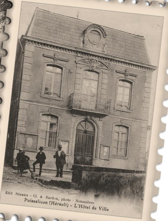
Edit Sénau - Cl. A. Bardou, photo - Sommières Puissalicon (Hérault) - L'Hôtel de Ville