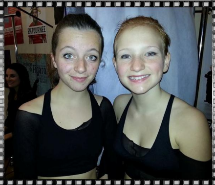
gagné le 3ème prix