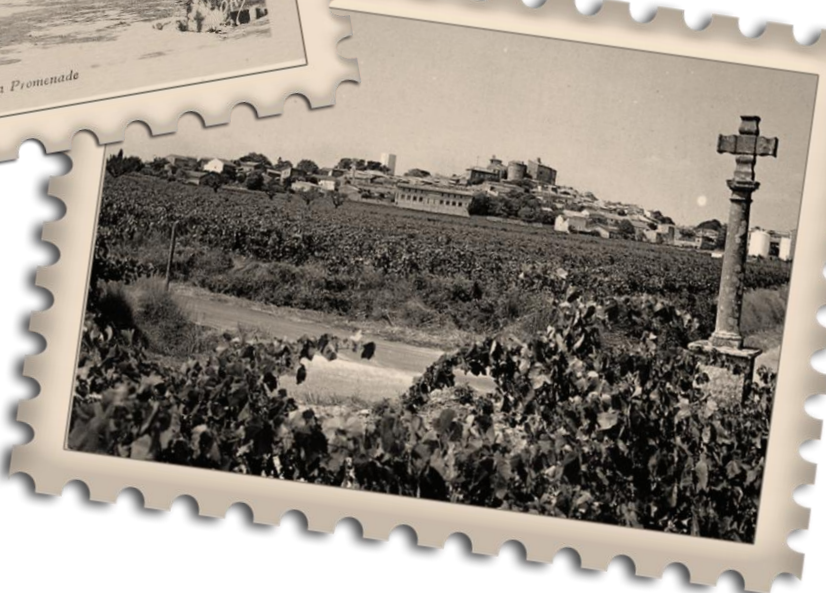
3. PUISSALICON - La Promenade