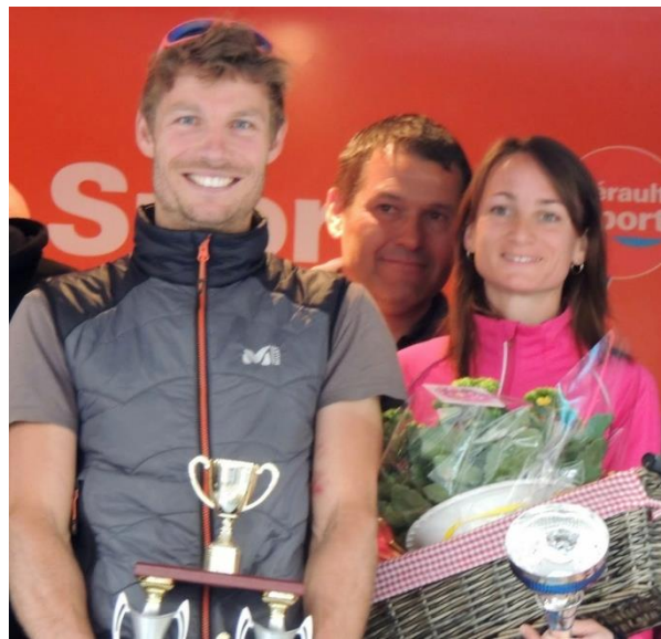
Les deux vainqueurs.