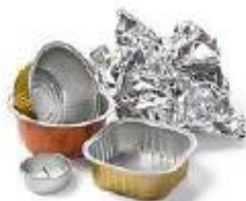
Emballages métalliques et papier alu