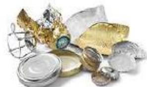
Couvertures et capsules métalliques