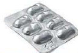
Plaquettes de médicaments vides