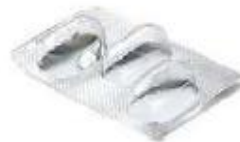
Blisters médicament (vides)