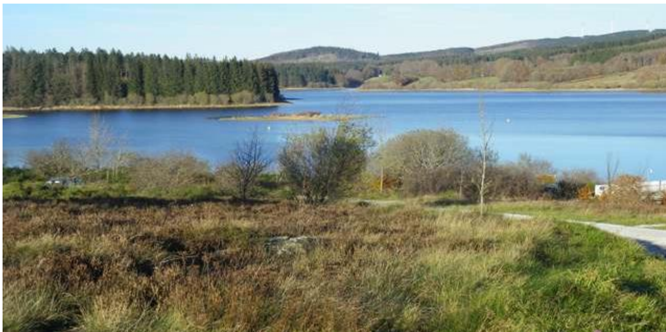
Le lac de Vésoles