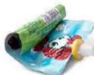
Poches de compote