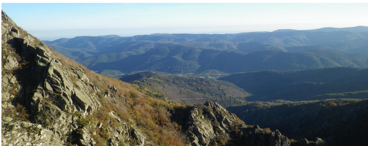
Vue du haut des mille marches.

Retrouvez votre bulletin municipal sur le nouveau site internet de la Commune : camping-premian.fr , rubrique Mairie, bulletin municipal. Vous trouverez aussi les comptes rendus des réunions du Conseil Municipal. Si vous désirez ne plus recevoir la version papier, mais être averti de la mise en ligne, signalez-vous auprès du secrétariat et communiquez l'adresse mail à laquelle vous désirez le message.