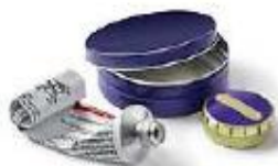
Boîtes et tubes métalliques

Les consignes de tri évoluent grâce à l'amélioration des techniques de recyclage. Désormais, vous pouvez déposer dans les bornes d'emballages (étiquette jaune) les déchets suivants: