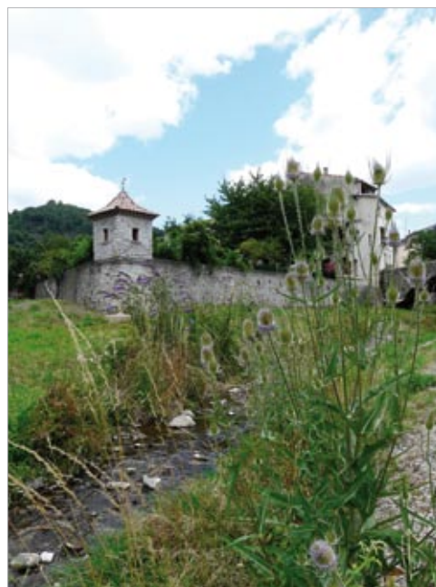
Entretien sélectif des berges par les agents du SIVU

En effet, une rivière en bonne santé nécessite d'avoir un bon débit et une eau de qualité.