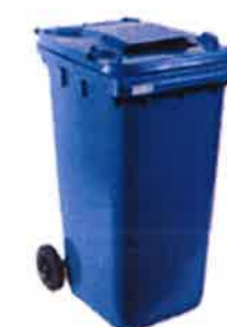
Papiers à sortir le dimanche soir Semaine impaire

Les bacs ne doivent en aucun cas rester dans la rue, ils sont une véritable pollution visuelle et surtout représentent un réel danger pour les piétons, mamans avec leurs enfants et leurs poussettes.