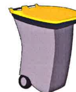
Déchets recyclables à sortir le dimanche soir