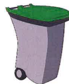
Déchets non recyclables à sortir le jeudi soir avant 19H