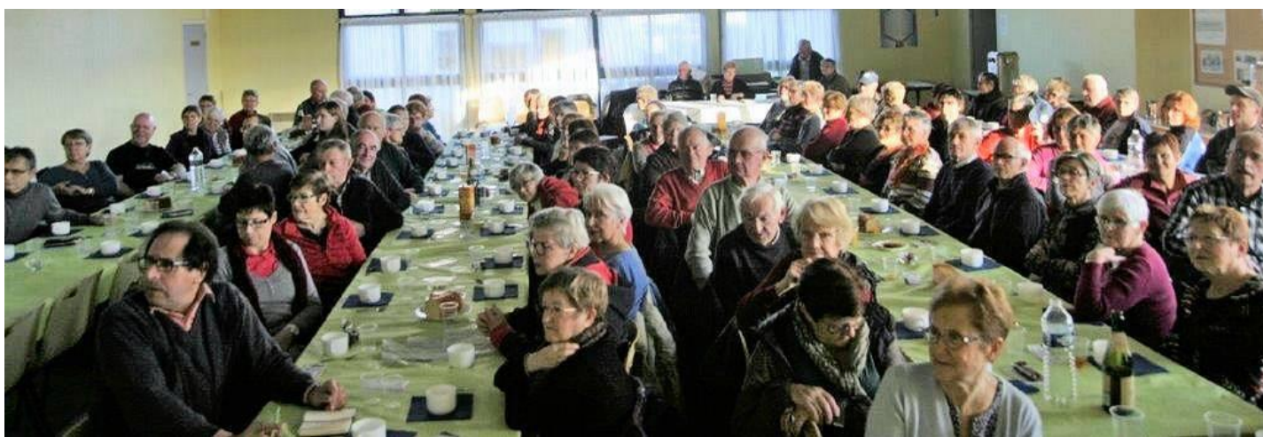
Tous les adhérents très attentifs à la vidéo retraçant le quarantième anniversaire.

Un copieux goûte clôturait cette sympathique assemblée.