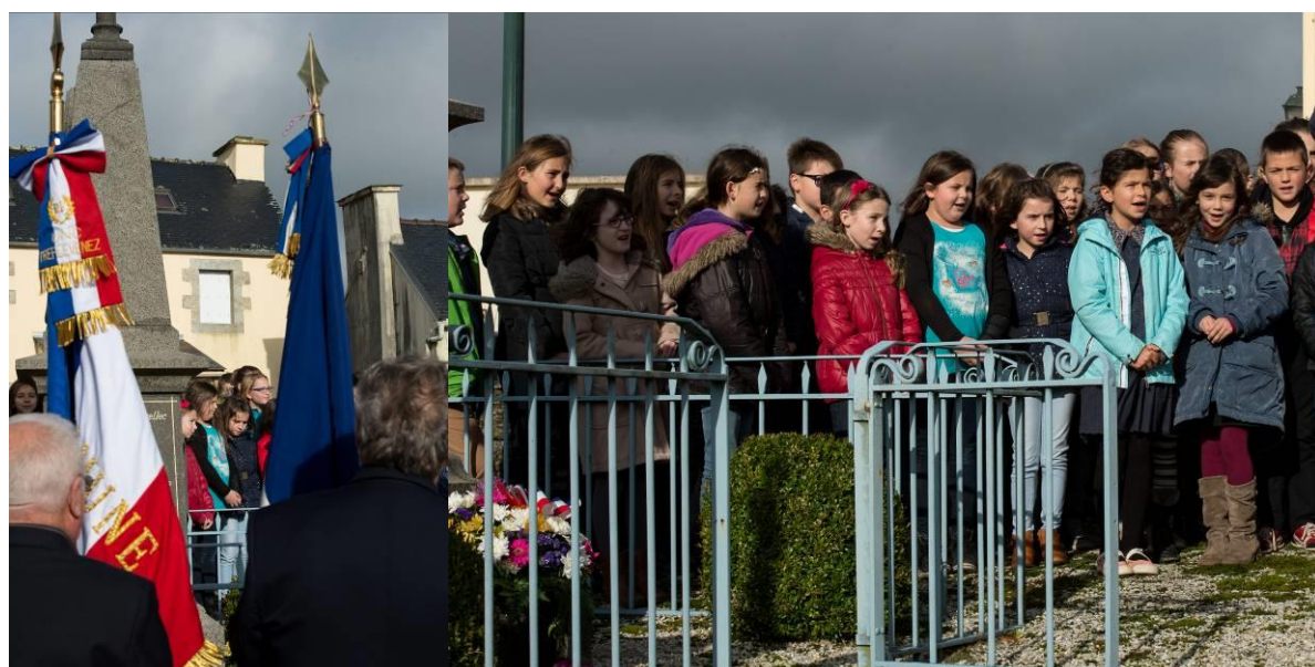
Le 8 novembre 2015 à Tréflévénez : Commémoration de l'Armistice du 11 novembre 1918 avec animation des enfants des écoles de La Martyre