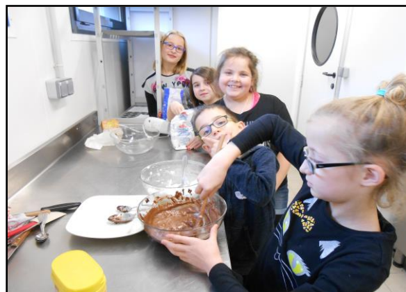
Nos apprentis cuisiniers en pleine confection de la buche de Noël!!

L'entre-aide est présente entre les enfants lors de cet atelier.