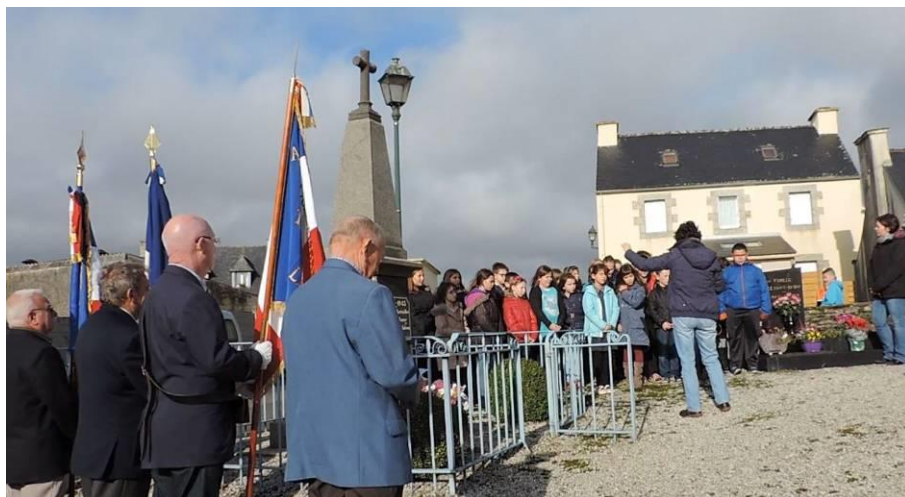
Les enfants des Ecoles entonnant le "Chant des Partisans"

Un apéritif, offert par la municipalité, clôturait cette cérémonie. Les anciens combattants et leurs épouses se retrouvaient tous ensuite pour partager un repas en commun servi à l'Auberge'In à Ty Croas, dans une ambiance festive.