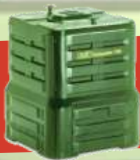
en plastique : 300L=> 15 €

Chaque modèle est disponible sur le site du syndicat à Seneuil – 24600 VANXAINS Renseignements au 05-53-92-41-68.