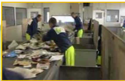
Centre de tri