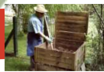
en bois : 600L => 30 €

Si vous souhaitez aller plus loin dans votre démarche de réduction des déchets, voici quelques conseils :