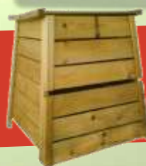
en bois : 300L=> 20 €