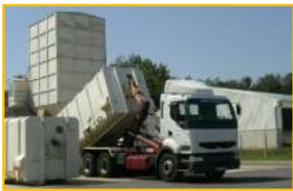
Centre de transfert (sacs noirs)