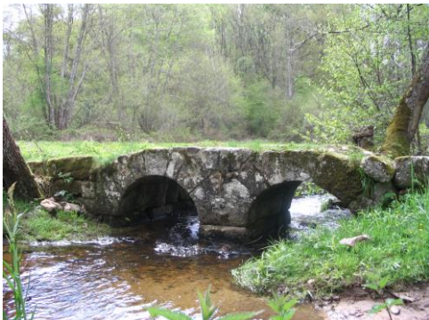
Pont des poupées