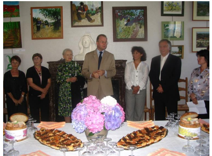
exposition de peinture