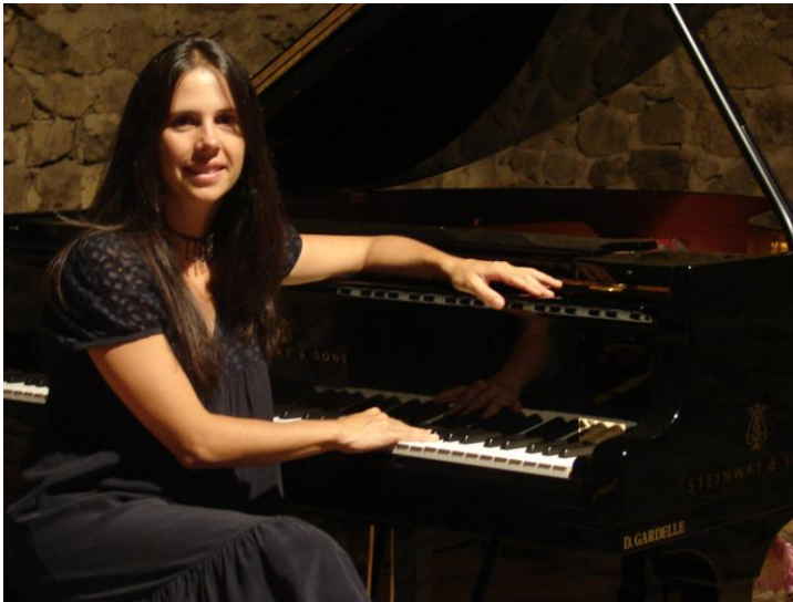
Concert à Fressanges