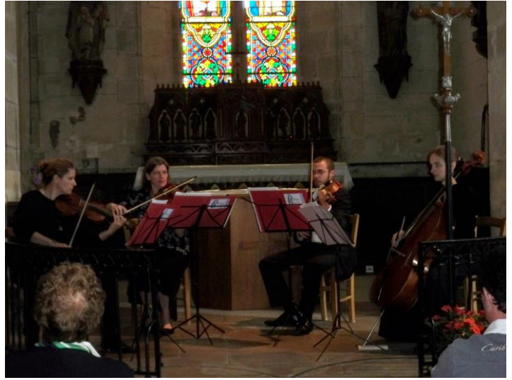
concert à l'église