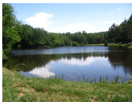
étang du Masvaudier