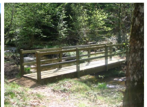
passerelle de l'étang