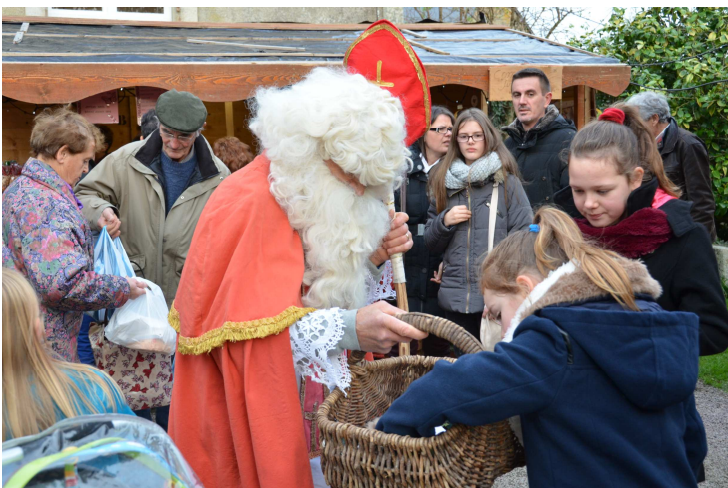
Le marché de Saint-Nicolas des 5 et 6 décembre