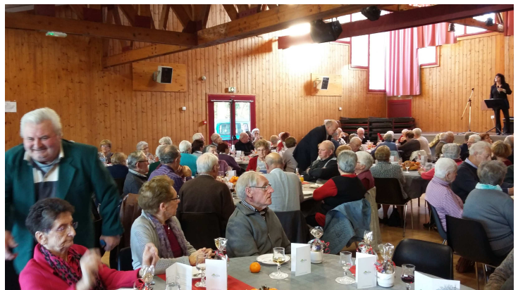
L'après-midi récréatif du 12 décembre