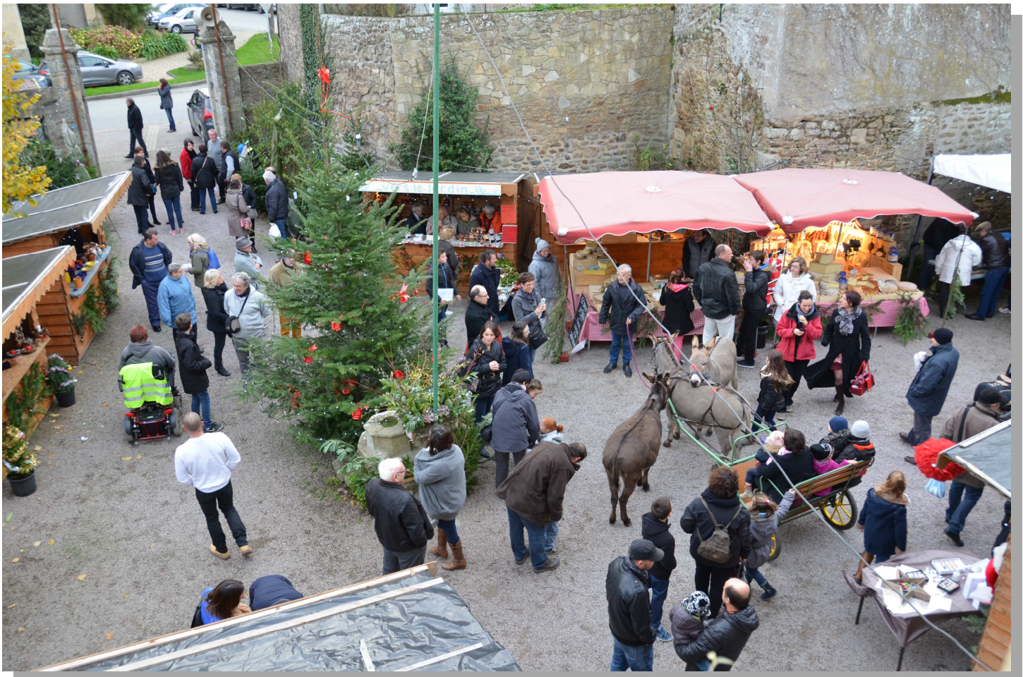
Le marché de Saint-Nicolas