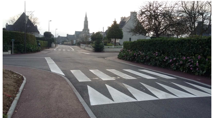
Avant Nouvel aménagement du carrefour de la Rue du Val, de la Rue du Bois-ès-Fènes et de la Rue du Clos Breton