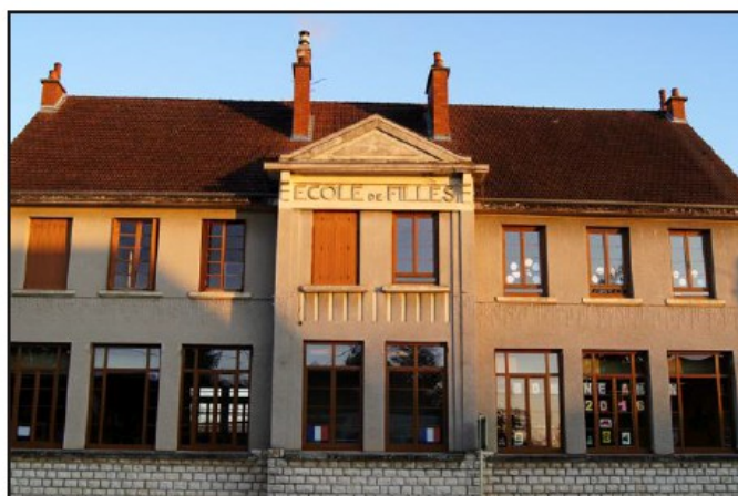
■ La façade de l'école primaire a retrouvé son sérieux.