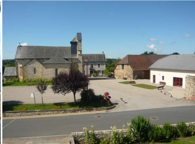
Après (juillet 2008)