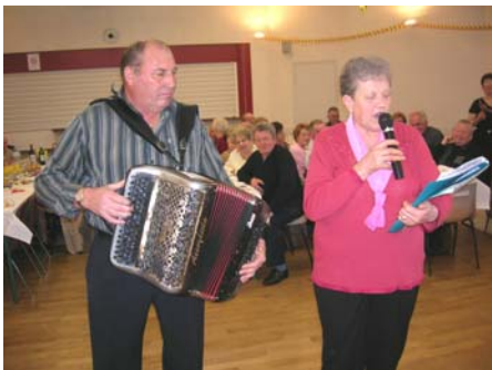
Repas du club (mars 2007)