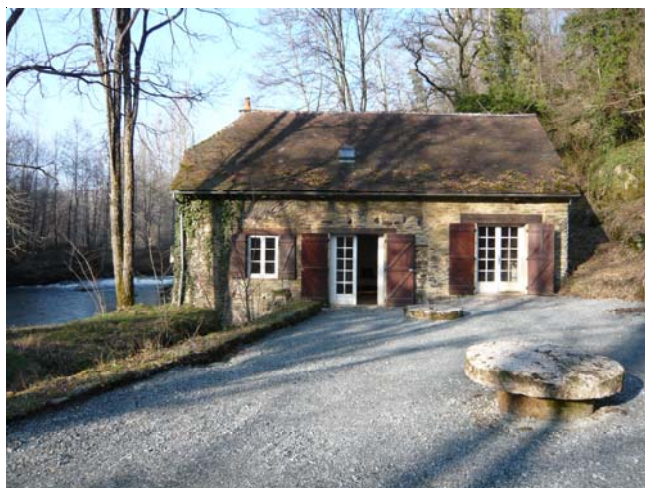
Après les travaux d'accessibilité au moulin (mars 2008)