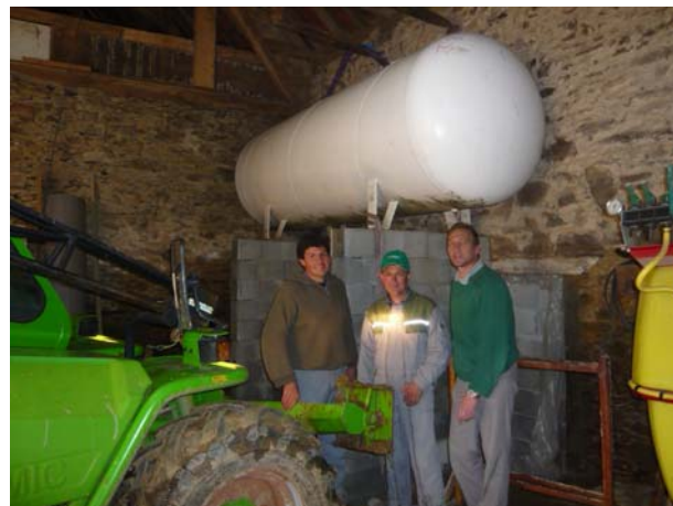
Mise en place de la cuve de récupération de l'eau

-Récupération des eaux pluviales de l'atelier municipal pour l'arrosage des fleurs : des gouttières ont été mises en place sur le bâtiment et la cuve a été installée par Stéphane, Jean-Jacques et Jean-Pierre et raccordée aux gouttières par l'entreprise Delcambre.