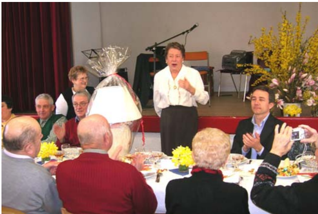
Mars 2007 - La présidente est honorée pour ses 10 ans à la tête du club.