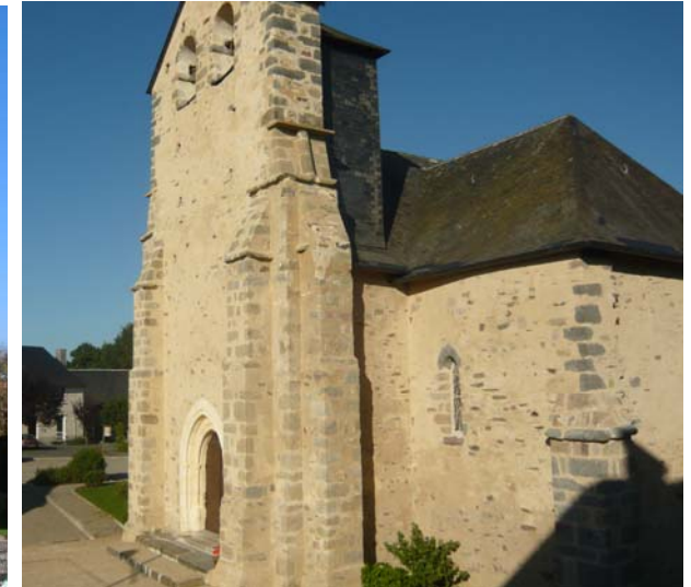
Après (juillet 2008)