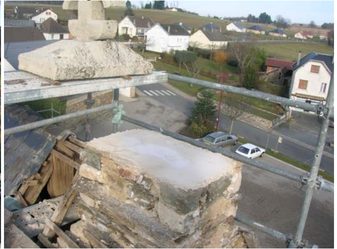
Dépose de la croix et réfection de son mur de soutien