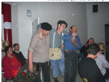
Entrée en scène