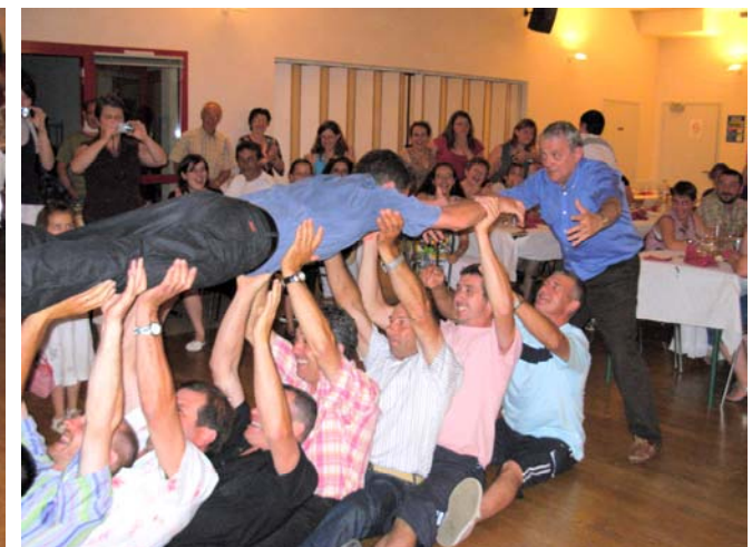
Ambiance : Belle solidarité entre le curé et le maire, « portés » par les élus, lors de la fête du mai des élus (28 juin 2008).