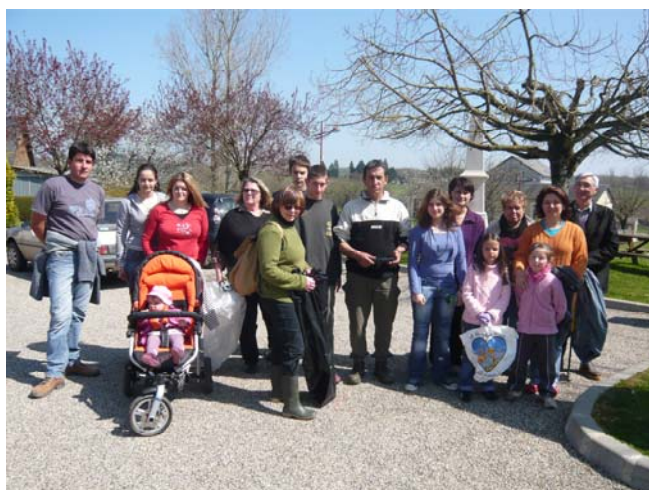
Le groupe qui a nettoyé la nature

-Remise en état d'un puits communal : volet mis en place, boiseries peintes et puits fleuri.