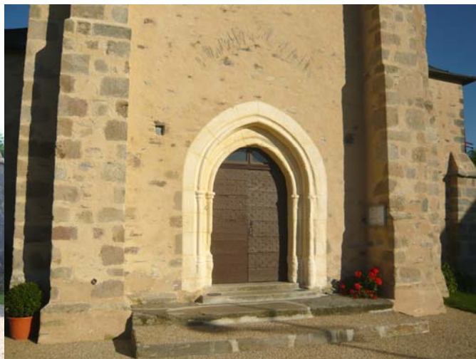
après (avril 2008)