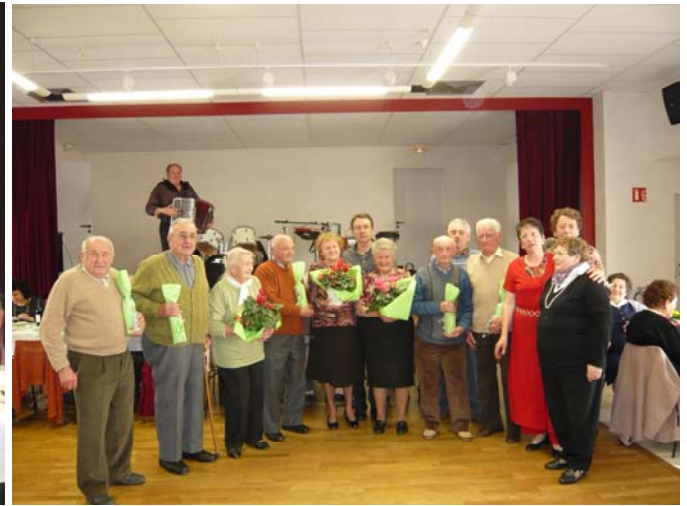
On fête les anniversaires (8 mars 2008)

Nous rappelons que les réunions du club des Aînés se tiennent le 1 er samedi et le 3 ème jeudi de chaque mois, à 14 heures, à la salle du club. Elles sont animées par des jeux de société et nous fêtons les anniversaires.