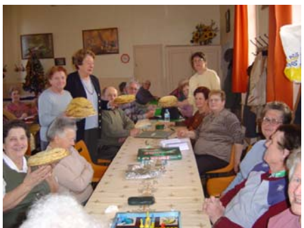
Après-midi crêpes et Chandeleur en février 2007

Le 2 février 2007, la « Chandeleur » a été fêtée avec une soixantaine d'adhérents et les dames du club avaient fait sauter les crêpes arrosées de pétillant.