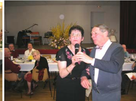
Repas du club (mars 2007) : beaucoup de chanteurs, trio, solo ou duo

Le voyage de printemps a eu lieu à Conques et la vallée des Daims avec 46 participants le 9 juin.