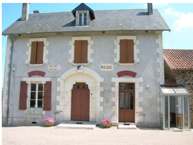
Mairie – Été 2007

Afin de restaurer les façades de l'ensemble des bâtiments communaux, dans un but esthétique et de consolidation, celles de la mairie et de l'ancienne école du bourg ont été rénovées par l'entreprise Gourinchas (St Sulpice d'Excideuil) pour 29 762 € TTC avec deux subventions (7 400 € de l'Etat grâce à Mme le Sous-Préfet et 4 625 € du Conseil général de la Corrèze). Le vieux crépi a été pioché et remplacé par un enduit à pierres apparentes. Le résultat est très satisfaisant.