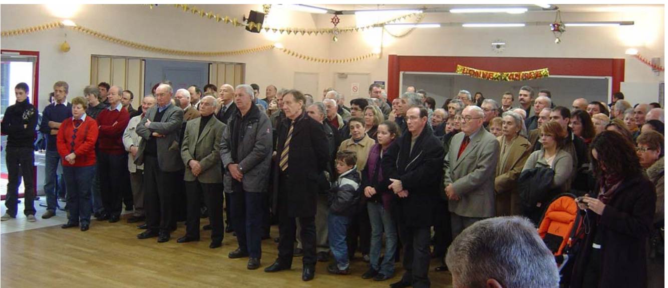
La population de Beyssenac et les élus des communes voisines assistent à la réception donnée à l'occasion de la nouvelle année (6 janvier 2008).