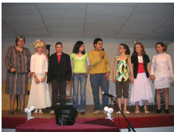
Théâtre (avril 2007)

Les 26 et 30 avril, avaient lieu les représentations théâtrales. De nombreux spectateurs ont applaudi chaleureusement tous ces bénévoles qui s'investissent pendant plusieurs mois pour offrir un spectacle de qualité.