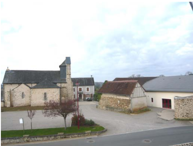
Avant (avril 2008)