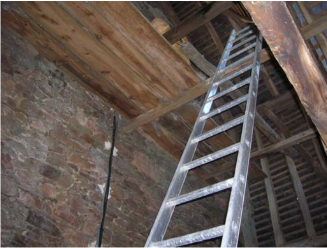
Accès de la voûte vers les cloches avant travaux.

Travaux de charpente et de menuiserie au niveau de la voûte et à l'intérieur du clocher et de consolidation de la charpente de la chapelle nord.