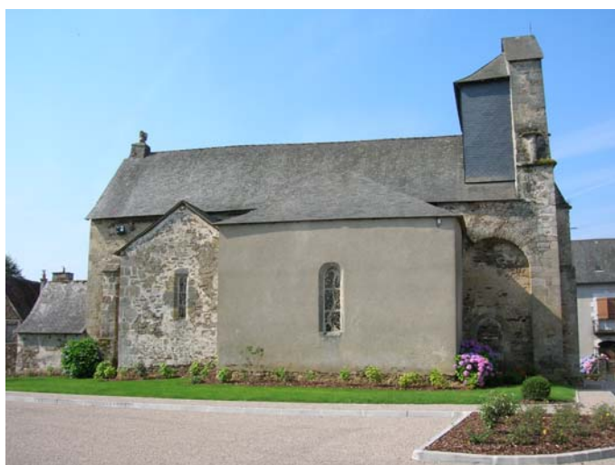
Chapelle nord : avant (octobre 2007)