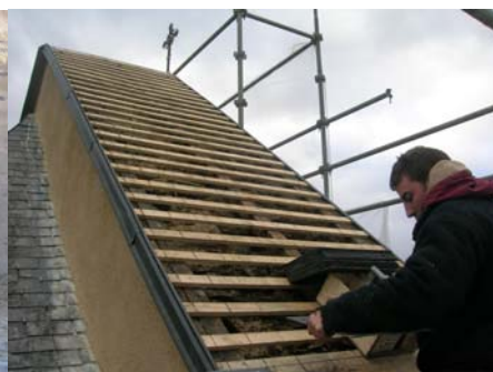
Couverture du clocher