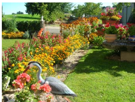
Roger Daurat (4 ème )

Concours départemental 2007 des jardins et maisons fleuries de la Corrèze