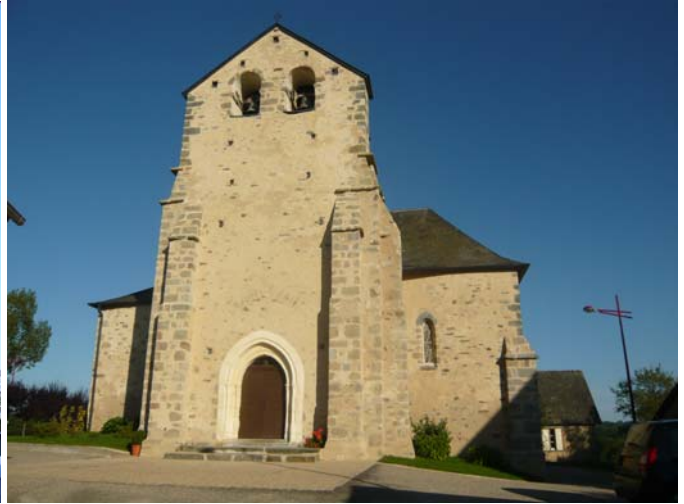
Après (juillet 2008)

4 sentiers de randonnées pédestres ont été balisés à Beysсенac lors de la réalisation du Topoguide de 16 sentiers de la Communauté de communes du Pays de Pompadour. Un panneau installé sur la place de l'église de chacune des 6 communes comprend, au recto, la carte des sentiers de la commune concernée et, au verso, la carte des 16 sentiers de la Communauté de communes du Pays de Pompadour.