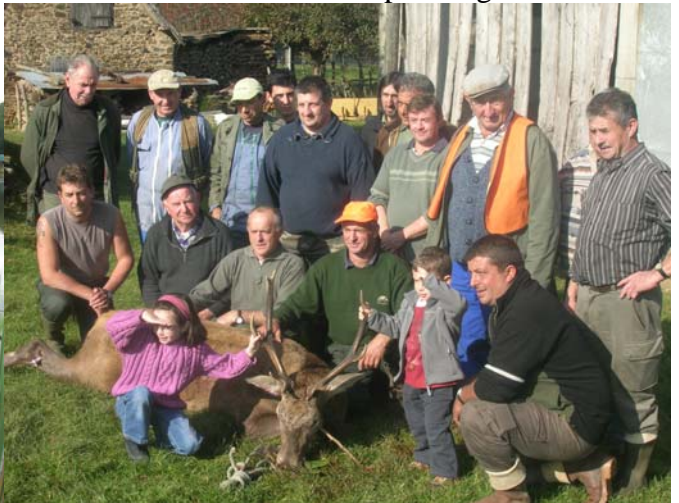
Battue au cerf (28.10.2007)