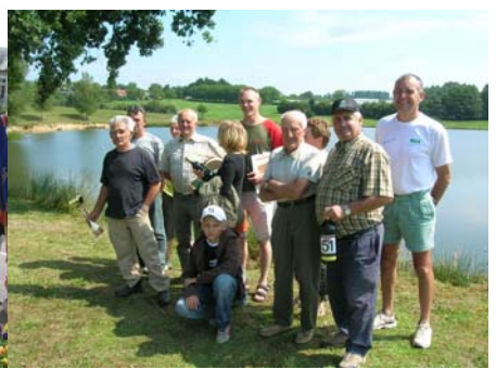
Concours de pêche du foot de St Cyr-13 mai 2007 : AG du Bataillon Violette – Concours de pêche (août 2007)