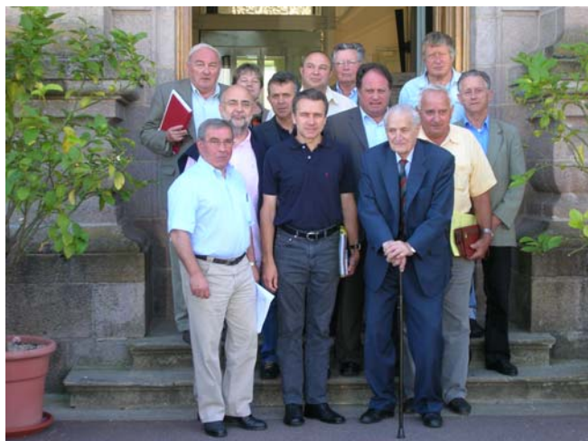
Comité syndical 2007 à Saint-Yrieix

Cérémonie du 65 ème anniversaire du massacre le lundi 16 février 2009 (ou le dimanche 15 février 2009).