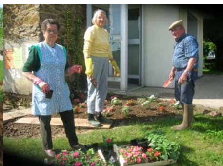
Les bénévoles de la commission de fleurissement