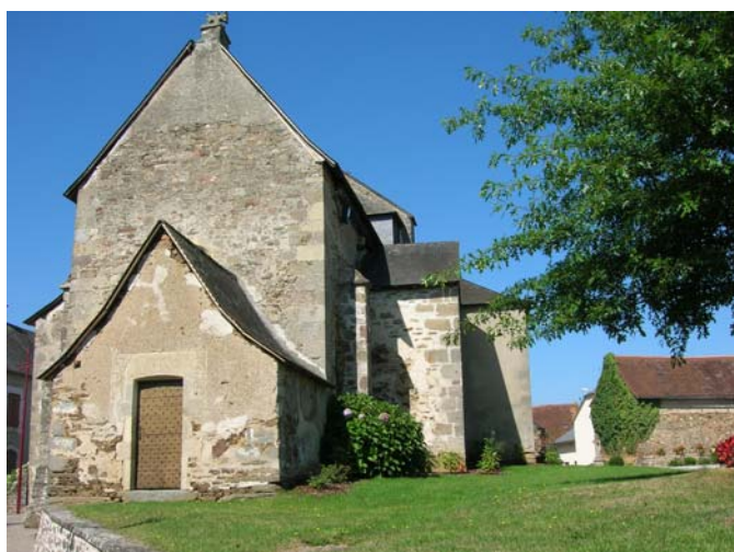
Sacristie : avant (octobre 2007)