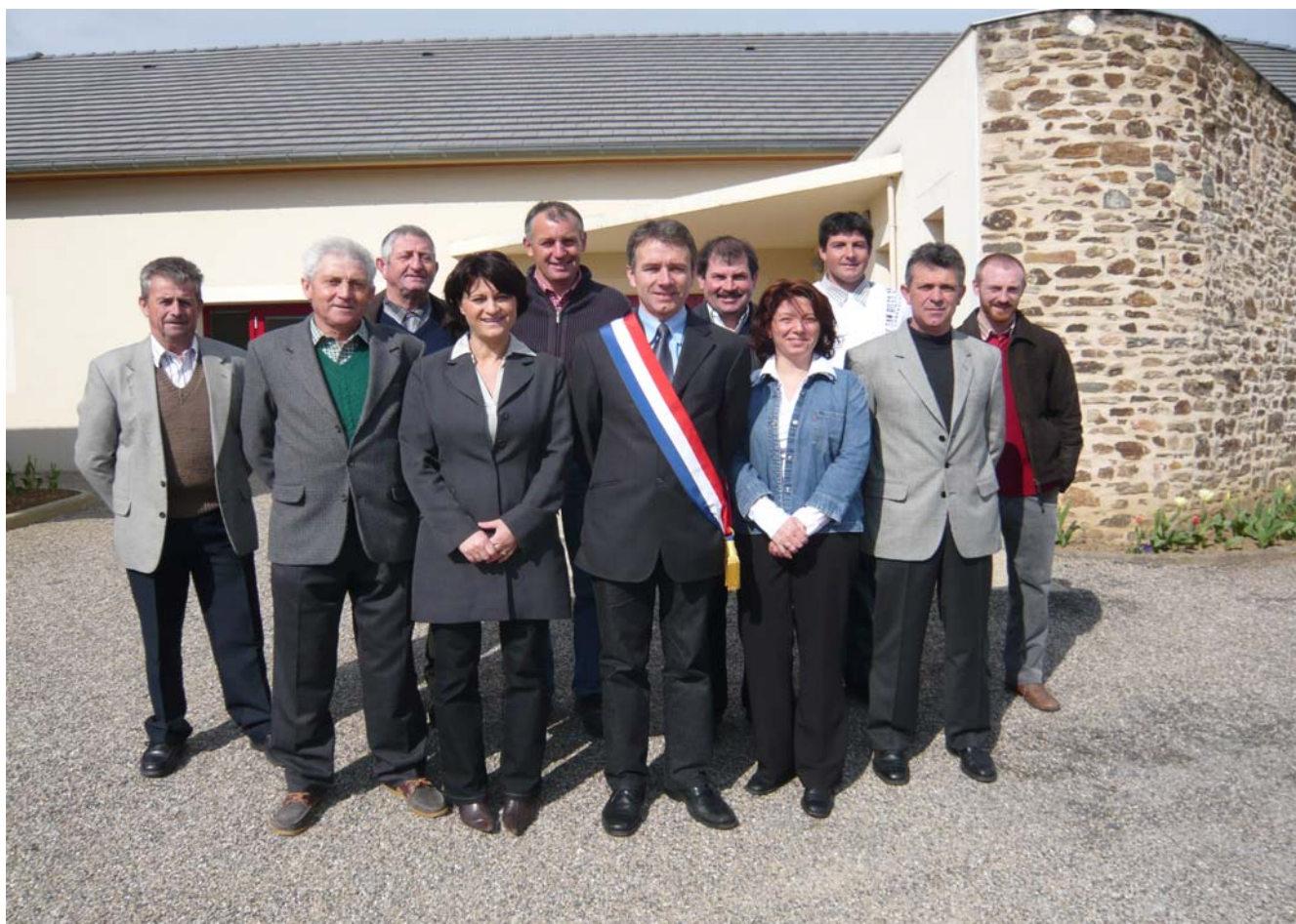
De gauche à droite :