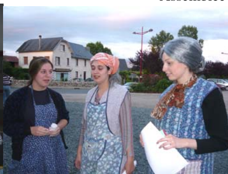
Théâtre (avril 2008)