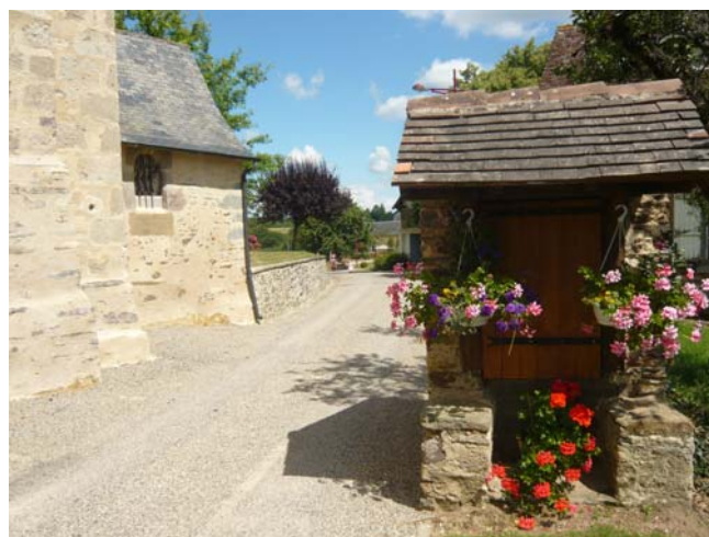
Puits communal, rue de l'église

-Information sur l'existence d'une ZNIEFF (Zone Naturelle d'Intérêt Ecologique, Faunistique et Floristique) le long de la vallée de l'Auvézère : document d'une page à disposer à la mairie, dans les gîtes de Beyssenac et à l'Office de tourisme.