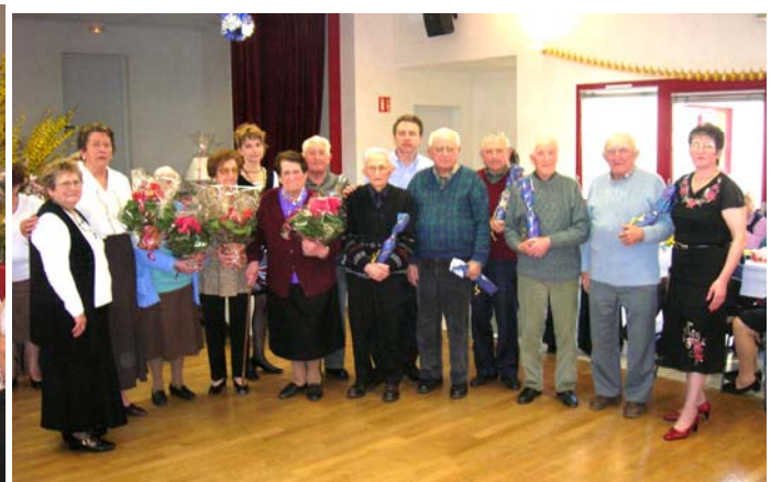
On fête les anniversaires

Le Club tient à remercier la Municipalité pour l'aide qu'elle lui apporte, la secrétaire de mairie et toutes celles et ceux qui, tout au long de l'année, se dévouent pour assurer son bon fonctionnement. En 2007, le club comptait 135 adhérents.