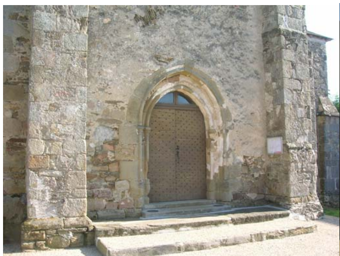
Parvis de l'Eglise : avant (octobre 2007)