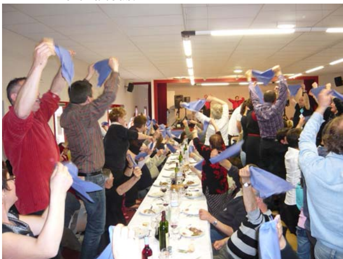
Repas du cerf (16 mars 2008)