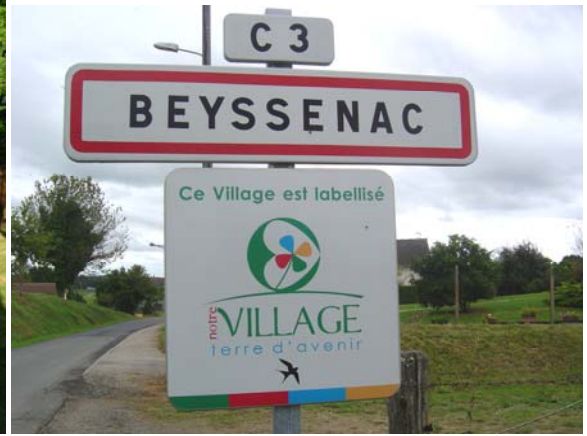
Les élus ont planté un ginkgo biloba le 28 juin 2008 le jour du « mai ». Label « Notre Village, Terre d'Avenir »