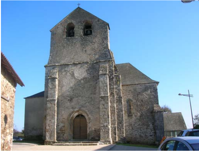
Avant (octobre 2007)