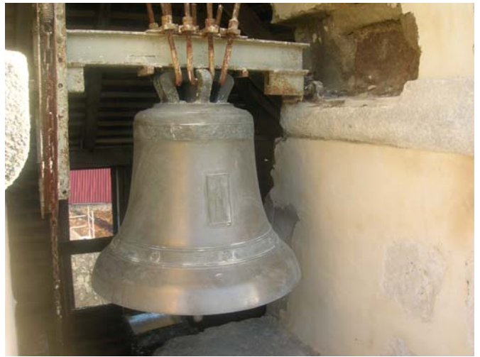
La cloche « Marie-Louise » (227 kg), mise en place en 1966.