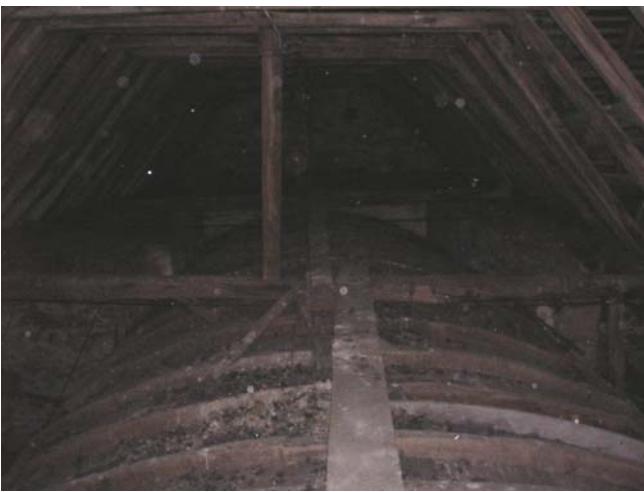
Accès à la voûte sur la nef et le chœur avant travaux.