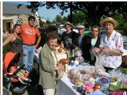
Kermesse (2 septembre 2007)