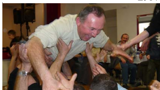
Repas de chasse du 16 mars 2008 - Le Trésorier et Le Président « dansent » le Paquito.