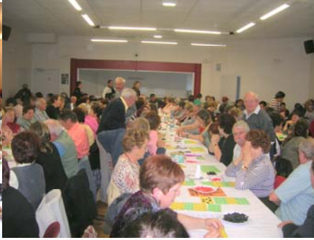
Loto (novembre 2007)