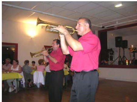
Fête de la musique (juin 2007)

Le réveillon de la Saint Sylvestre organisé à la salle polyvalente a terminé l'année 2007 et lancé 2008. Tout le monde a apprécié le repas préparé par « Jérôme » - traiteur à Génis - et dansé avec l'ensemble « Horizon ».