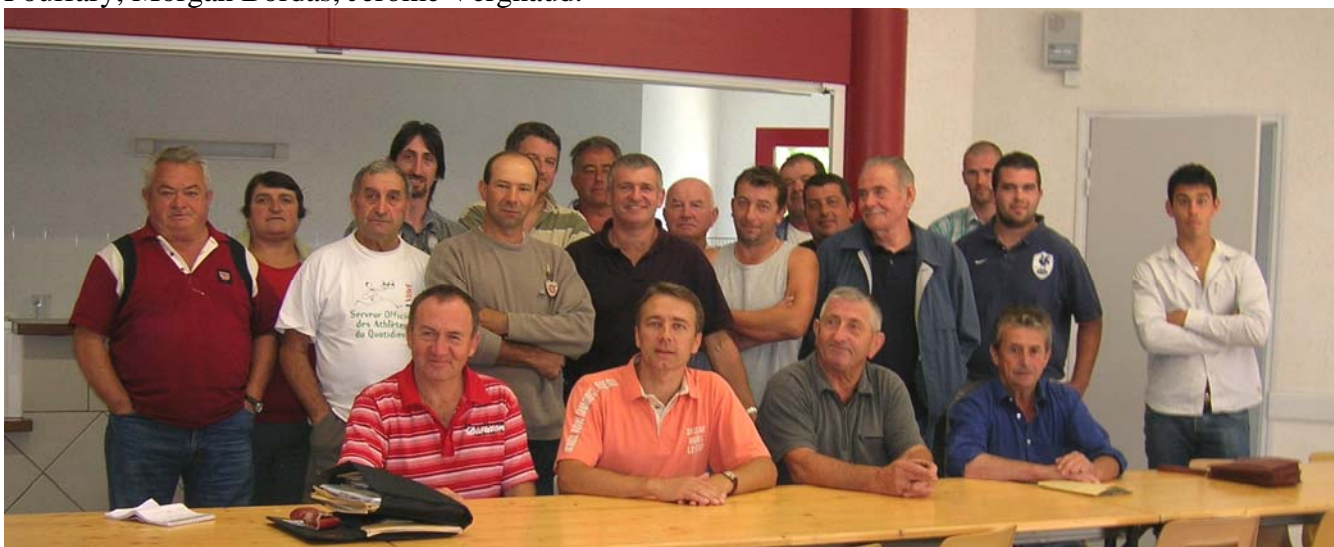
Assemblée générale du 2 septembre 2007