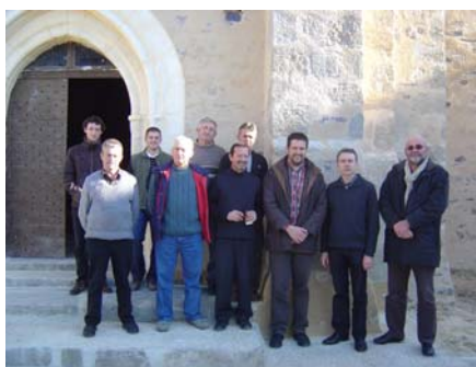
Réception des travaux (12.02.08)