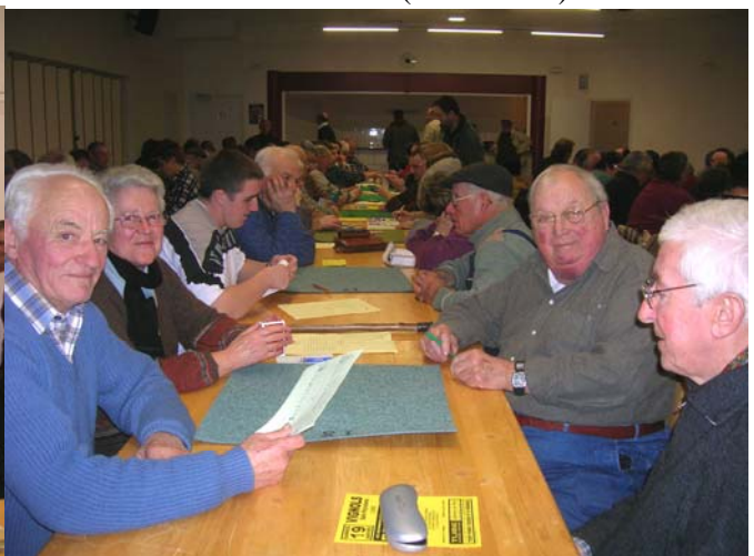
Concours de belote (décembre 2007)