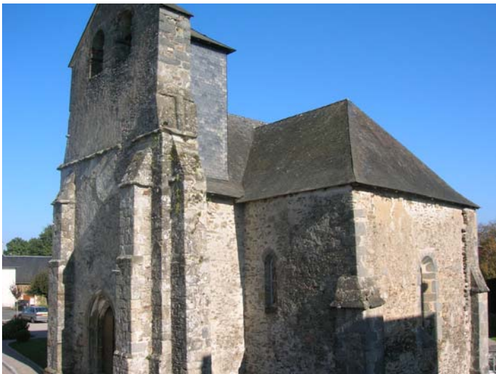
Avant (octobre 2007)