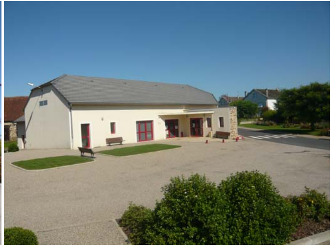
Après (juillet 2008)