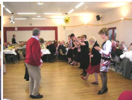
On danse après le repas (mars 2007)