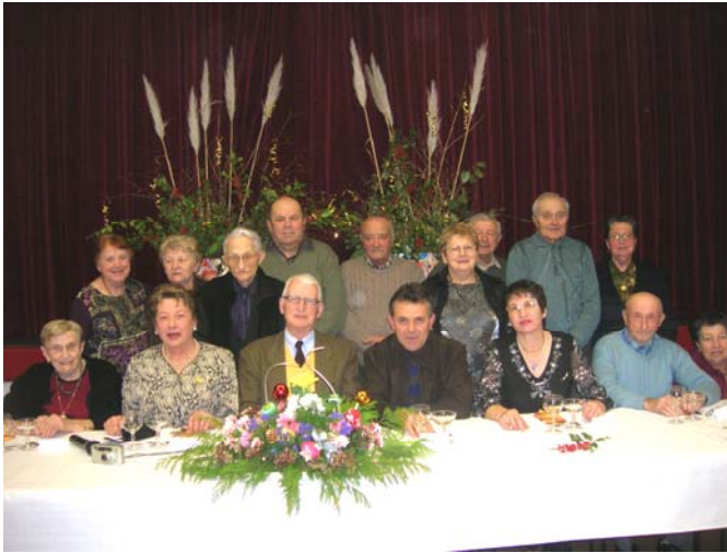
Assemblée générale (janvier 2007)