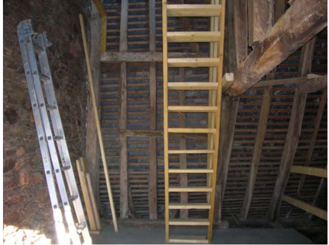
Rochelle conduisant au plancher de visite des cloches.