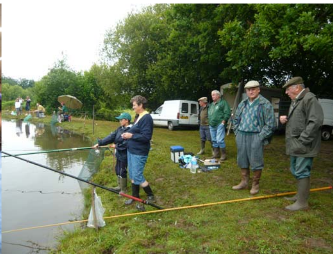
Concours de pêche (06.07.2008)