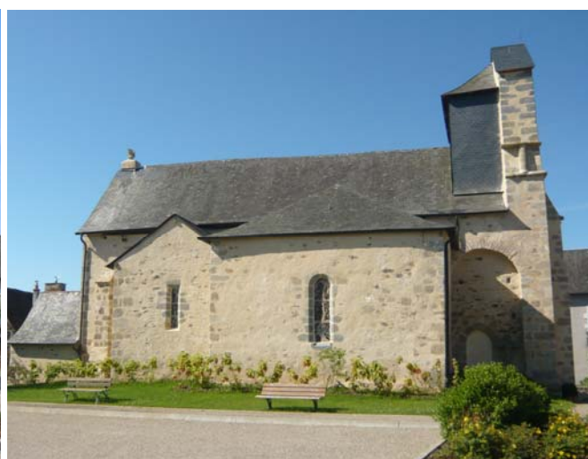
après (mai 2008)