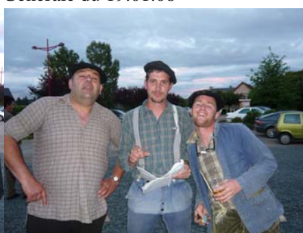
Quelques minutes avant l'entrée en scène