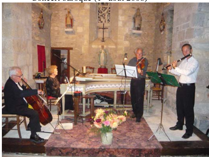
Le quatuor « Les Goûts Réunis »