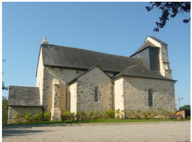
La façade nord a changé d'aspect.