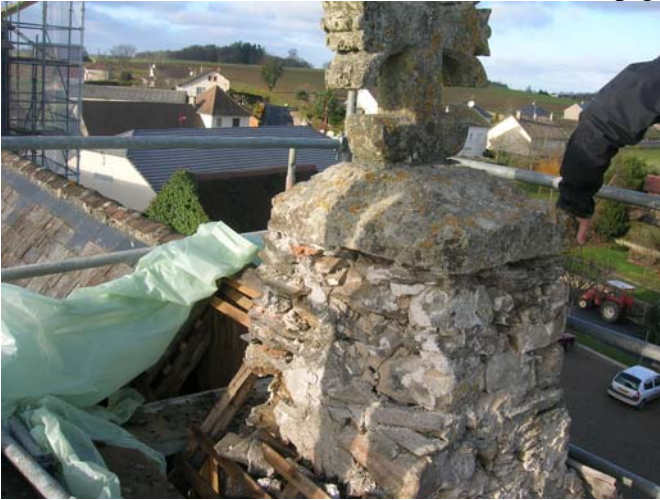
Le muret supportant la croix était très fragile