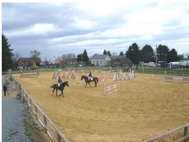
Les Ecuries du Vallon

En octobre 2007, Anne et Patrick Denimal ont ouvert une pension de chevaux, « Les Ecuries du Vallon », au village de la Flotte. Ils peuvent héberger des chevaux à l'année, au mois ou à la semaine dans des structures très modernes. 2 à 3 fois par an, sont organisés des concours de sauts d'obstacles réservés aux jeunes chevaux et aux poneys. La commune de Beyssenac a toujours été partenaire d'une épreuve lors de chaque concours. Prochaines dates, les dimanches 14 septembre, 5 octobre et 2 novembre 2008.