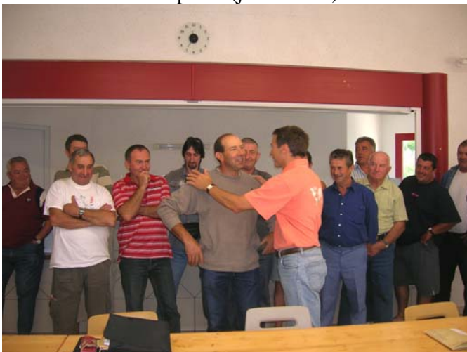
Remise de médaille au garde-chasse