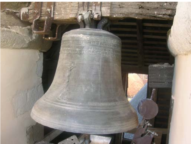
La cloche « Saint-Médard » (176 kg), mise en place en 1864.