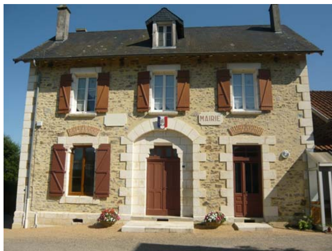
Mairie – Été 2008