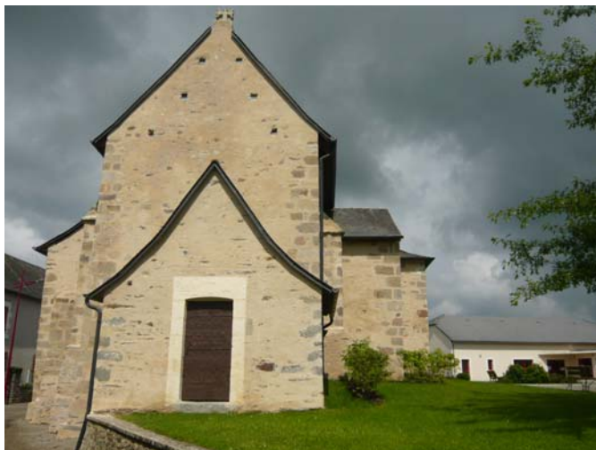
après (avril 2008)