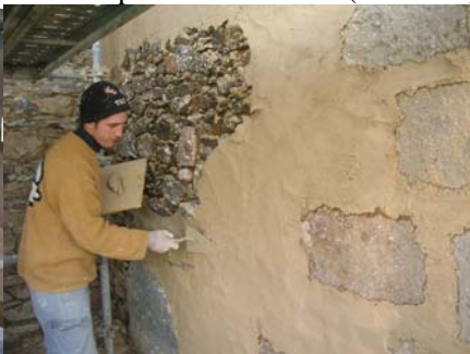
Enduit sur les façades