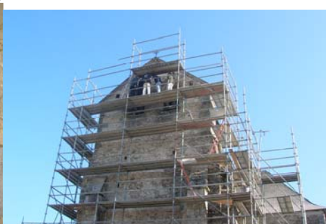
Réunion de chantier à 15 m de hauteur