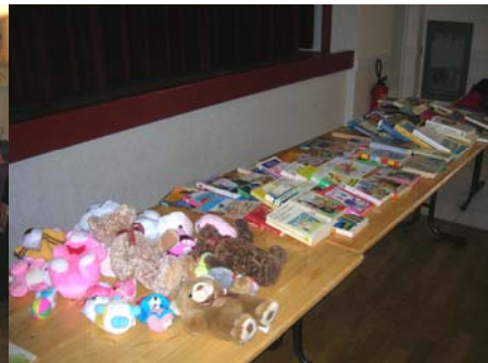
Troc humanitaire (décembre 2007)

Le 19 janvier 2008, s'est tenue l'assemblée générale. Cette réunion est l'occasion de retracer les activités de l'année passée et de programmer les manifestations à venir. Chacun a été invité à prendre la parole pour donner son sentiment sur l'année écoulée ou formuler de nouvelles propositions. Ensuite, le trésorier a dressé un bilan financier précis par activité de 2007. Le résultat positif a été adopté à l'unanimité. Après avoir renouvelé le bureau, le Président a remercié toute l'assemblée ainsi que ceux qui participent à l'organisation et au bon déroulement de toutes les activités. Après avoir traité les questions diverses, un repas a clôturé cette réunion.