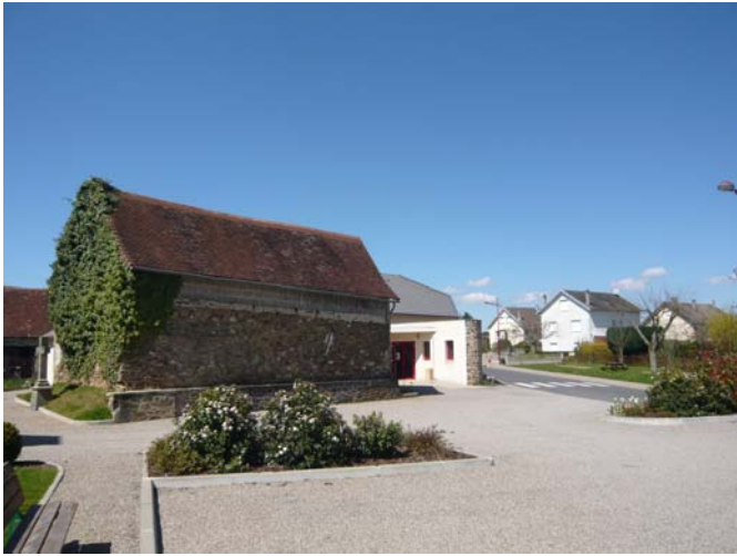
Avant (avril 2008)