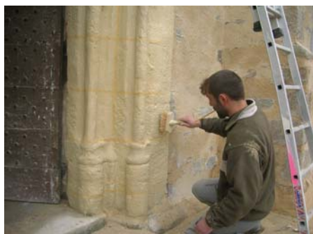
Lait de chaux sur le portail

-rénovation de l'ensemble des façades (piochage du vieux enduit et rejointoiement avec un enduit à pierres vues, renforcement des contreforts, mise en place de pierres de taille, rénovation de la croix de pierre sur le pignon est),