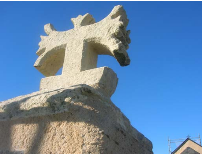
La croix est consolidée et a retrouvé sa place.