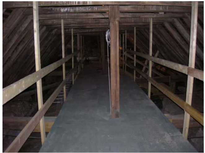
Après les travaux : plancher pour accès sur la voûte.