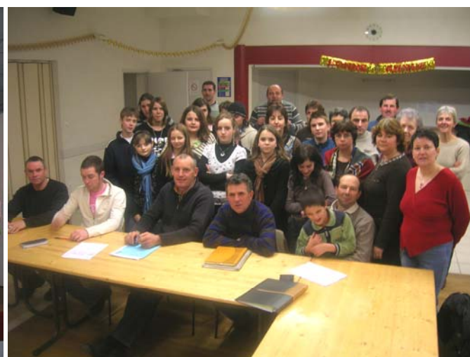
Assemblée Générale du 19.01.08