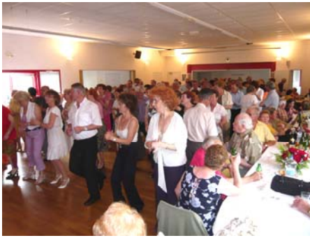
Thé dansant (juin 2008)