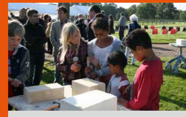
Restauration | Château de Missy