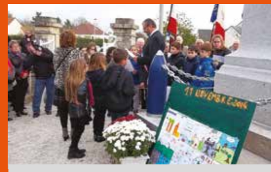
11 Novembre | Noyers Bocage