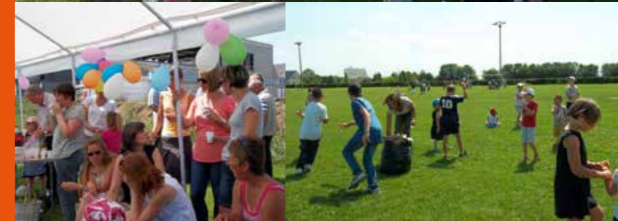
Pique-nique Cantine | Ecole de Noyers-Bocage