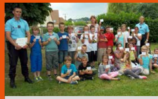
Remise des permis | Ecole de Missy