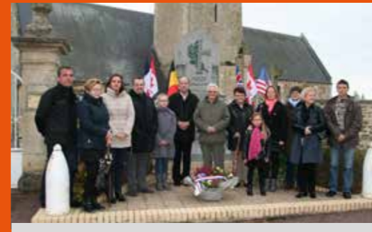
11 Novembre | Missy