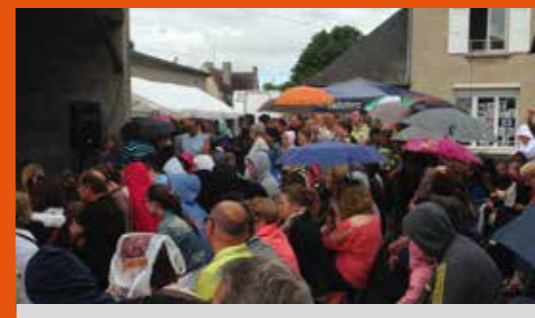
Kermesse | Ecole de Noyers Bocage