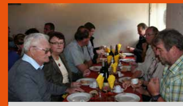
Sortie des aînés |