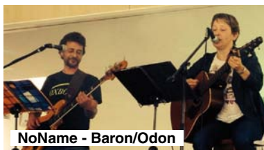
NoName - Baron/Odon