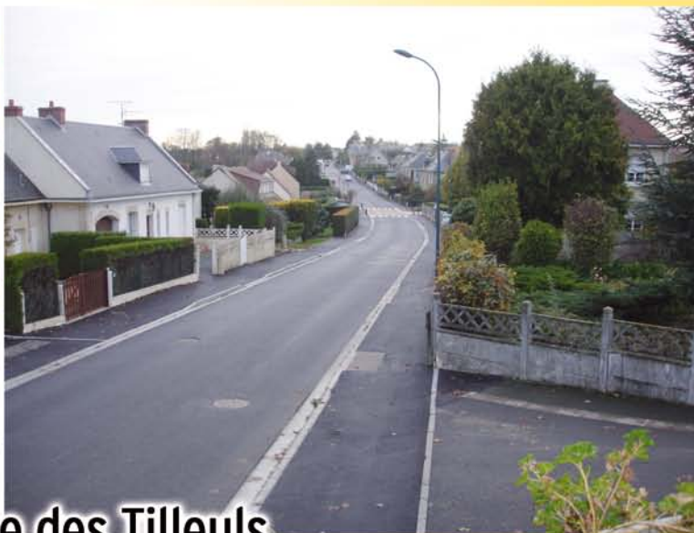
Travaux rue des Tilleuls