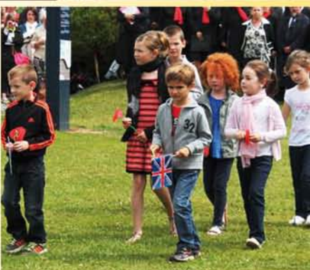
Célébration de la Cote 112