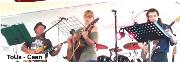
ToUs - Caen