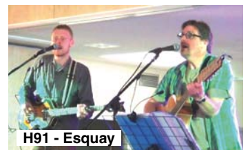
H91 - Esquay