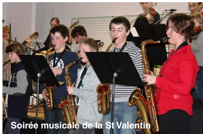
Soirée musicale de la St Valentin

L'école de Musique Intercommunale Orne-Odon est une association de musique très active dans la communauté de communes.