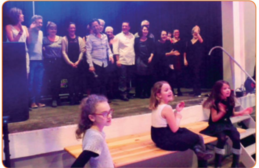
Les membres du Comité des Fêtes ont organisé leur 2e réveillon et ont accueilli la nouvelle année, aux côtés de 96 participants

Si vous souhaitez prêter main-forte aux carnavaliers, contactez le Comité et rejoignez les bénévoles qui œuvrent en soirée pour être fin prêts le jour J. Lever de rideau : le 10 avril à 14h !