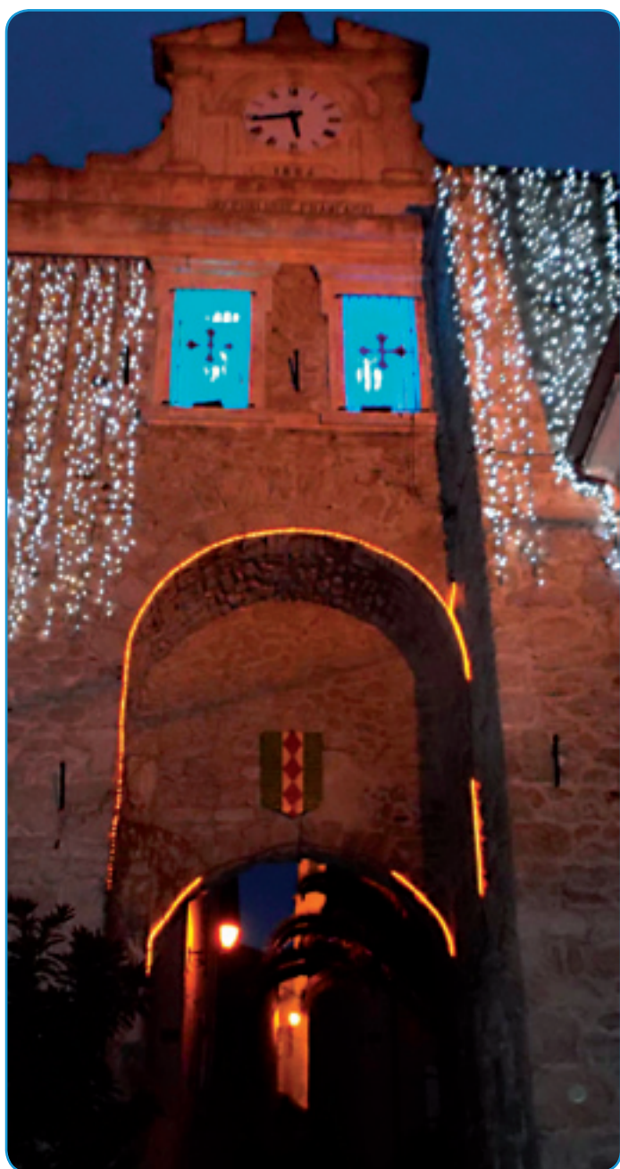
Le Portanel dans son habit de lumière...

Pour que la magie des fêtes de fin d'année opère dès le début du mois de décembre, les services techniques de la commune agissent bien en amont. Cette année, ils ont réparé et installé une quarantaine de motifs lumineux et disposé une centaine de sapins dans les rues du village. Une composition renouvelée chaque hiver, qui invite à glisser vers une nouvelle année empreinte d'optimisme !