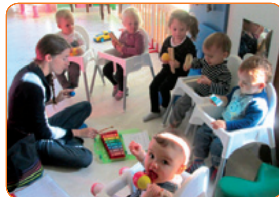
Découvrir la musique et s'éveiller à son rythme au sein de la MAM

Les assistantes maternelles de la MAM accueillent les enfants du lundi au vendredi de 6h à 20h et le samedi de 6h à 18h. Renseignements : 04.68.93.67.49.