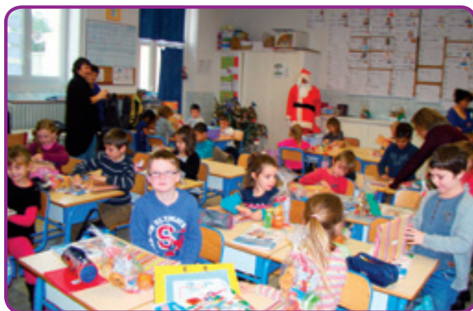
Le Père Noël a entamé sa tournée de cadeaux, dans les classes !

Les personnes âgées de plus de 80 ans ou à la mobilité réduite peuvent solliciter une distribution à domicile, en contactant la mairie au 04.68.93.62.13.