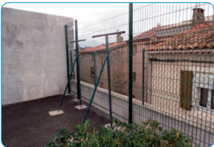
Les panneaux rigides installés près de l'éteudoir

Afin de sécuriser l'espace public situé à côté de l'éteudoir place du Portanel , les services techniques ont remplacé le grillage devenu vétuste par des panneaux de qualité. Plus hauts et plus rigides, ces derniers sont aussi plus protecteurs.