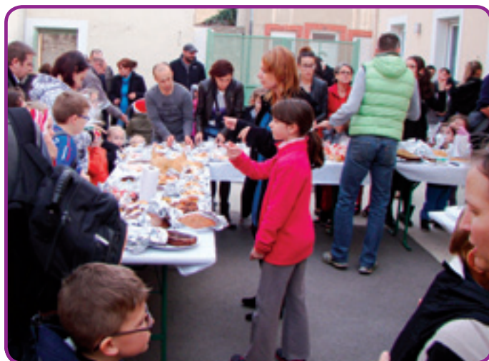
L'école a organisé son premier marché de Noël.