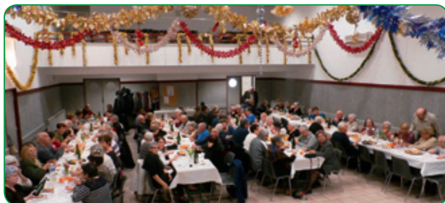
Le traditionnel rendez-vous de début d'année a été bien suivi, et apprécié !

9 janvier , pour partager la traditionnelle galette des Rois. Cette manifestation qui a réuni 120 personnes à la salle des fêtes, était animée en musique par Duo Feeling.