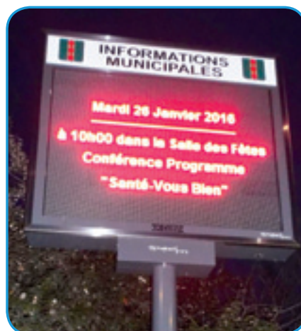
Le panneau lumineux, installé face à la galerie de Malassan