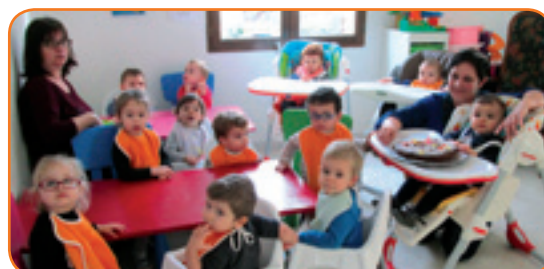
Grandir, ça se fête !