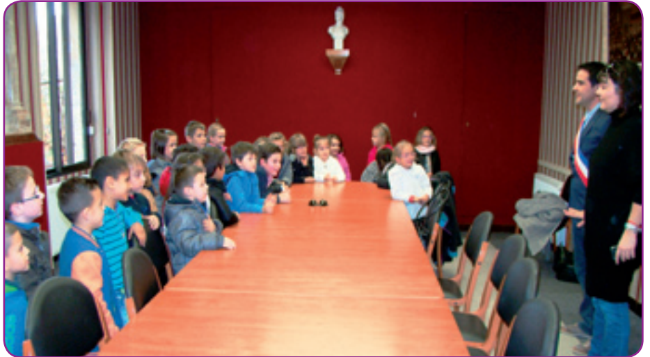
Une visite en mairie a permis aux enfants de mieux comprendre les valeurs de la République.

Au préalable, les enfants avaient aussi réalisé des dessins en soutien aux victimes des attentats du 13 novembre 2015 et les avaient postés à destination de la Mairie de Paris.