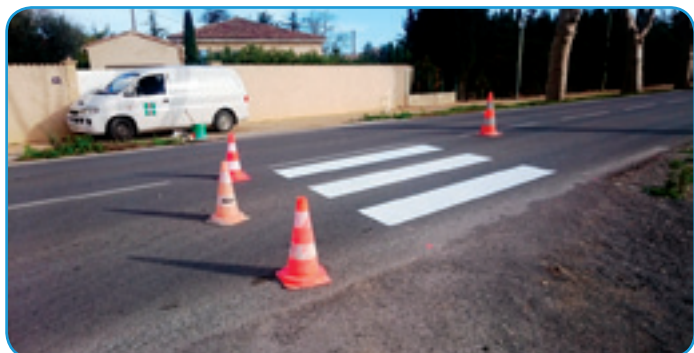
Un nouveau passage piéton pour sécuriser la traversée de la RD 607

Autre aménagement : un passage piéton a été créé sur la RD 607, au niveau de la sortie du lotissement Mon rêve, afin de sécuriser la traversée à cet endroit.