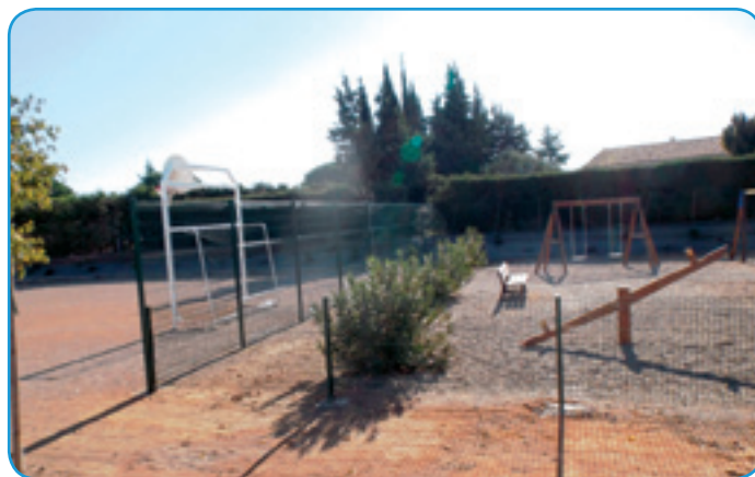
L'aire de jeux de la ZAC des Oliviers a été délimitée et enrichie de 3 nouveaux agrès (2 ici en photo).