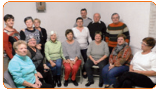
Le nouveau club des Aînés Ruraux organise un loto, 2 jeudis par mois, à la salle des fêtes

P.P. : Nous en sommes pour l'heure à l'enregistrement des adhésions pour 2016. Lors de la première séance le 14 janvier , nous avons reçu la confiance de 70 membres du village et des alentours : ça fait plaisir ! Nous allons organiser des lotos, 1 jeudi sur 2 à 14h30 à la salle des fêtes (si disponible). Nous prenons nos marques pour l'heure, puis nous augmenterons la cadence des animations, peu à peu ».