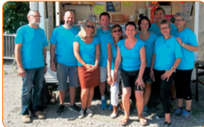
Les bénévoles de l'ESSM-SM sur le pont, en toute saison !