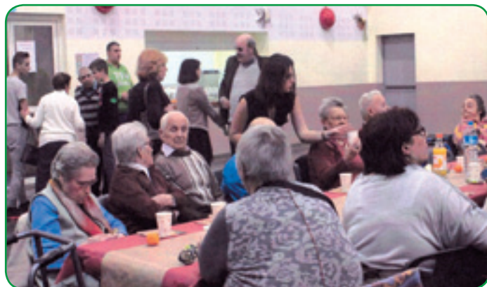
Les ados et les bénéficiaires du SAD, réunis le temps d'un après-midi récréatif.

Le 9 décembre , 25 bénéficiaires du service de Soins à domicile (SAD) de Saint-Marcel sur Aude se sont retrouvés au CAC de Ginestas. En présence d'élus du CCAS, ils ont partagé un après-midi récréatif et intergénérationnel : en effet, les jeunes des Accueils de loisirs du territoire avaient préparé un spectacle pour l'occasion. Une pause gourmande était ensuite accompagnée d'un récital de chants de Noël, par le groupe Cinq à Sept. Au terme de ces festivités, un colis de Noël offert par le CIAS Sud Minervois a été remis à chaque bénéficiaire par les ados du canton.