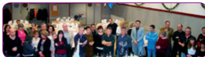
Les agents communaux ont écouté le discours d'accueil du maire, avant d'échanger avec les élus, lors de la cérémonie des vœux