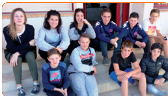
Les jeunes ont participé activement à la réalisation et à la vente du calendrier sur le village

Pour rappel : cette initiative originale est aussi solidaire, puisque les bénéfices de la vente permettront aux ados de financer les manifestations qu'ils organisent toute l'année sur le village, ainsi qu'un voyage, en août.