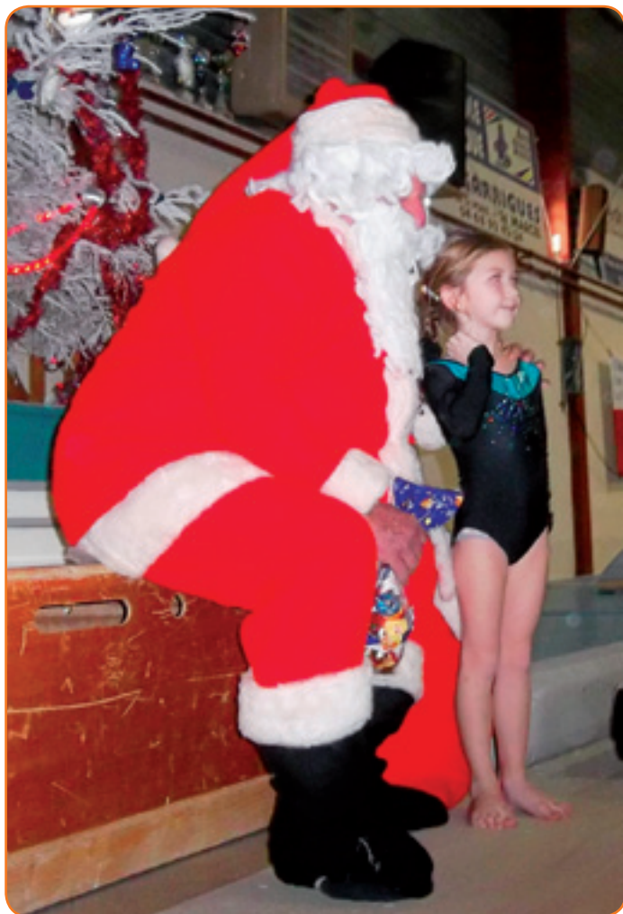
Après avoir accueilli le Père Noël, le gymnase de Saint-Marcel sera le cadre de 2 compétitions de gym en 2016