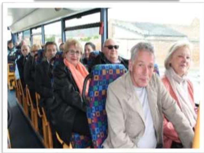
Le repas des Anciens