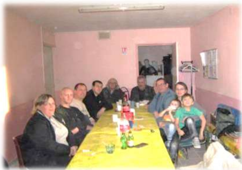
Travaux effectués dans le local situé face au cimetière

Notre commune s'investit beaucoup et tout le monde y retrouve son compte !