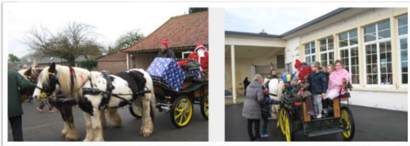
École Andrée Warin