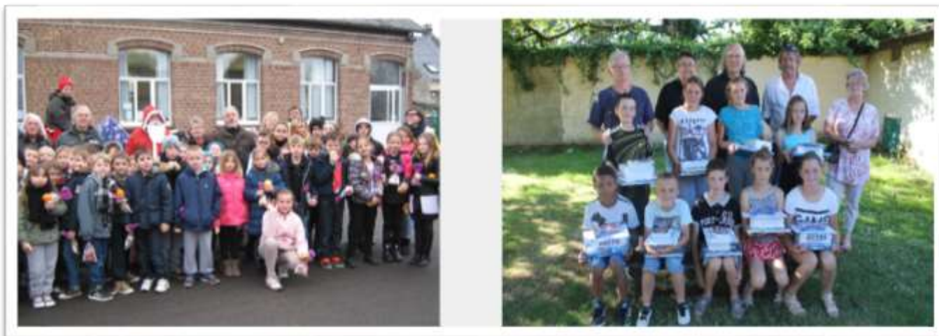
Remise des médailles aux élèves qui ont participé au Cross du Collège de Ribemont