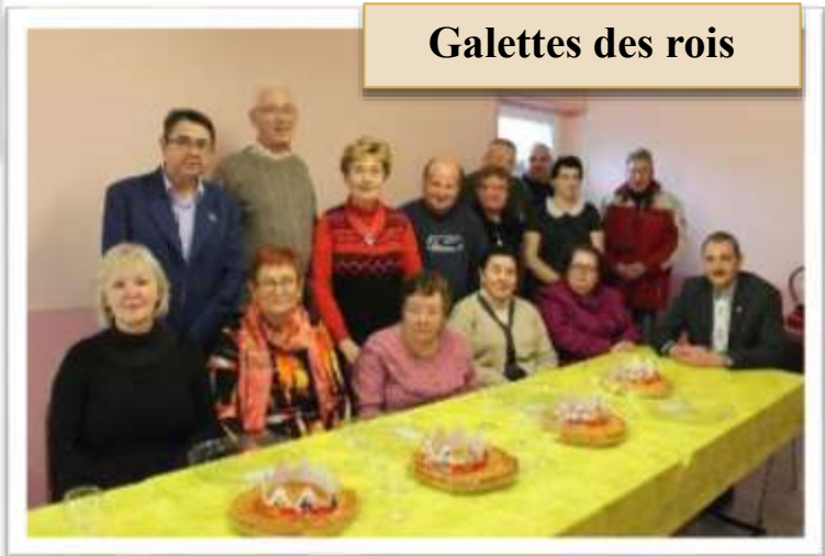
Galettes des rois