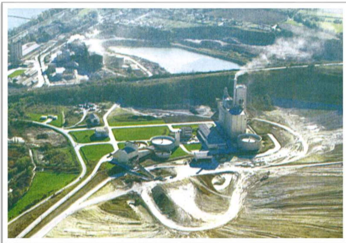
CIMENTERIE GRÈVE DE 1936