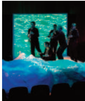
Musique de papier