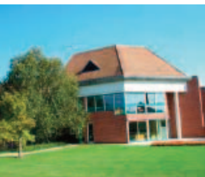
Maisons de retraite Fontenelle

Lorsque la solitude s'installe chez les résidents des maisons de retraite de Chauny, des visiteuses bénévoles interviennent, afin de rompre cet isolement de plus en plus fréquent avec l'allongement de la durée de vie.