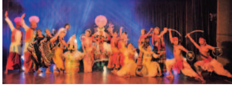
Ballet national de Delhi