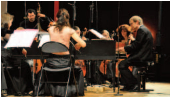
Concert du Cercle baroque